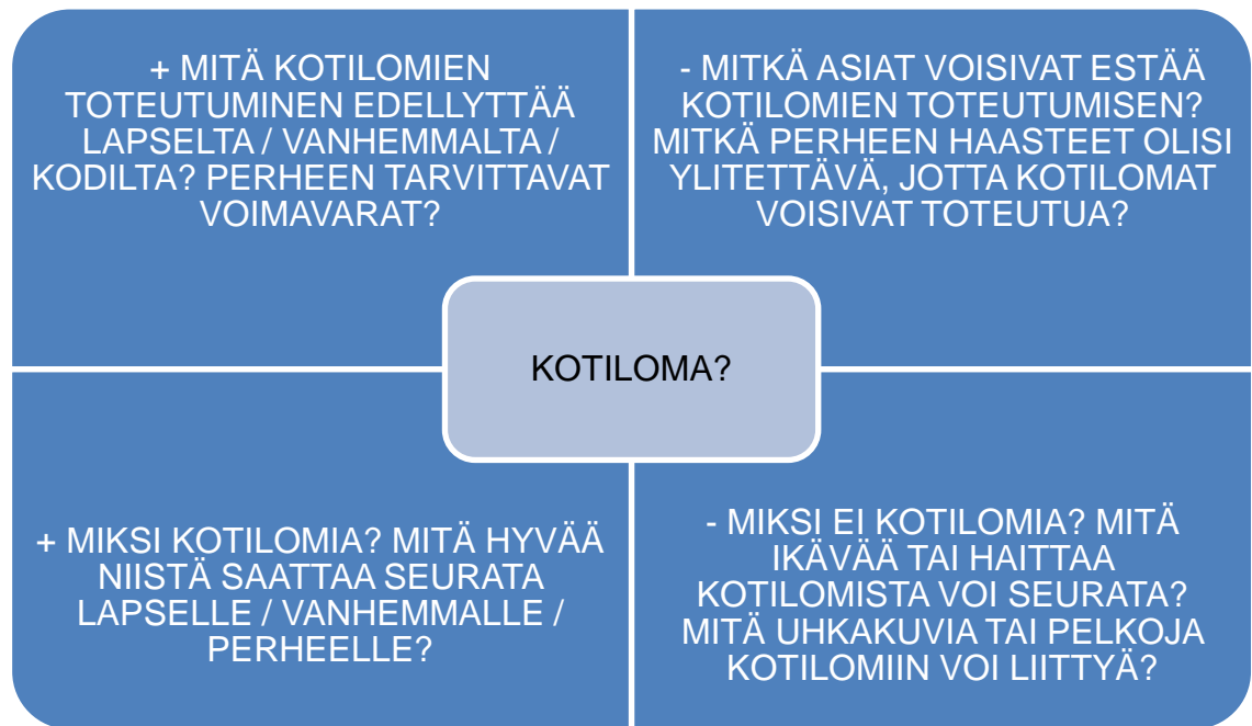
Kuvio 1. Näkökulmia lastensuojelun sijaishuollon kotilomakäytännön jäsentelyyn.

Kuviossa 1 esitetyt näkökulmat ovat läsnä, kun tehdään päätöksiä kotilomien puolesta tai vastaan. Pääsääntöisesti – ei kuitenkaan aina – kotilomat ovat lapsen ja perheen toiveissa. Tällöin ohjaajien on yhdessä perheen ja sosiaalityöntekijän kanssa puntaroitava perheen edellytyksiä kotilomiin: riittävätkö vanhemman voimavarat lapsesta huolehtimiseen, onko kotilomien esteenä olevat asiat mahdollista korjata, hyötyykö lapsi kotilomista tai onko lapsen kasvun ja kehityksen kannalta edullista viettää pitkiäkin aikoja vanhemman kotona.