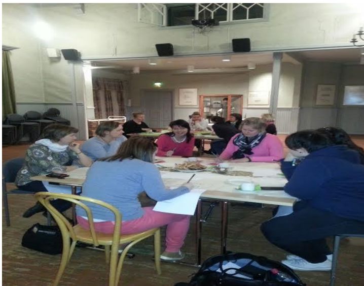
KUVA 2. Ryhmäkeskusteluiden teemasta ”Mikä edistää / estää yhteistyötä”

Tietämättömyys toisten tekemisistä ja toimintojen päällekkäisyys eli samanaikaisuus olivat toimijoiden mielestä yhteistyötä estäviä tekijöitä. Toimijoita ja vapaaehtoisia on vaikea löytää, koska he ovat jo monessa mukana, henkilökemiat sekä kokemus siitä, että toimintaan on vaikea päästä, koska on niin pienet piirit, nähtiin toisaalta pienen paikkakunnan yhteistyötä estäväksi tekijäksi. Vapaaehtoisten toimijoiden rajalliset resurssit liittyvät siihen, että usein puuttuu lastenhoito, mikä koettiin esteenä toimintaan osallistumiselle.