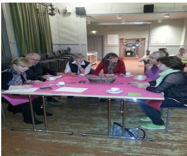
KUVA 1. Ryhmäkeskusteluiden teemasta ”Mitä yhteistyö on?”

Kahvila Hiilen pöydässä yksi keskustelun teemana oli ”Mitä yhteistyö on?” Keskustelijat pohtivat aihetta useasta eri näkökulmasta. Sosiaalisuuden näkökulma tuli esiin keskustelijoiden pohdintoissa ja mielipiteissä. Keskustelijoiden mukaan yhteistyö on yhdessä tekemistä, vastuun jakamista, sosiaalista vuorovaikutusta, hyvien käytäntöjen vaihtoa sekä tutustumista uusiin ihmisiin ja toimijoihin. Toisaalta yhteistyö on keskustelijoiden mielestä tasavertaista, toisten tukemista ja taakan jakamista. Tiedottamisen näkökulmasta yhteistyö keskustelijoiden mielestä voi olla tiedotusyhteistyötä sekä yhteistä aikataulutusta päällekkäisyyksien välttämiseksi. Yhteisen päämäärän näkökulmasta keskustelijat pohtivat, että yhteistyö on myös verkostoitumista yhteisten tavoitteiden avulla. Taloudellisessa mielessä yhteistyön koettiin vähentävän taloudellista riskiä ja kustannuksia. Oman kehittymisen kannalta nähtiin yhteistyön antavan uusia näkökulmia. Yhteistyötä tekemällä tapahtuu myös tiedon siirtoa sukupolvelta toiselle.