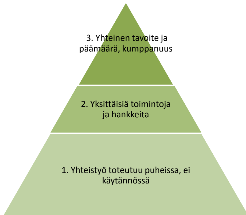
KUVIO 1. Yhteistyön tasot

Tutkimusten mukaan kuntien ja eri toimijoiden yhteistyössä on havaittavissa kolme tasoa (Kuvio 1). Ensimmäisellä tasolla yhteistyö toteutuu puheen tasolla ja juhlapuheissa, mutta ei näy käytännössä. Tätä tasoa kutsutaan kohteliaisuus vaiheeksi. Toisella tasolla yhteistyö toteutuu yksittäisissä toiminnoissa tai hankkeissa. Tällöin saadaan aikaan pieniä ja lyhytkestoisia konkreettisia asioita. Tässä vaiheessa kuitenkin yhteinen tavoite ja kokonaisvaltainen ote puuttuvat. Kolmannella tasolla yhteistyö on osa organisaation strategiaa. Tässä vaiheessa yhteistyön mahdollisuuksia selvitetään ja liitetään osaksi organisaatioiden toimintasuunnitelmaa. Tällä tasolla yhteistyössä on yhteisiä tavoitteita ja suunnitelmia toiminnan suhteen. (Suomen kuntaliitto 2002, 14.)