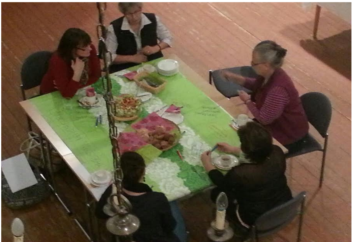
KUVA 3. Ryhmäkeskusteluiden teemasta ”Miten yhteistyötä voisi kehittää”

Kolmannen pöydän keskustelun teemana oli: ”Miten yhteistyötä voisi kehittää?” Keskustelijat pohtivat tiedottamisen näkökulmaa. Yhteistyön kehittämistä edistäisi omien tapahtumien ilmoittaminen jo suunnitteluvaiheessa, huomioimalla muiden organisaatioiden tiedot ja taidot sekä pyytämällä rohkeasti yhteistyöhön. Toimijoiden pohdinnoissa, miten yhteistyötä voisi kehittää, keskusteluissa syntyi myös konkreettisia kehittämisajatuksia. Keskustelijat olivat sitä mieltä, että yhteisellä toimijoiden tutustumisillalla olisi merkitystä yhteistyön kehittymisen kannalta. Yhteistyötä edistäisivät yhteinen tiedottaminen, tapahtumakalenteri, ammattitaitopankki, järjestöpankki sekä se, että toimijoiden yhteystiedot saataisiin johonkin näkyville.