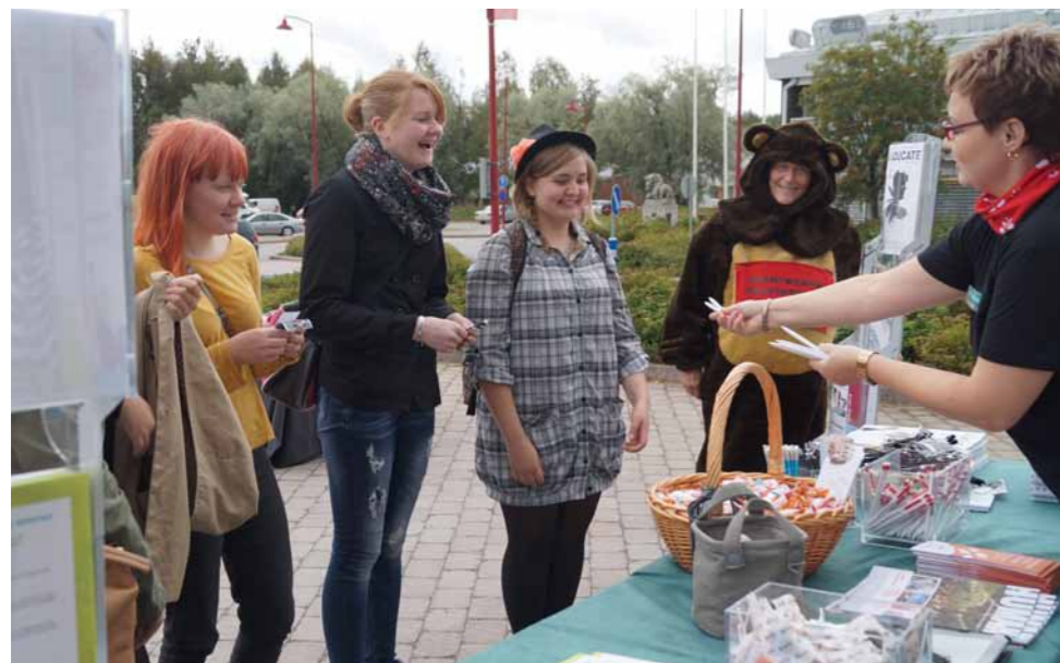
Opiskelu - vaihtoehto talviunille. Maakuntakorkeakoulu Karhu mielessä -festivaalilla Ilomantsissa.