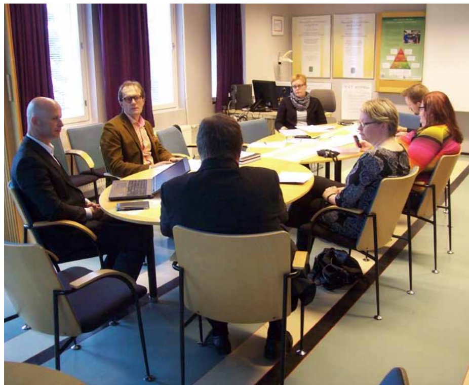
Maakuntakorkeakoulun Ylä-Karjalan työryhmä koolla Nurmeksessa.

Pohjois-Karjalan maakuntakorkeakoulun toiminta perustuu yhteistyöhön ja vahvaan verkostoon. Projektina vuonna 2006 alkanut toiminta on vakiintunut osaksi Karelia-ammattikorkeakoulua. Toimintaa koordinoi Karelia-ammattikorkeakoulun henkilöstöön kuuluva maakuntakorkeakoulukoordinaattori.