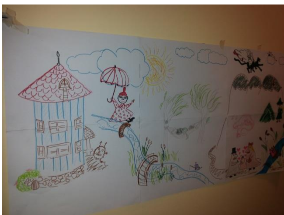
Kuva 3: Valmis suunnitelma

aloitamme seinän maalaamisen maanantaina 20.10. klo 16.30. Nuoret päätyivät siihen tulokseen, että haluavat tehdä seinämaalauksen pelkästään tavallisilla maaleilla eivätkä halua käyttää spray-maaleja. Sovimme, että hankimme seuraavalle kerralle maalit, joissa on ainakin päävärit sekä musta ja valkoinen, mahdollisesti myös vaaleanpunainen. Kaiken kaikkiaan tämä kolmas suunnittelukerta meni aivan todella hyvin. Oli mahtava huomata, kuinka nämä kolme nuorta osallistuivat suunnitteluun ja piirtämiseen omien taitojensa ja uskalluksensa mukaan, mutta tärkeintä kuitenkin on se, että nämä nuoret ovat mukana projektissa ja heistä näkee, että he myös ihan pitävät siitä. Oli myös taas ilo huomata, kuinka nuoret juttelivat meille laajasti kaikesta, aika paljon elämästä ja arjesta Kaislikossa ja juttelimme me heidän kanssaan ihan televisio-ohjelmistakin. Vaikka meille olisi tietenkin sopinut hyvin sekin, että Kaislikon aikuiset olisivat myös projektissa mukana. Näiden kahden suunnittelukerran aikana oli kuitenkin tullut sellainen olo, että olikin ehkä parempi, että olimme vain me ja nuoret. Sillä näinä kertoina, kun olimme suunnitelleet nuorten kanssa, he olivat jutelleet meille huomattavasti enemmän kuin silloin, kun aikuisetkin ovat paikalla. Hyvillä mielillä lähdimme toteuttamaan itse seinän maalaamista, kun suunnittelu oli sujunut näin hyvin! Tähän suunnittelukertaan osallistui kolme nuorta ja kerta kesti yhteensä noin 2,5 tuntia.