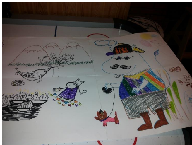
Kuva 1: Ensimmäinen suunnitelma

Olimme valmiiksi teipanneet yhteen kuusi A3- paperia, jotta saisimme suuren yhtenäisen pa-perin, jolle mahtuisimme kaikki yhtä aikaa piirtämään. Piirtämisen alussa nuoret eivät oikein uskaltaneet aloittaa piirtämistä, joten me aloitimme. Mutta sitten kun nuoret pääsivät alku-jännityksestä, niin piirtämisestä ei meinannut tulla edes loppua! Yksi nuorista seurasi piirtä-mistä jonkin aikaa, mutta ei halunnut itse piirtää, minkä jälkeen lähti omiin hommiinsa. Kol-me nuorta piirsi ahkerasti jokainen oman taitonsa mukaan, ja tuloksena oli erittäin luova pii-rustus. Vaikka aiheena olivat muumit, ei piirustus ollut perinteisten mummien näköisiä, vaan nuoret olivat käyttäneet luovuuttaan ja muuttaneet mummimaailman hahmojen ulkonäköä erittäin värikkäästi. Piirroksen tultua valmiiksi, nuoret halusivat vielä käydä teippaamassa sen seinälle, minne tulemme tekemään lopullisen tilataideteoksen.