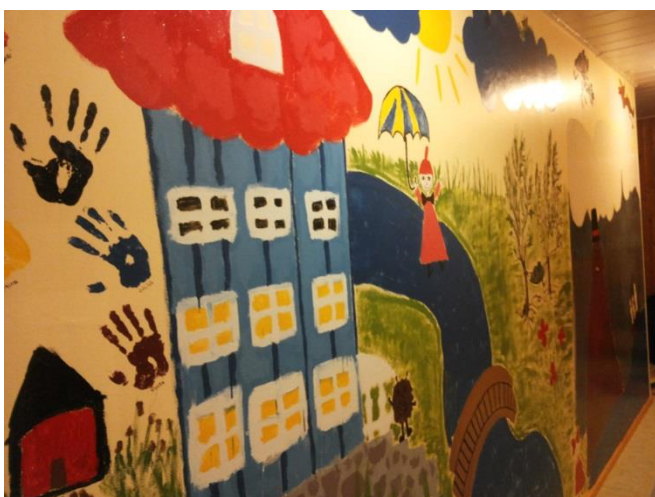
Kuva 7: Valmis seinä

Mielestämme käyntikerta onnistui täydellisesti: tilataideteos valmistui ja siitä tuli erittäin hieno ja nuoret käyttäytyivät meitä kohtaan todella sosiaalisesti; nuoret kyselivät meiltä asioita, mutta samalla kertoivat itsestään avoimesti. Tuntui kuin olisimme viimein saaneet nuorten luottamuksen. Tilataideteoksesta tuli juuri sellainen kuin halusimme: se käsitteli muumeja, mutta jokaisessa osassa ja maalauksessa näkyi nuorten oma persoona ja kädenjälki. Muumit eivät olleet suora kopio alkuperäisistä, vaan nuoret toivat tilataideteokseen jotain omaakin. Tuntui jopa hieman uskomattomalta, että kauan suunnittelemaamme ja työstämämme seinä on vihdoinkin valmis. Se on upea ja värikäs, mutta siinä on myös tummempi ja synkempi puoli. Päätimme viimeisen maalauskerän valmiin seinän äärellä ylpeinä ja onnellisina. Projekti oli täyttänyt kaikki odotuksemme ja lähdimme hyvillä mielin odottamaan torstaita 6.11., jolloin menisimme nuorten kanssa syömään ja sanomaan viimeiset sanat projektista.