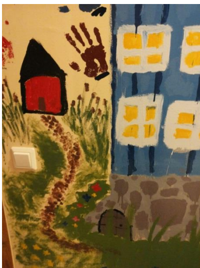
Kuva 10: Valmis seinä 4