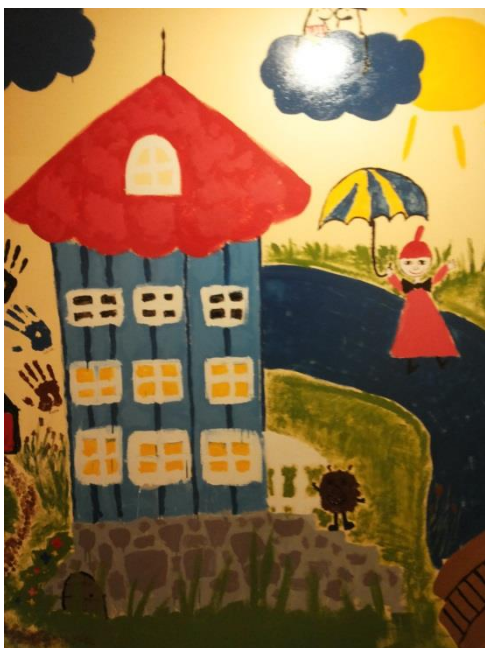
Kuva 9: Valmis seinä 3