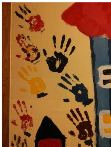
Kuva 6: Maalajien kädenjäljet

nopeasti ja lopetimme vasta, kun nuoret itse sanoivat tilataideteoksen olevan valmis. Nuoret itse ehdottivat hienoa ideaa, että jokainen maalaisi seinään myös oman kädenjälkensä ja kirjoittaisi oman nimensä, ikään kuin merkiksi siitä, ketkä ovat vastuussa tästä hienosta seinästä. Ajattelimme ensin, että vain nuoret maalaisivat kädenjälkensä seinään, mutta nuoret vaativat, että myös me tekisimme niin, koska olemme siihen osallistuneet. Tämä oli todella mukava ele ja totta kai innossamme laitoimme myös oman kädenjälkemme seinään. Viimeinen maalauskesto kesti 2 tuntia.