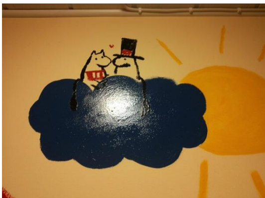
Kuva 11: Valmis seinä 5