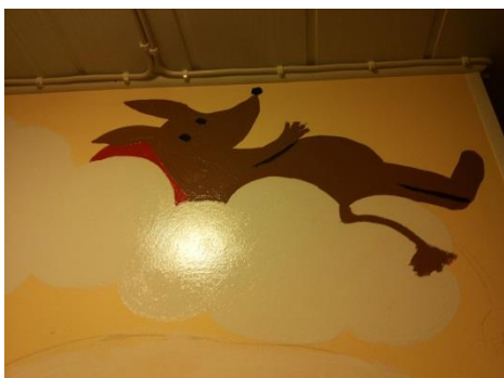
Kuva 17: Valmis seinä 11