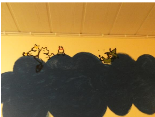
Kuva 12: Valmis seinä 6