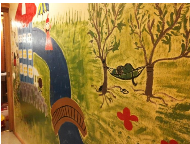
Kuva 13: Valmis seinä 7