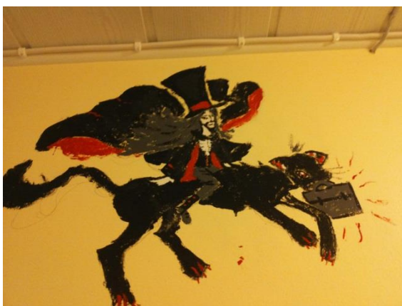
Kuva 15: Valmis seinä 9