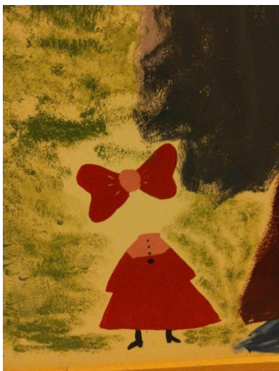
Kuva 14: Valmis seinä 8