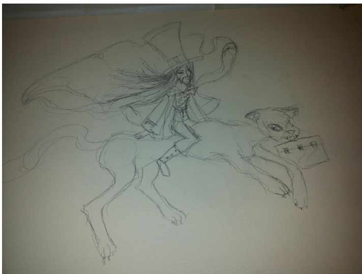
Kuva 5: Hahmotelma seinälle

Kun lyijykynällä olimme hahmotelleet seinän kokonaisuudessaan, aloitimme maalaamisen. Nuoret maalasivat innokkaasti, mutta koska maalit olivat melko voimakkaan hajuisia, kaksi nuorta lähti pois maalinkärystä, ettei se aiheuttaisi päänsärkyä. Painotimme myös nuorille, että pitäisivät välillä taukoja ja kävisivät vaikka pihalla, ettei maalien haju kävisi liian voimakkaaksi. Olimme myös avanneet ikkunoita, jotta ilma vaihtuisi. Kaksi nuorta, jotka jäi maalaamaan, maalasi koko loppuajankin. Aika meni todella nopeasti ja nuoretkaan eivät huomanneet, että taideteoksen maalaamiseen varattu aika oli loppunut. He olisivat vielä halunneet jäädä maalaamaan.