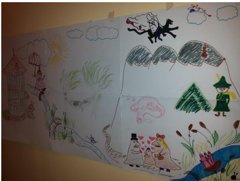
Kuva 4: Valmis suunnitelma 2