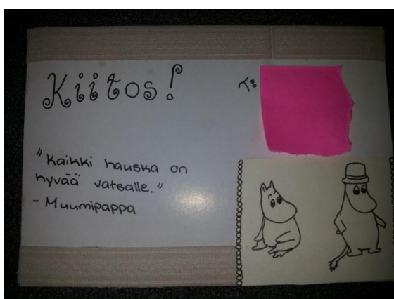
Kuva 18: Kortti nuorilta

Ruokailu onnistui hienosti ja niin nuoret kuin mekin nautimme tästä yhteisestä ravintolakerasta täysin. Kaikki viisi projektissa mukana ollutta nuorta olivat ravintolassa paljon rennompia ja vapautuneempia, kuin yhtenäkkään aiemmista kerroista. Kaikki nuoret myös juttelivat meille, jopa sellaiset, jotka yleensä eivät jutelleet. Luulemme, että tämä ravintolakerta oli mahtava päätös tälle seinäprojektille ja koemme, että tällä kerralla näimme nuorista aivan uuden ja tuttavallisemman puolen. He kertoivat asioistaan ja koulunkäynnistään meille ihan kuin olisimme vanhoja tuttuja. Oli myös upeaa kuulla, että nuoret aidosti pitivät tästä projektista, vaikka alku vaikutti haastavalta. Syötyämme juttelimme vielä hetken, tämän jälkeen hyvästelimme nuoret ja sanoimme, että tulemme vielä keskiviikkona 19.11. käymään Kaislikossa, jolloin haastattelemme Kaislikon aikuisia projektista ja toiminnastamme.