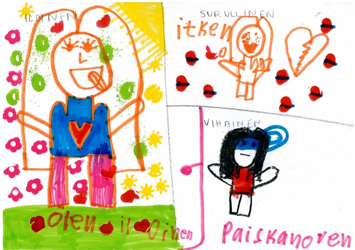
Kuvio 2. Tytön piirustus kuvastaa hänen tapaansa olla iloinen, surullinen tai vihainen.

54.) Yksi tytöistä kertoi, että vihaisena hän huutaa äidille. Juttelimme ryhmässä siitä voisiko huutamisen sijaan kertoa äidille pahasta olostaan. Pohdimme positiivisia tapoja purkaa vihaa, joita olivat tyttöjen mielestä muun muassa puhuminen toiselle, energian purkaminen johonkin muuhun ja kivan asian ajattelu. Me ohjaajat nostimme lisäksi esiin jo aiemmin mainitun urheilun tai muun toiminnallisen tekemisen, pahan olon syyn miettimisen sekä hetken rauhoittumisen omassa oloissa.