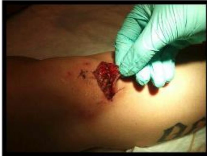
KUVA 2. Traumaattinen haava (Ruotsalainen 2012.)