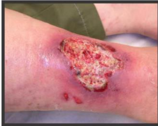
KUVA 3. Katteinen, infektoitunut haava