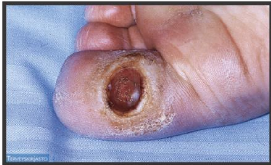
KUVA 5. Diabeteksen jalkahaava isovarpaan alla (Rönnemaa 2009.)