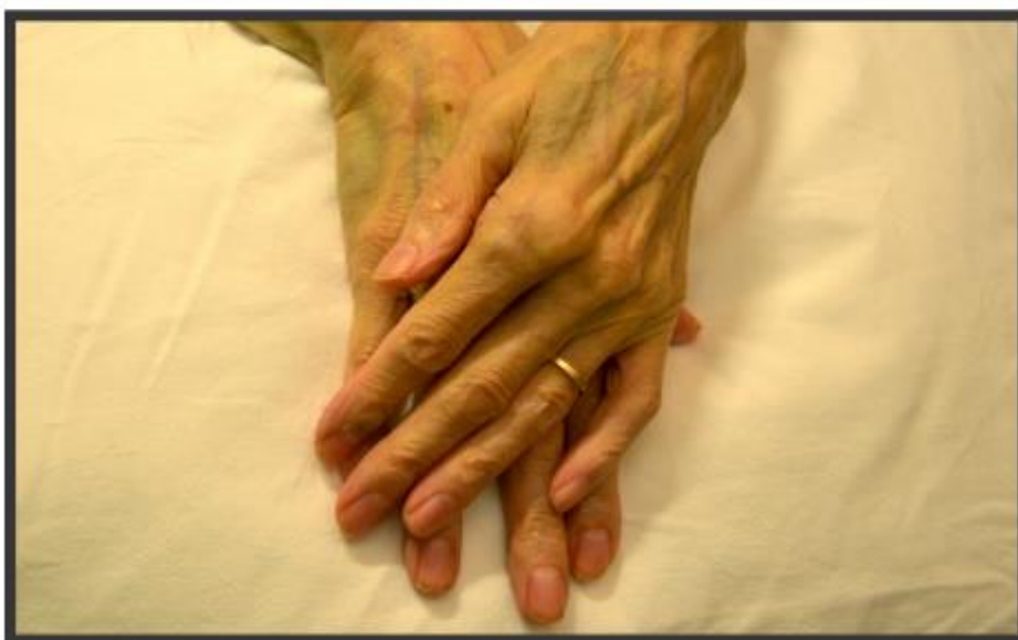
KUVA 6. Vanhuksen iho (Väänänen 2014.)