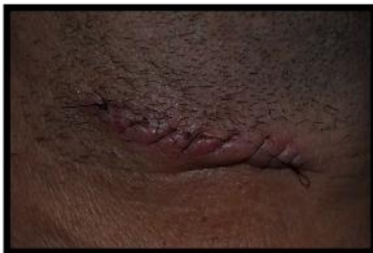
KUVA 1. Ommeltu haava (Nissinen 2014.)