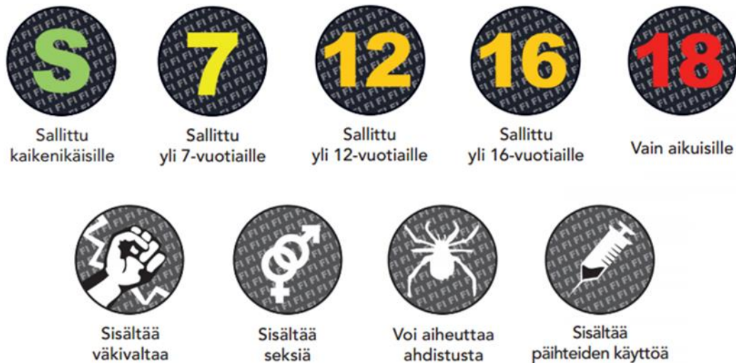
Kuva 1. Ikäraajat

(Ikäraajat televisioissa ja elokuvissa.)