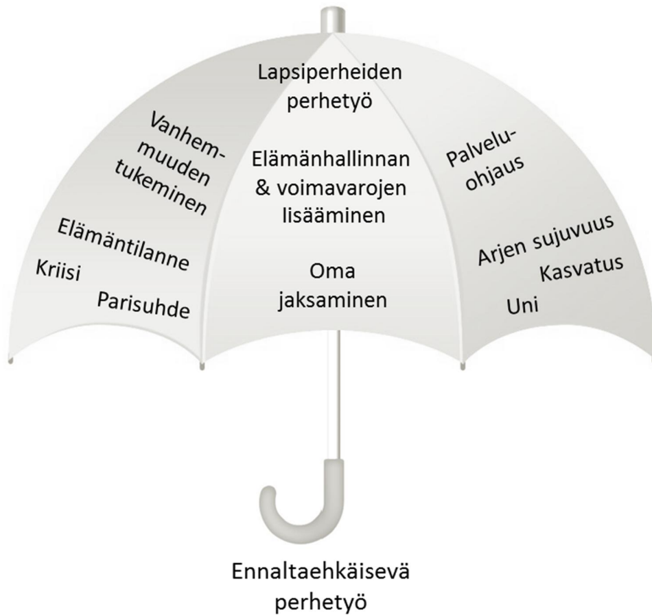
KUVIO 1. Lapsiperheiden perhetyön kuvaus mukailten Heinon, Bergin & Hurtigin sateenvarjokäsitettä