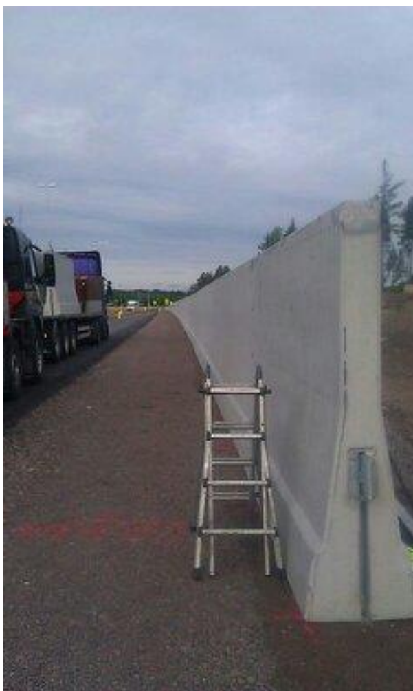
KUVA 4: Matala betonielementtiseinä Sutelan ja Heinlahden eritasoliittymien välillä kesäkuussa 2013 (Akseli Mussalo 2013)