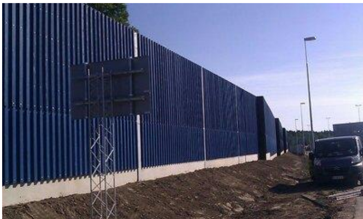
KUVA 3: Meluseiniä Kotkan Sutelan eritasoliittymässä elokuussa 2013

Meluseinät ovat suhteellisen ohuita, vähintään 2 m korkeita meluntorjuntarakenteita. Kuvassa 3 on kahdesta puurakenteisesta seinäelementistä koostuva seinä. Kuvassa 4 on matala, noin 2 m korkea betonielementtiseinä. Seinät voidaan rakentaa paikanpäällä puusta tai elementtirakenteisena puusta tai betonista. Seiniä käytetään kohteissa, joissa vaaditaan huomattavaa melun vaimennusta ja tilaa esteen rakentamiselle on vähän. Riittävä vaimennus saadaan aikaan jo ohuellakin rakenteella, joten esteen paksuuden lisääminen ei ole kannattavaa. Meluseiniä voidaan käyttää korkeana esteenä sellaisenaan tai seinä voidaan sijoittaa matalana meluvallin päälle silloin, kun vallin muutoin vaatima tila kasvaisi liian suureksi. (Tien meluesteiden suunnittelu 2010, 22.)