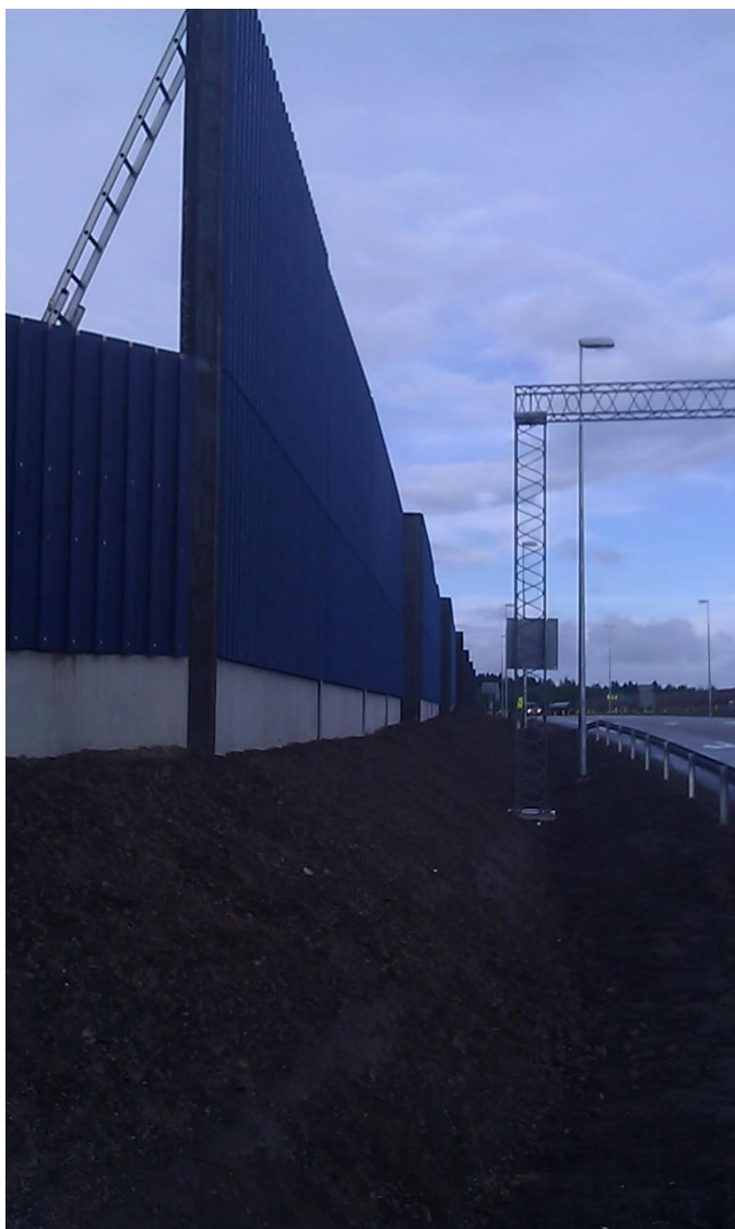
KUVA 10: Lähes valmis meluseinä Sutelan eritasoliittymässä elokuussa 2013

Seinäelementit tulevat työmaalle paketteina, joissa kussakin on neljä elementtiä. Paketteja purkaessa on ehdottomasti muistettava paketin riittävä tukeminen. Täysi paketti pysyy tasaisella alustalla tuulettomissa olosuhteissa pystyssä ilman tuentoja. Vajaa paketti on aina tuettava kaatumisen estämiseksi vaikka alusta olisikin tasainen. Ennen seinäelementin asentamista sokkelin päälle levitetään sokkelikaista kosteuseristeeksi ja estämään veden kapillaarinen nousu betonista sokkelielementtiä pitkin puurakenteiseen seinäelementtiin. Seinäelementti lasketaan paikalleen aina pilarien yläpäähän kautta. Nostaminen on tehtävä käyttämällä etälaukaistavia koukkuja. Elementtiä ohjataan siihen kiinnityttyjen ohjausnarujen avulla.