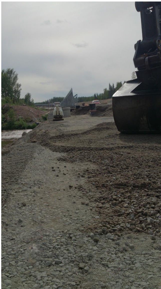
KUVA 8: Pengermelukaiteen pohjien tekoa kesällä 2014 (Akseli Mussalo 2014)