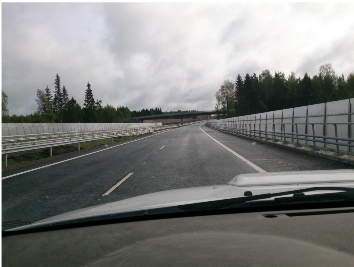
KUVA 2. Läpinäkyvää melukaidetta Taasianjoen vesistö sillan kohdalla (Akseli Musalo 2014)

Käytettävissä oleva tila määrää huomattavasti käytettävän estetyypin valinnassa ja sijoittamisessa. Meluvalli on tilan salliessa ensimmäinen vaihtoehto. Ahtaissa kaupunkiympäristöissä vallin rakentaminen on harvoin mahdollista ja vallin sijaan rakennetaan meluseinä.