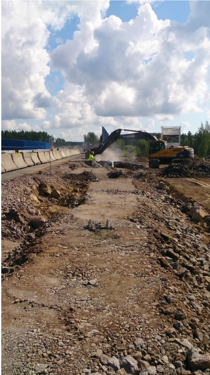
KUVA 9: Pilarijatkojen täyttötyötä Loviisan Hagalundissa kesällä 2014

Perustuselementtien ja pilarien asentamisen jälkeen asennetaan sokkelielementit. Sokkelielementtejä ei kannata laskea paikalleen pilarin avoimen yläpään kautta vaan ne "uitetaan" pilarien väliin. Uittamisella tarkoitetaan elementin nostokulman muuttamista, eli elementti on nostettaessa vinossa. Kulman muutos tehdään sää- tämällä nostoketjujen pituutta. Viimeisenä asennettava sokkelielementti voidaan kuitenkin joutua nostamaan paikoilleen pilarien yläpäiden kautta. On myös muistettava elementin asentaminen oikein päin. Elementin hiottu, tai muutoin tasoitettu tai käsitelty sileä puoli pitäisi näkyä tienkäyttäjälle. Sokkelielementeistä leikataan nostolenkit pois mahdollisimman tarkasti elementin yläpintaa mukailleen. Sokkelielemen-