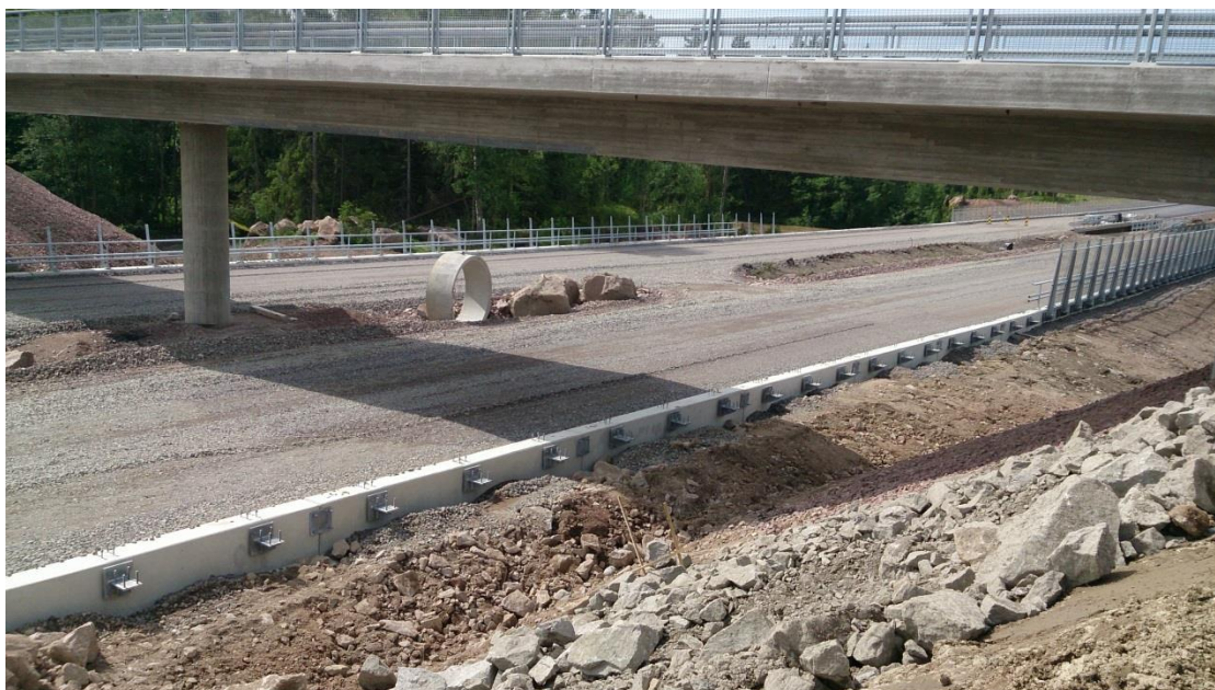
KUVA 5: Meluvallin ja läpinäkyvän pengermelukaiteen liitoskohta Tesjoella

Näkymä melukaiteen yli voidaan ratkaista käyttämällä läpinäkyviä esteitä. Läpinäkyvien esteiden haittapuolena ovat niiden korkeat kustannukset ja niihin kohdistuva ilkeävalta. Rikottuja ja töhrittyjä esteitä joudutaan vaihtamaan tai puhdistamaan. Vaihtamisen tai puhdistamisen laiminlyönti antaa tienkäyttäjälle huonomman vaikutelman kuin muut meluesteet. Kuvassa 5 on rakenteilla olevaa ja osittain valmista läpinäkyvää meluesteen ja pengerkaiteen yhdistelmää. Läpinäkyvä melueste kiinnitetään reunapalkkiin pylväiden varaan. (Tien meluesteiden suunnittelu 2010, 24–27.)