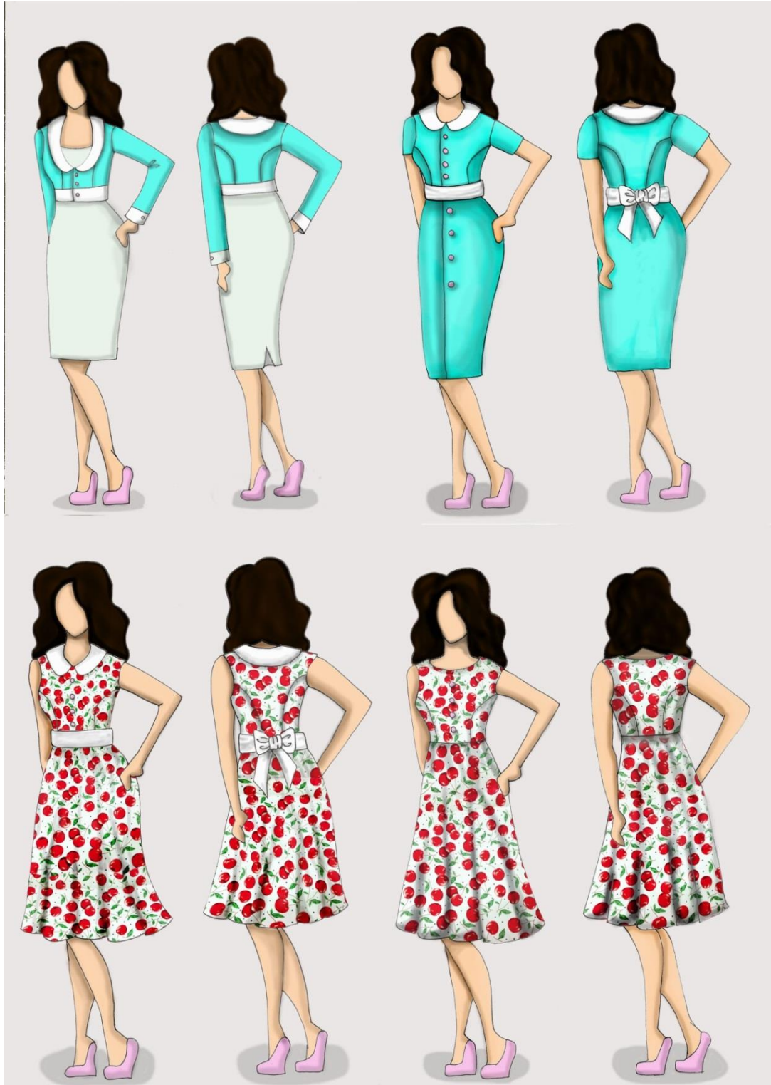
Kuvio 3 Esityskuvat mallistosta