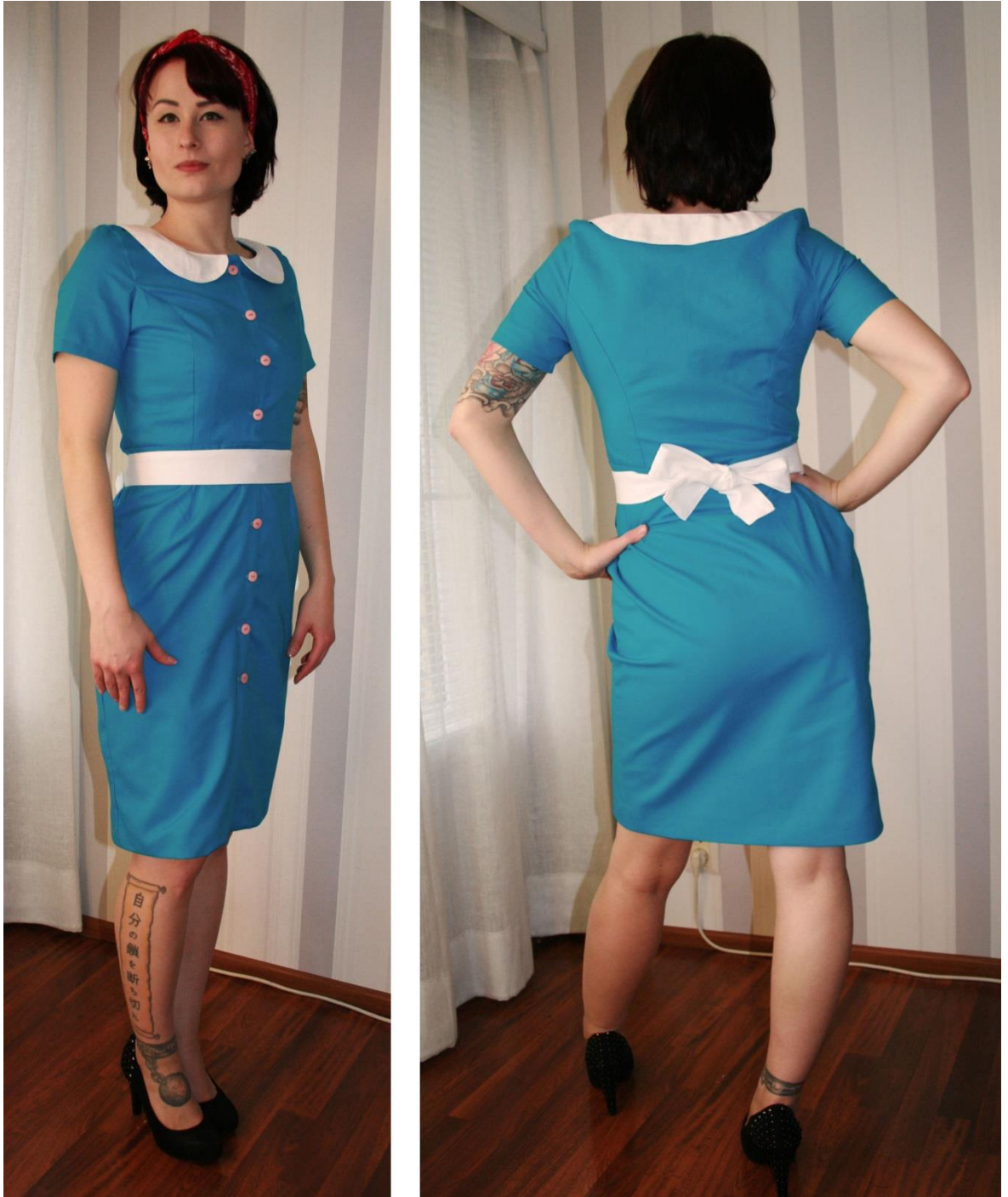
Kuva 13 Kynähelmainen mekko

Kynähelmainen mekko on myös turkoosista ja valkoisesta puuvillasta toteutettu. Vyö on irrotettava, mutta kuuluu olennaisesti tähän vaatteeseen. Edessä on napituskiinnitys ja napit ovat vaaleanpunaisia.