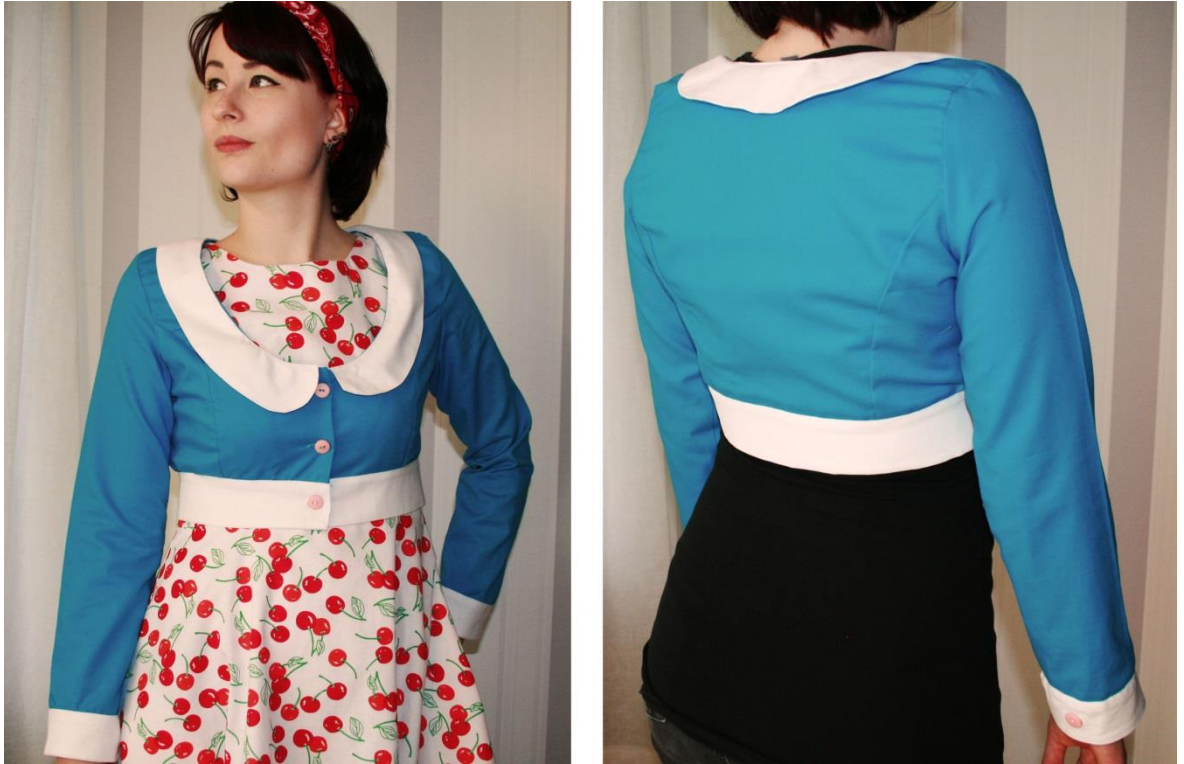
Kuva 14 Takki

Takissa on käytetty turkoosia ja valkoista puuvillaa. Se on tyköistuva malli, jossa on melko avara kaula-aukko, jolloin alla oleva vaate pääsee myös esiin. Se sopii kellohelmäisen mekon kanssa sekä rennommin topin ja farkkujenkin kanssa. Edessä on napituskiinnitys, hihoissa napit ovat pelkästään koristeita ja napit ovat vaaleanpunaisia.