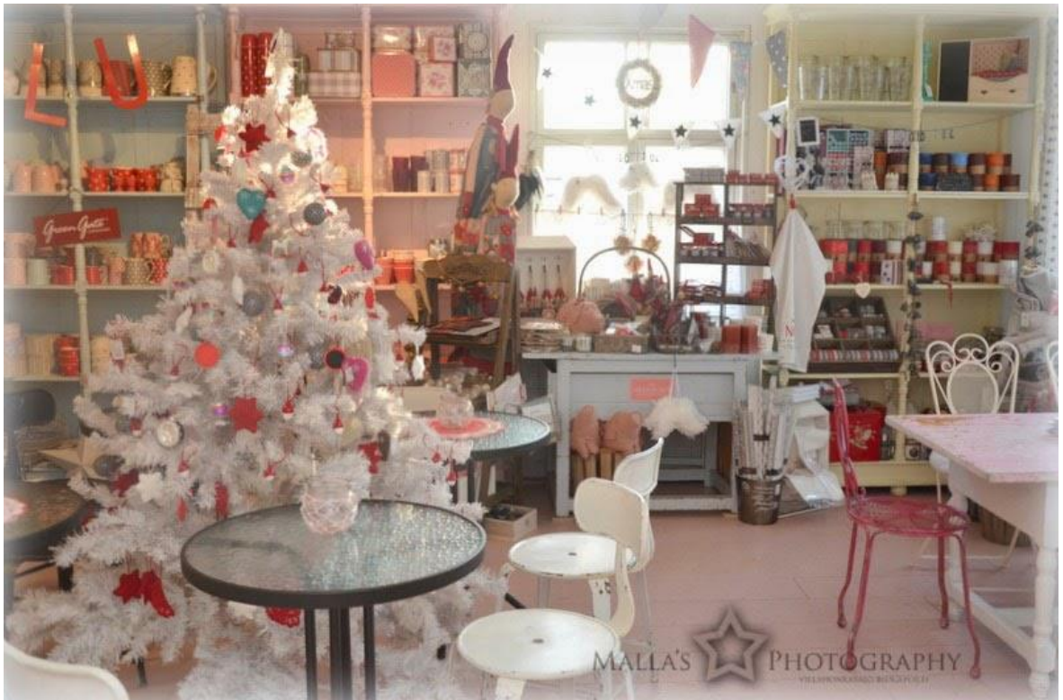
Kuva 1 Mallan Makeat-puoti joulutunnelmissa (Malla Ruutiainen 2014).

Ensimmäinen kuva on Mallan Makeat-puodin sisustuksesta joulusesongin aikana (kuva 1). Kuvassa on paljon tavaraa, etualalla kahvilaan kuuluvia pöytiä ja tuoleja, joulukuusi ja takana puodin hyllyt, jotka ovat melko täynnä tavaraa. Värimaailma on pääosin hyvin vaalea, joko valkoinen tai vaaleanpunainen. Lisämausteena värimaailmaan on kirkkaanpunaisia yksityiskohtia joulusesonkiin sopivasti. Puodissa on käytetty paljon pastellisävyisiä huonekaluja ja hyllyjä. Suurimmassa osassa huonekaluista näkee, että ne ovat vanhoja ja uudelleen käsiteltyjä, paitsi lasiset pöydät vaikuttavat uusilta. Koristeluista huomaa selkeästi, että on tulossa joulu. Tuotteissakin toistuvat kirkkaanpunaiset sekä pastelliset sävyt. Tunnelma kuvassa on kotoisa, vaikka joka paikassa on paljon tavaraa ja erilaisia yksityiskohtia.