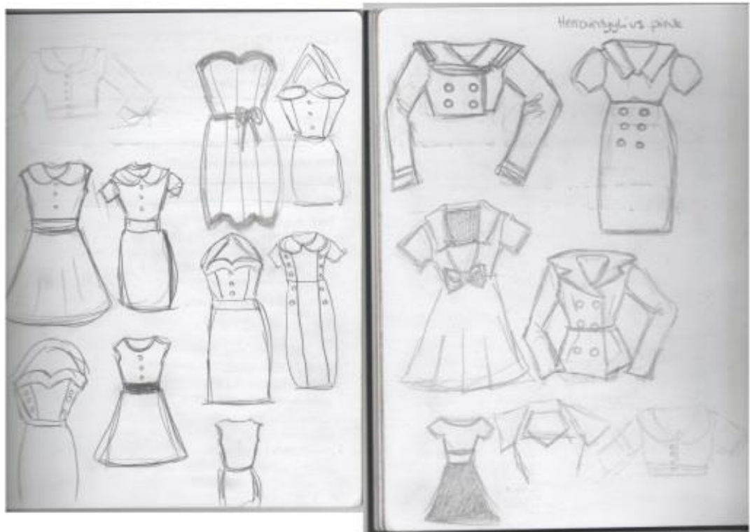
Kuvio 1 Ensimmäisiä luonnoksia