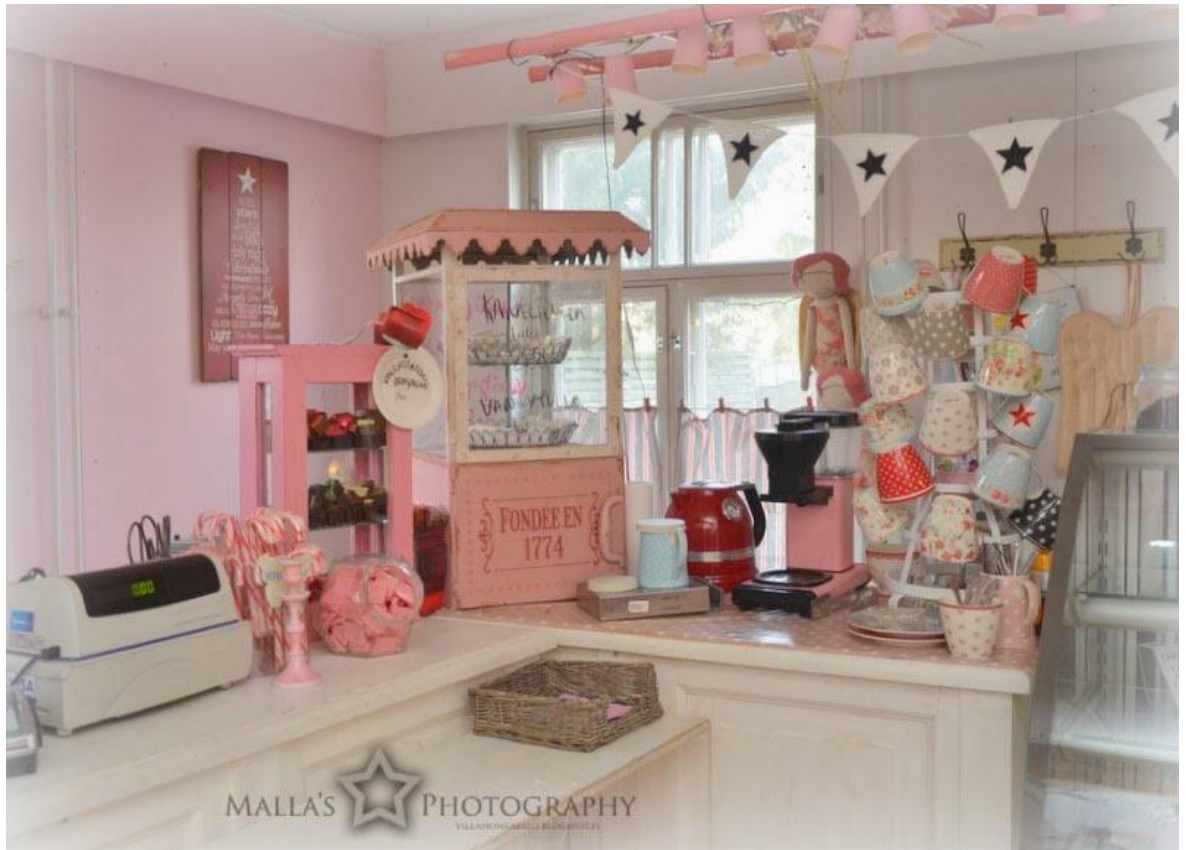
Kuva 2 Mallan Makeat-puodin tiski (Malla Ruutiainen 2014).

Toisessa kuvassa on Mallan Makeat-puodin tiski (kuva 2). Kuvassa näkyvät muun muassa kassakone, kahvikuppeja, kahvinkeitin ja säilytystilaa tuotteille. Tässäkin kuvassa värimaailma on hyvin vaalea, valkoista on käytetty paljon. Sen lisäksi vaaleanpunainen on melko hallitseva värisävy, jota löytyy mm. kahvinkeitimestä, kupeista, kattolampusta ja tuotteiden säilytystiloista ja tuotteista itsessään. Muita selkeästi huomattavia värejä ovat kirkkaanpunainen sekä vaaleansininen. Vaikka pöytä tuntuu olevan täynnä tavaraa, jokaisella tavaralla näyttäisi olevan oma paikkansa, johon se luonnollisesti kuuluu. Kokonaisuus on selkeä ja harkittu.