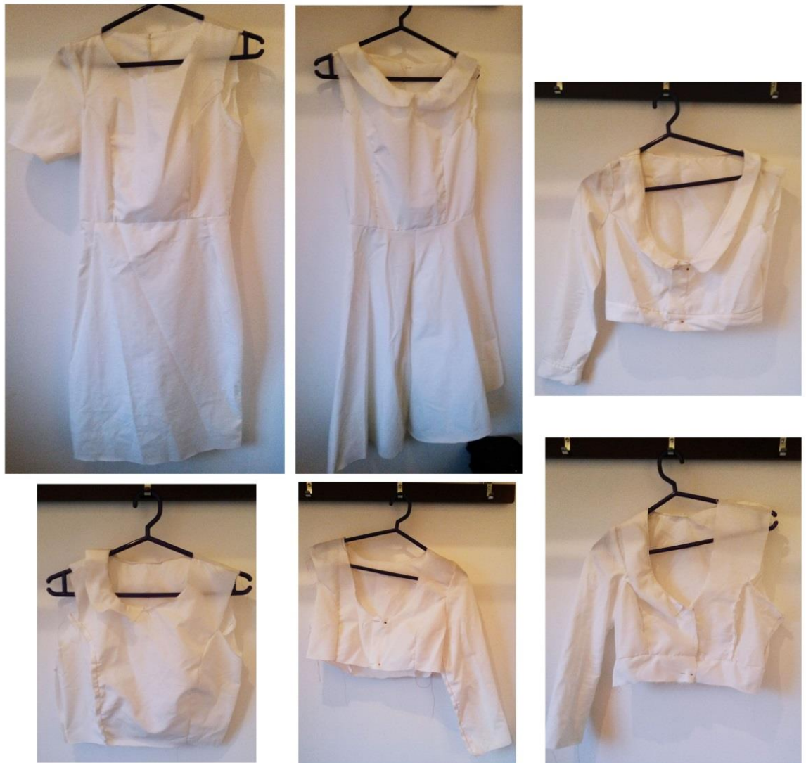
Kuva 11 Kokeilukappaleita vaatteista

mekosta ja kellohelmaan tein kaksi eri versiota. Käytin samaa yläosaa pohjana takille, johon tein tarvittavat kaavamuutokset. Koska vaatteet toteutetaan joustamattomasta materiaalista (puuvilla), ja ne ovat tyköistuvia, kaavamuutoksia yläosaan joutui tekemään paljon, että vaatteen saa istumaan hyvin päällä. Yläosaa jouduin muokkaamaan ja testaamaan useampaan kertaan aikaansaadakseni vaaditun istuvuuden. Olkasaumaa, kädentietä sekä päántietä piti muokata ja testata monta kertaa (kuva 11). Kiinnitysmekanismejakin jouduin vielä miettimään uudelleen ja muuttamaan. Kun sain ulkopuolen kuositeltua haluamaani muotoon, kaaivoitin sen jälkeen kaulukset, alavarat ja vuorit vaatteisiin.