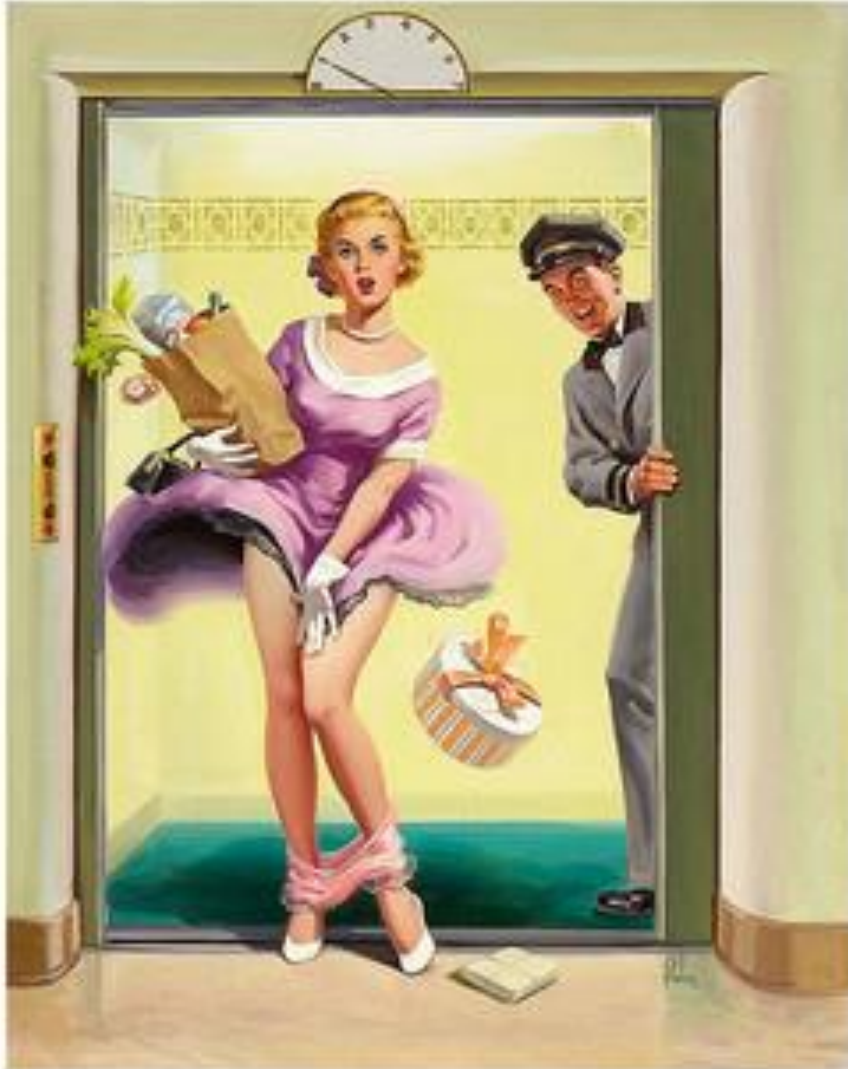
Kuva 5 Art Frahmin pin-up. (Art Frahm, 2015).

Art Frahm loi omanlaisensa pin-up –genren. Kuvissa esiintyivät herttaiset nuoret naapurintyttömäiset neidit, joilla oli ongelmia pikkuhousujensa kanssa. Kuvissa pikkuhousut olivat mystisesti tipahtaneet jalasta (kuva 5). (Kotila 2010, 35–36.)