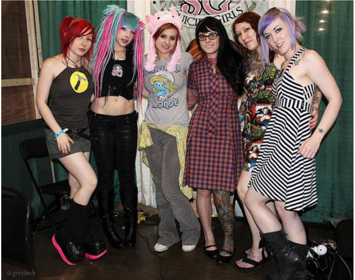
Kuva 10 Suicide Girls. (Suicide Girls, 2015).

seen paljon huomiota, sekä positiivista että negatiivista palautetta sen feminististä asennetta kohtaan. SuicideGirls on vaihtoehto valtavirtamedian ylistämälle pakkomielteelle silikonein parannellusta Barbie-nukesta ja olemattoman kuihtuneille malleilla ja tähtösille. Tavoitteena on näyttää maailmalle, etteivät kauneus ja älykkyys välttämättä ole toisensa poissulkevia asioita. (Lipsos 2013, 231.)