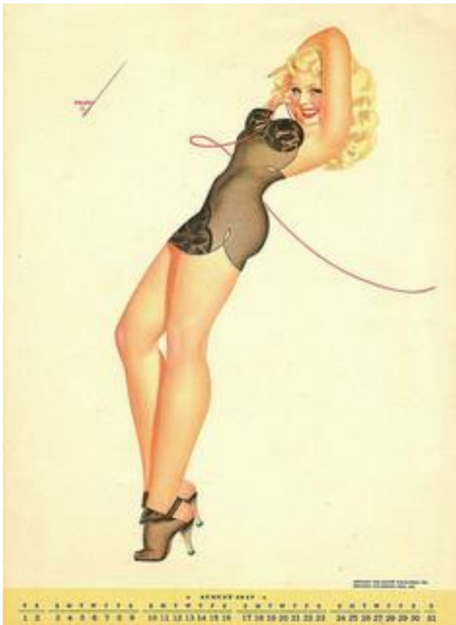
Kuva 4 George Pettyn klassinen pin-up – kuvitus (George Petty, 2015).

Pin-upilla tarkoitetaan yleisesti kuvaa (valokuvaa tai kuvitusta) vähäpukeisesta, avoimesti seksuaalisesta naishahmosta (Lipsos 2013, 16.) Pin-up oli suosituimmillaan toisen maailmansodan aikana Yhdysvalloissa, ja se muistetaan parhaiten Alberto Vargasin ja George Pettyn (kuva 4) tekemistä klassisista kuvituksista 1930- ja 1940-luvuilla. Koska amerikkalaiset sotilaat usein kiinnittivät näitä kuvia vähäpukeisista naisista nastoilla seinille (englanniksi pinned up) lievittääkseen koti-ikävänsä, jäi tästä tavasta termi pin-up. (Lipsos 2013, 13–14.) Klassista pin-up-tyttöä on toisaalta ihailtu naiseuden juhlintana ja sitä myöten voimaannuttavana feminismiin esikuvana ja taas toisaalta orjuuttavana, objektisoivana ja naisia alistavana asiana. Varsinkin eri alojen, kuten sukupuolen-, feminismiin- ja naitutkimuksen tutkijat ovat kritisoineet pin-upia sen eroottisuudesta ja liiallisesta naisellisuudesta. (Lipsos 2013, 13.)