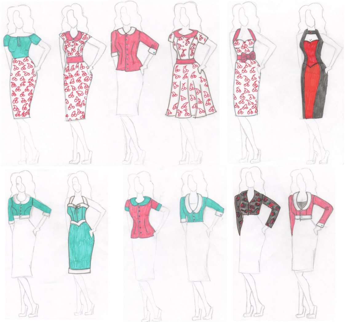
Kuvio 2 Värillisiä luonnoksia