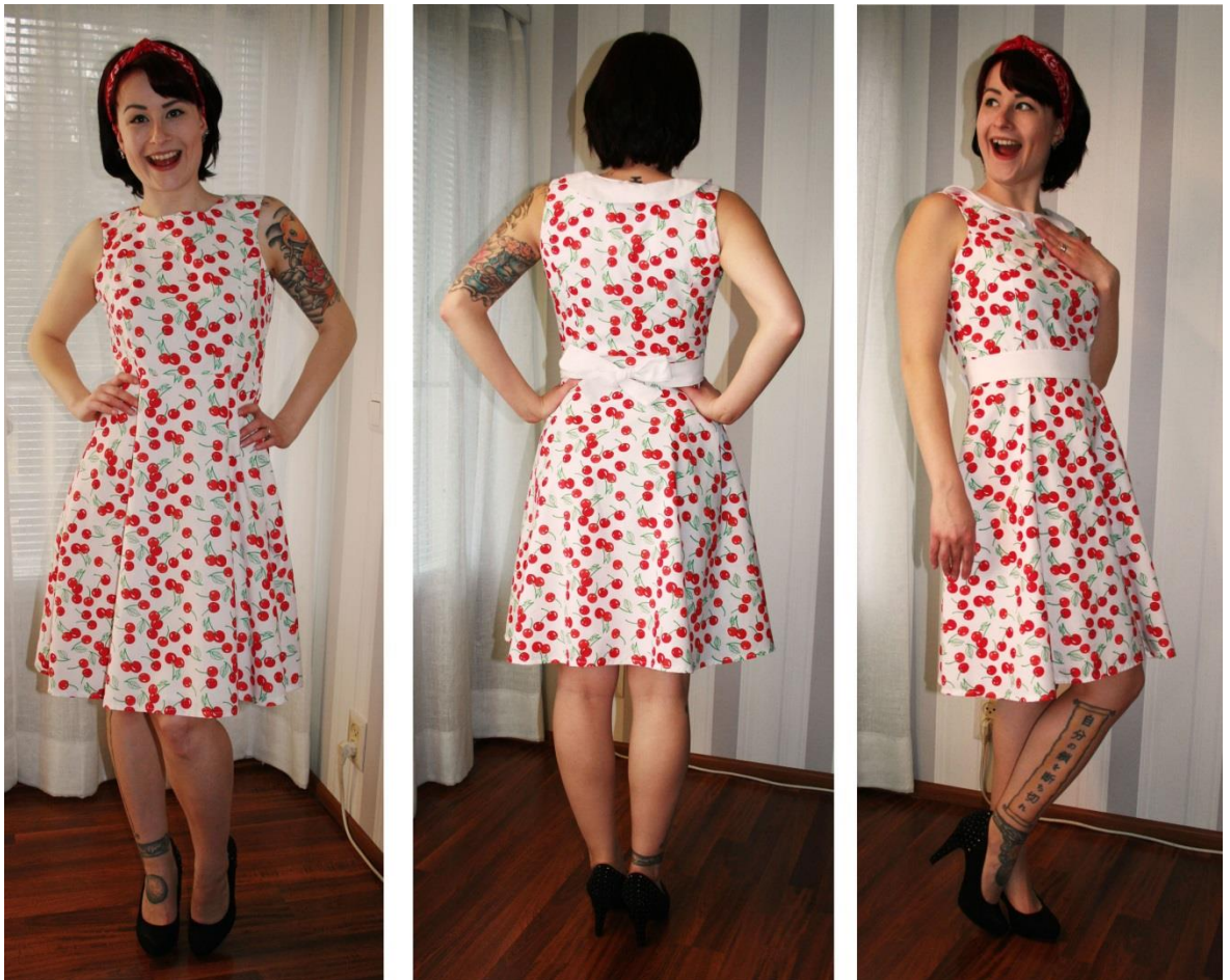
Kuva 12 Kellohelmaiset mekot

Kahdessa kellohelmaisessa mekossa on kirsikkakuosinen kangas ja toisessa valkoista puuvillaa kauluksessa. Loppuvaiheessa jätin näistä napit pois, koska mielestäni ne eivät sopineet valmiiseen vaatteeseen. Mekot ovat hyvin perinteisiä pin-up-tyyliin sopivia ja todella tyttömäisiä. Mekko toimii hyvin yksinkertaistettunakin, joten asusteet ja kaulus eivät ole välttämättömiä.