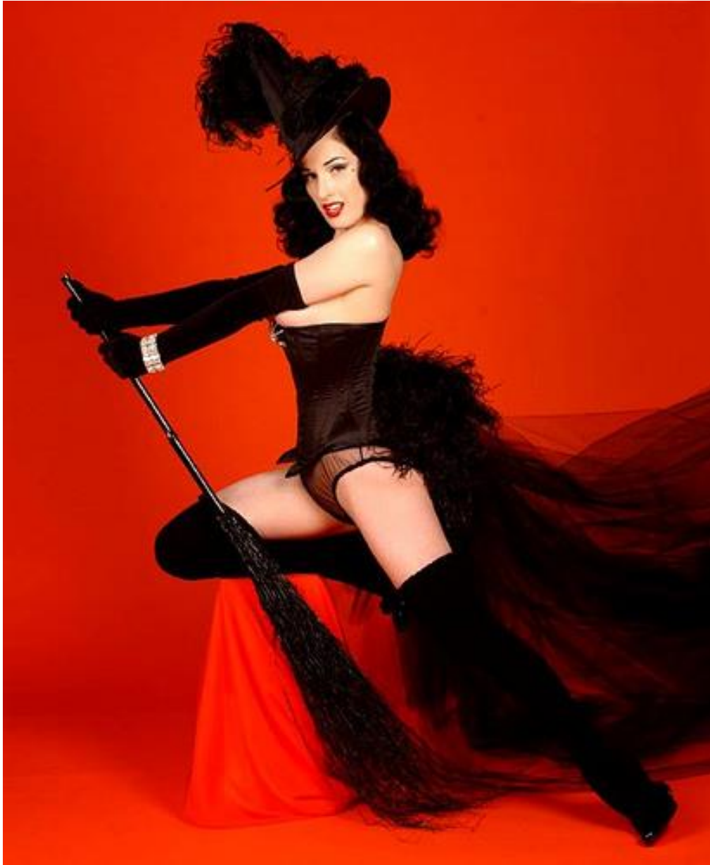
Kuva 9 Dita Von Teese. (Dita Von Teese, 2015).

Von Teesen omistautuminen pin-upin ja burleskin kiusoittelevalle luonteelle, johon hänen taiteilijanimensäkin vihjaa (tease = kiusoitella), on ominaisuus, jota hän johdonmukaisesti harjoittaa työssään. Edistämällä naisellisuuden erotisointia, jossa suurimmaksi osaksi jätetään paljastamatta kaikkea sekä hahmon ja persoonallisuuden ihannointia eroottisen naisellisuuden ilmaisun välineenä, ennemminkin ylistää naista kuin vähentäisi hänen voimaansa. (Lipsos 2013, 237–238.)