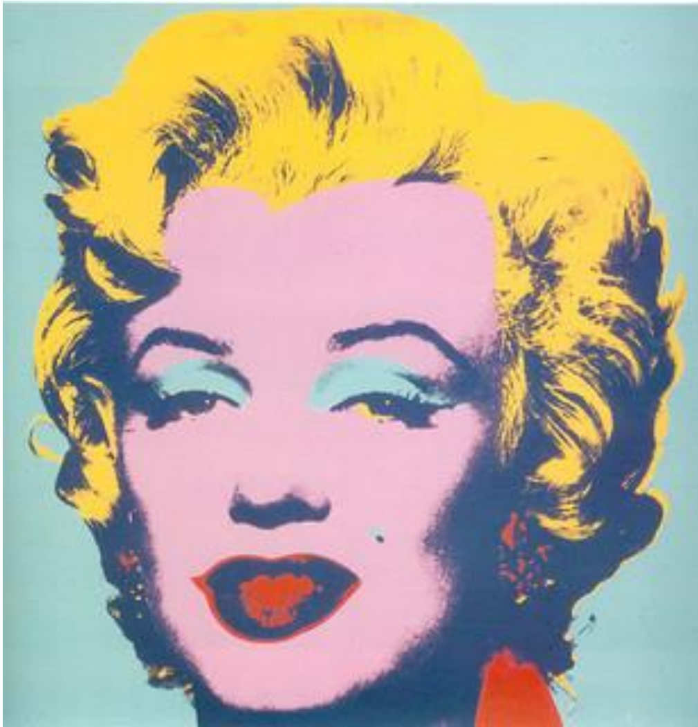
Kuva 7 Andy Warholin klassikko Marilyn Monroesta. (Andy Warhol, 2015).