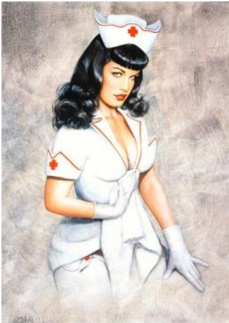
Kuva 8 Olivia De Beardinin 'Nurse Bettie'. (Bettie Page, 2015).

1970-luvun puolivälissä, juuri punkin huippukohdassa, vielä silloin tuntematon taiteilija Olivia De Berardinis aloitti eroottisen pin-up -maalaamisen ja teki taidetta niihin aikoihin unohdetun Bettie Pagen valokuvista (kuva 8). De Berardinis on kuvaillut Pagea ”pin-upin toimintasankarina”, mikä selittää Pagen viehätystä sen aikaisiin faneihin. Kuvaus yhdistetystä erotiikasta ja näkyvästä seksuaalisesta voimasta hänen kuvissaan puhutteli naisia, jotka olivat tulleet entistä tietoisemmiksi vaatimaan oikeuksiaan ja vartaloitaan takaisin itselleen. Bettien suosion nousu yhdessä entistä löyhempien seksuaalisen vallankumouksen tapojen ja punkliikkeen kanssa herätti henkiin synkän kuvakielen: pääkalloja, goottilaisia ristejä ja demoneita sekä nahkaa, niittejä ja ketjuja. Bettie Page, fetissi-jumalatar, oli täydellinen seksi-ikoni tähän tarkoitukseen. (Lipsos 2013, 223–224.)