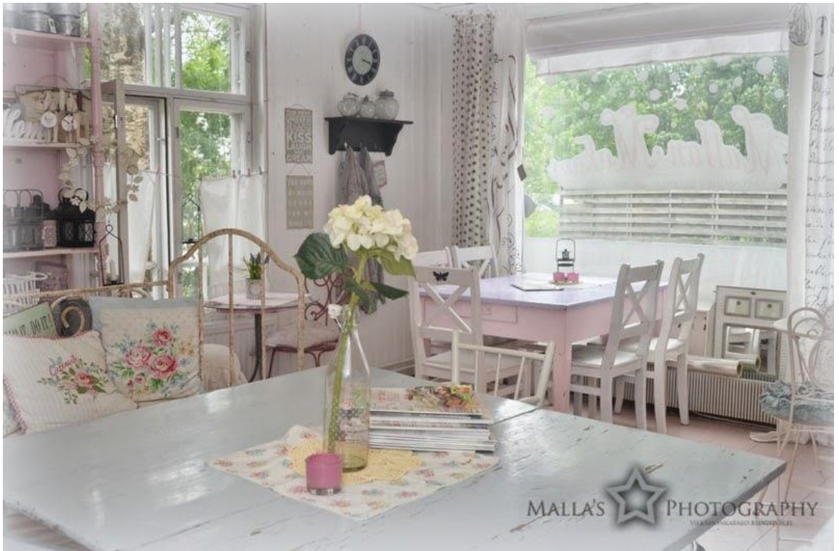
Kuva 3 Mallan Makeat-puoti kesällä (Malla Ruutiainen 2014).

Kolmannessa kuvassa puoti on kuvattu kesällä, jonka huomaa ikkunoista näkyvästä vihreydestä (kuva 3). Tämäkin kuva on sävyltään hyvin vaalea. Valkoisen lisäksi kuvassa näkyy paljon vaaleanpunaista ja vaaleansinistä. Tunnelma kuvassa on hyvin rauhallinen ja harmoninen. Kaikilla tavaroilla tuntuu olevan oma paikkansa kuvassa. Tässä kuvassa tavarapaljoutta ei ole niin paljoa, vaikka yksityiskohtia silti löytyy. Etualalla olevalla pöydällä on maljakko, jossa on kukkia ja taaempänä näkyy myös kukkakuosisia tyynyjä. Kuvassa näkyy myös jonkin verran tummia sävyjä, mikä on melko epätyypillistä puodille, joka suosii paljon vaaleita sävyjä. Ne kuitenkin ovat vain pieniä yksityiskohtia kuten seinustalla oleva hyllykkö ja hyllyssä olevat lyhdyt. Kuvassa on kesälomalle tyypillinen kiireettömyys ja rauha, että voi kaikessa rauhassa jäädä nauttimaan olostaan.