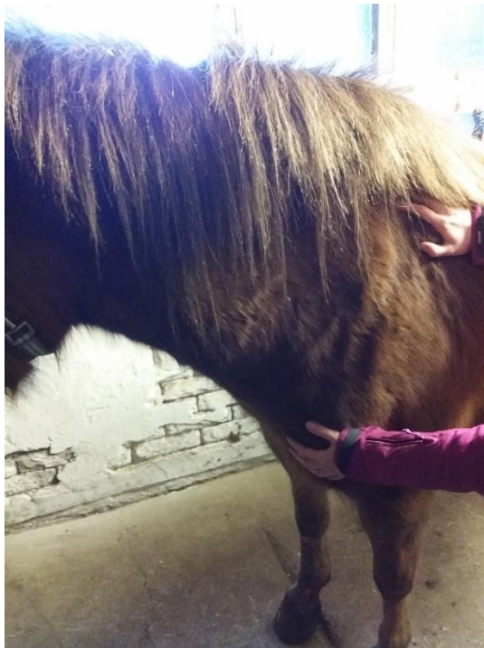
Kuva 3. Hevosen rintakorin vapauttaminen. Tavoitteena mm. parantaa hevosen etuosan toimintaa ja koko kehon työskentelyä.

Ruokinnan ja ympäristön vaikutusta kranio-sakraaliterapian ja muiden vaihtoehtoisten hoitomuotojen toimimiseen hevoselle on pohtinut muun