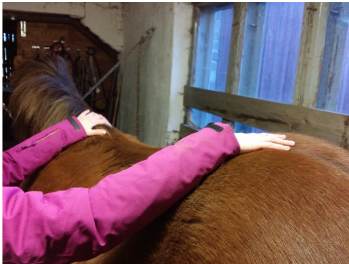
Kuva 1. Kranio-sakraaliterapiahoito aloitetaan avaamalla keho asettamalla kädet hevosen sään ja ristiluun päälle kranio-sakraalirytmää tunnustellen.

Kranio-sakraaliterapeutin otteet hevosta hoitaessa näyttävät usein siltä, ettei mitään tapahdu. Otteet ovatkin hyvin kevyet (kuva 1), eikä hoidon aikana tarvitse painaa hevosen kipeitä kohtia voimalla (kuva 2), tukokset ja jännitykset aukeavat hellävaraisella manuaalisella hoitomenetelmällä (kuva 3). Kranio-hoidolla voidaan hoitaa esimerkiksi käytös- ja ratsastusongelmia, hevosen onnettomuudesta johtuvia ongelmia tai vammoja ja hevosen keskäihottumaa. (Syvärinen 2010, 27–28.)