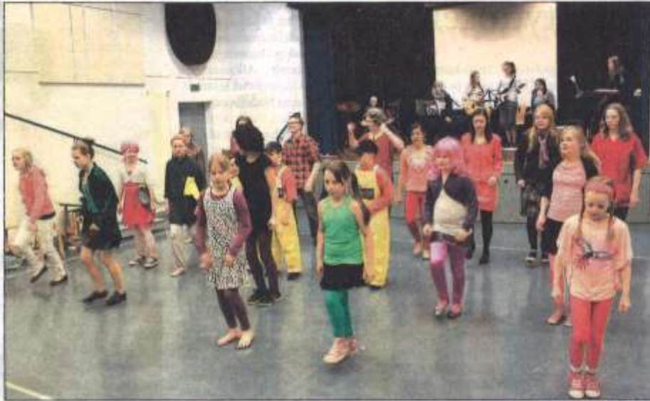
» Toivakan koululaiset tukijoukkoineen tekivät ikiloman musikaalin. Viime vuoden keväällä alkanut projekti on vaitunut tuhansia suunnittelu-, ideointi- ja harjoittelutunteja. Musikaalin ainoat esitykset ovat ensi viikolla.