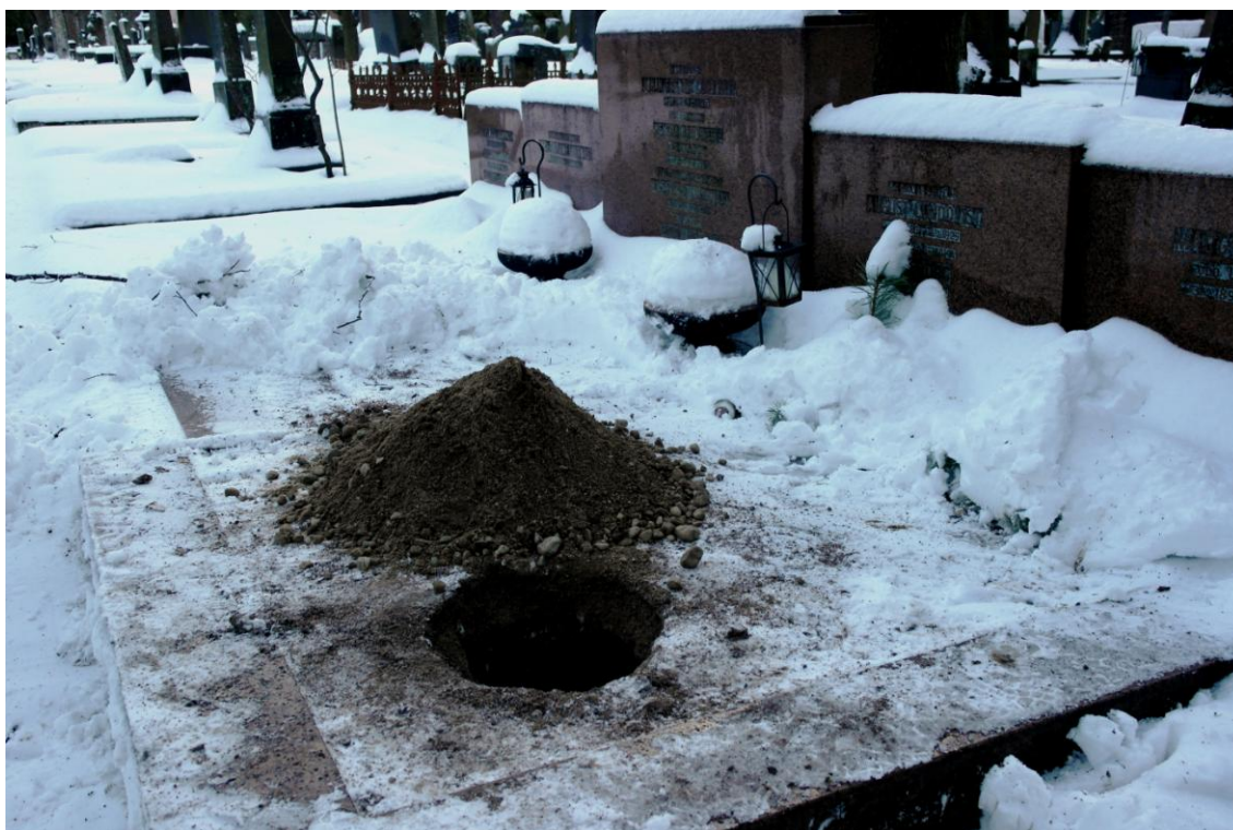
Kuvio 7. Mirva Kurkivuori, 2015

Vaikka tässä on kyseessä satiiri, siinä voi nähdä tämän päivänkin kauhufaneille tärkeän pointin: kliseet kuluvat. Jos genre noudattaa jatkuvasti samoja kaavoja, se menettää mielekkyytensä, tässä tapauksessa pelottavuuden.