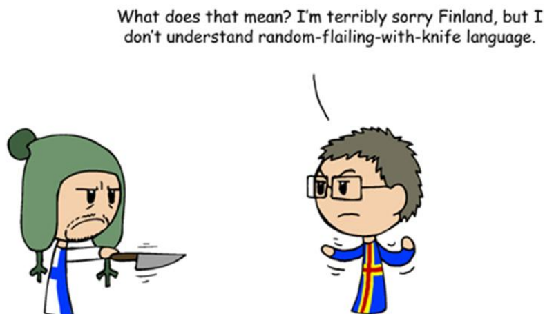
Kuvio 6. Tanskalainen Humon piirtää Scandinavia and the World -sarjisstrippejä, joissa seikkailevat eri maat ihmishahmoissa esitettynä. Ohessa Humonin näkemys Suomesta: vaihtelias puukonheiluttaja, jota pelkäävät kaikki paitsi Ahvenanmaa. (Dysfunctional Family. Scandinavia and the World < http://satwcomic.com/dysfunctional-family >.)

käyttösmalli esiintyy myös monissa suomalaisissa elokuvissa, jopa niissä hyvän mielen komedioissa, ja stereotypia on tuttu myös muunmaalaisille, kuten esimerkiksi tanskalaisen sarjakuvapiirtäjä Humonin töistä (kuvio 6) voi nähdä. Voisi sanoa, että suomalainen elokuva ei ole täydellinen ennen kuin joku huutaa, humaltuu tai hakataan.