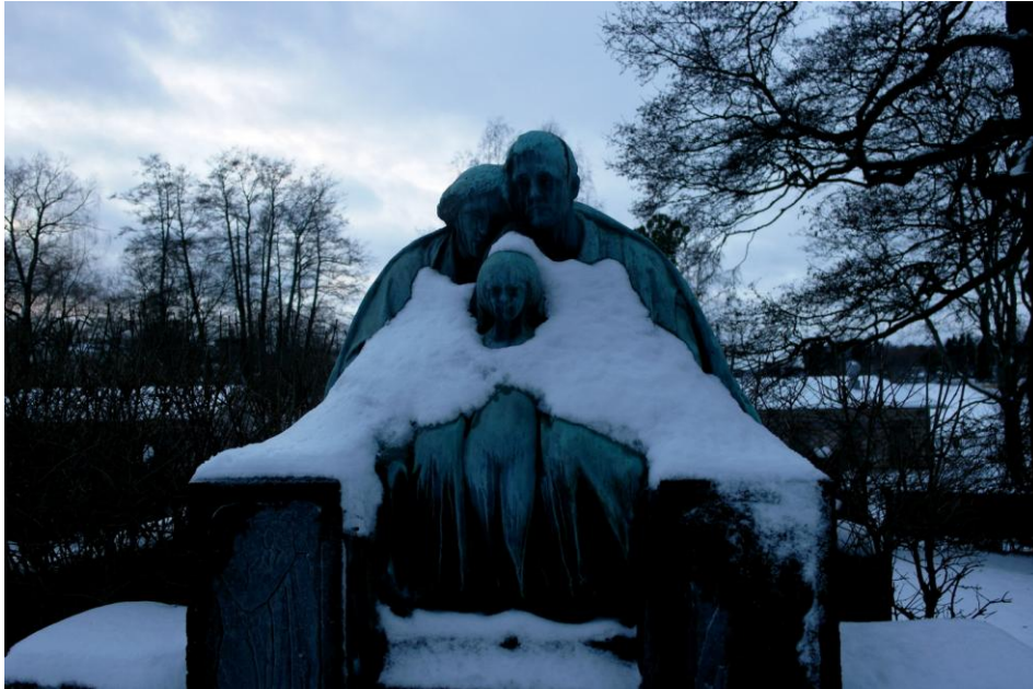
Kuvio 3. Mirva Kurkivuori, 2015

muodostaa jonkinlaisen käsityksen siitä, mikä on suomalaisten mielestä pelottavaa? Yritetään.