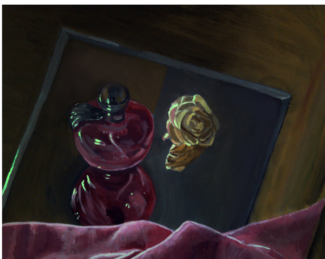
Pimeämaalaukharjoitus- Hiuskoriste ja Parfyymipullo