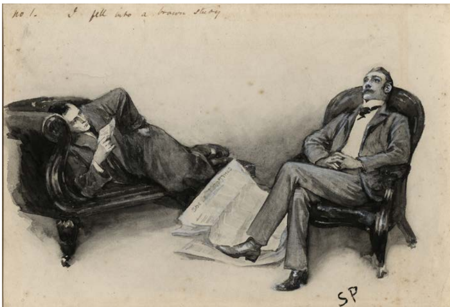
Kuva 11. Sidney Pagetin Sherlock Holmes-kuvitusta.