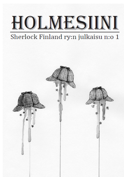
Kuva 5. Sherlock Finland ry:n ensimmäinen fanzine.

Näiden zinejen, sekä viime vuosina Turussa toimintansa perustaneen akateemisen Sherlock Finland ry:n innoittamana ryhdyin tekemään omaa fanzinea. Kyseisellä yhdistyksellä on myös oma Holmesiini-fanzine, jota käytin inspiraationa (Kuva 5). Se on ainakin oman tietoni mukaan ensimmäinen ja ainoa suomenkielinen Holmes-fanzine, oman lehteni lisäksi.