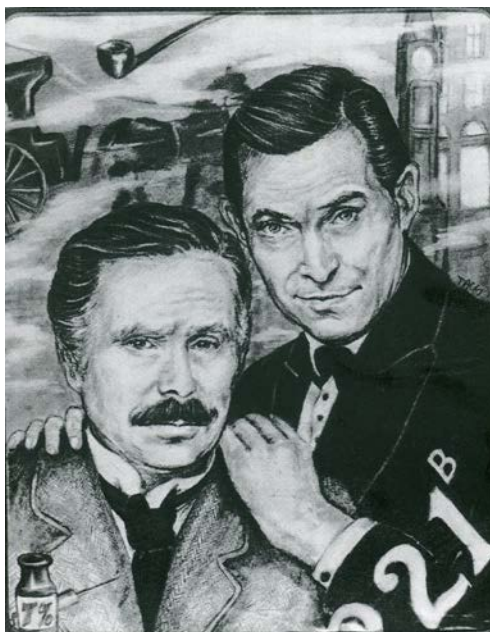
Kuva 1. TACS, No Holds Barred #3 – Holmes/Watson-aiheisen zinen kansikuva, 1993

Internetaikakauden alettua, fandomit siirtyivät zine-maailmasta verkkoon. Tämä tapahtui asteittaisesti, sillä zineja myytiin jonkin aikaa internetiin perustetuilla fanifoorumeillakin. Kuitenkin ajan myötä sekä fanifiktio, fanitaide, että fanien keskeinen kanssakäyminenkin alkoi toimia lähes yksinomaan internetissä. Fanit löytävät nykyään toisensa helposti fanittamisen kohteille perustetuissa foorumeissa, sekä internetin taidefoorumeilla. Varsinaisten paperisten fanzinejen julkaiseminen on käynyt yhä harvinaisemmaksi. (Fanloren www-sivut, 2015)