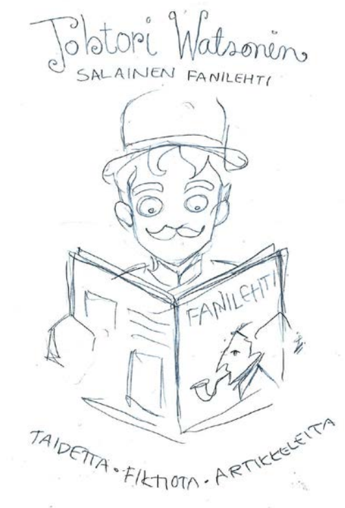
Kuva 10. Kansiluonnos fanzineen

Holmes-zinen kannta miettiessäni suunnittelin ensin piirtäväni oman kansikuvan, johon tein luonnoksia. Luonnos oli sarjakuvamainen ja pääosassa oli tohtori Watson (Kuva 10).