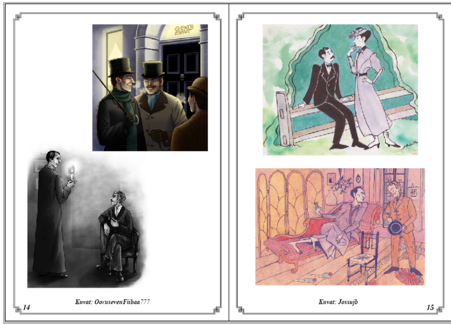
Kuva 6. Aukeama, jossa fanitaidetta kahdelta tekijältä

Tekstiaukeamia zineen tuli muutama, koostuen kolmesta eri fanifiktiosta ja yhdestä artikkelista. Tekstin elävöittämiseksi pyrin lisäämään joukkoon mahdollisimman sopivan kuvan saamastani fanitaidemateriaalista (Kuva 7).