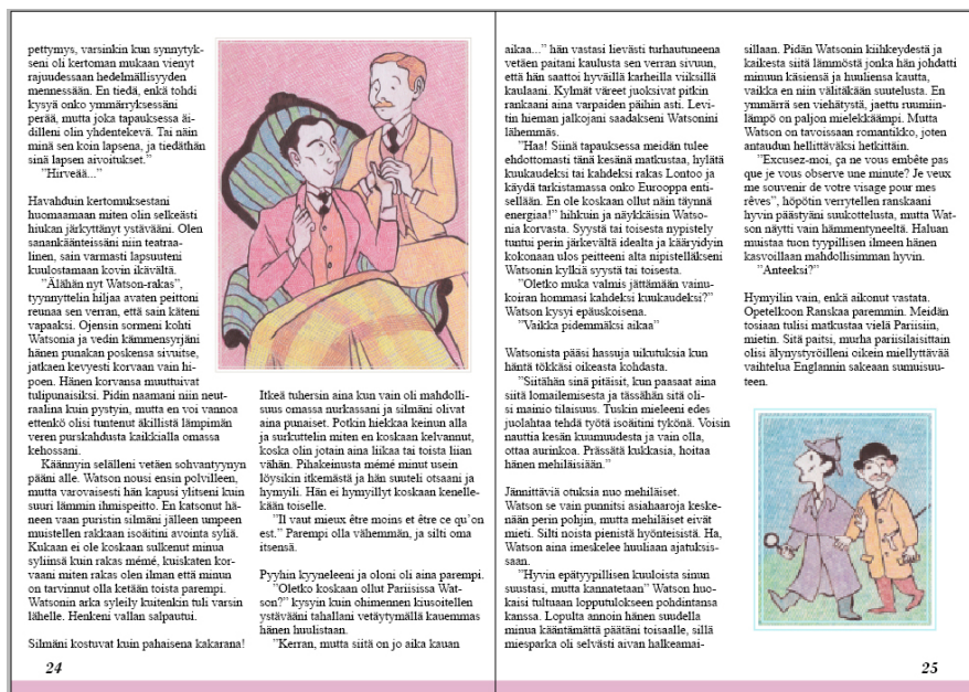
Kuva 7. Esimerkki fanifiktioita

Tekstiaukeamia zineen tuli muutama, koostuen kolmesta eri fanifiktiosta ja yhdestä artikkelista. Tekstin elävöittämiseksi pyrin lisäämään joukkoon mahdollisimman sopivan kuvan saamastani fanitaidemateriaalista (Kuva 7).