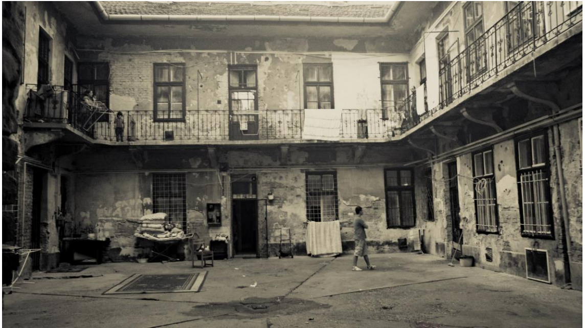
KUVA 1. Romanien asuttama kortteli Budapestissa