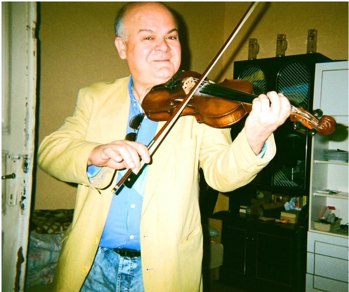
KUVA 2. Romanimies soittamassa viulua (Kuva: Romanilapsi 2014)

Valokuvatutkimuksessa olen käyttänyt lasten ottamia valokuvia kotoaan, elinympäristöstään ja läheisistä ihmisistään. Kuvat olen valikoinut sen mukaan, mitkä mielestäni puhuttelevat lukijaa ja kuvaavat myös näkemiäni oloja parhaiten. Kuvien lomassa olen käyttänyt omia päiväkirjamerkintöjä ajasta, jolloin työskentelin vapaaehtoisena romanilasten ja heidän perheidensä parissa Budapestissa.