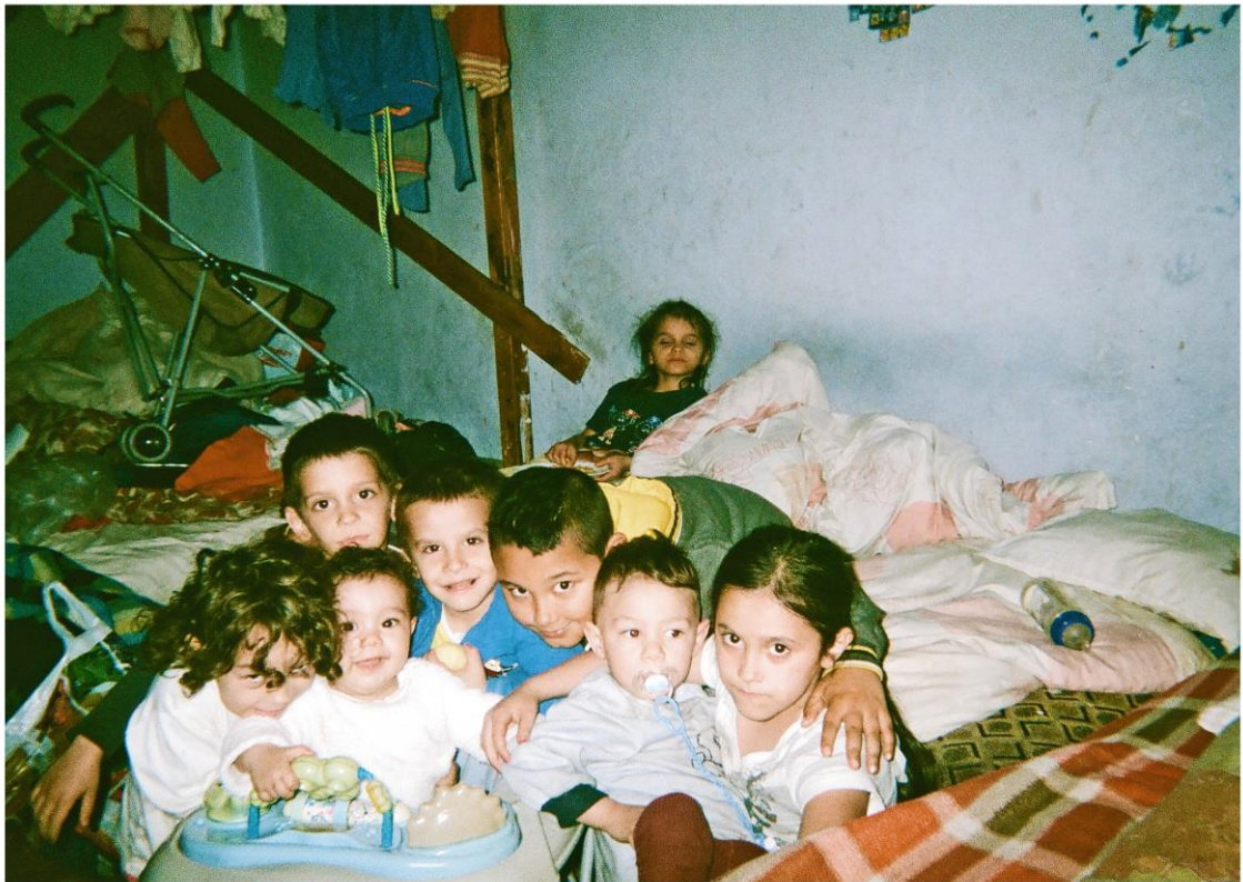
KUVA 7. Lapset poseeraavat kameralle

Naiselta puuttui hampaita, vaatteet olivat suhteellisen siistit mutta vanhat ja päässä oli lippis, hiukset olivat lyhyet, iho likainen. Pojat olivat myös nuhjuisia, vanhoissa vaatteissa ja linttaan astutuissa toppasaappaissa, ja huomasin vuorilla että poikien korvat olivat mustat liasta. (Ote päiväkirjasta.)