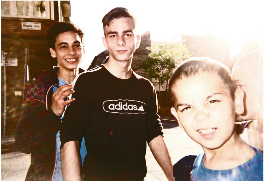
KUVA 10. Iloa Budapestin 8. kaupunginosassa

Usein romanit tappelevat keskenään Budapestissa, koska ovat niin tylsistyneitä elämään ja tekemättömyyteen, että alkavat kinastella keskenään. Myös lapset kasvavat sellaisiksi mitä näkevät ympärillään ja valitettavasti Budapestissa suurin osa romaneista käyttäytyy huonosti. Hän laittaisi 45 % Budapestin ongelmallisista romaneista vankilaan ja toiset 45 % hoitolaitoksiin kuntoutumaan.