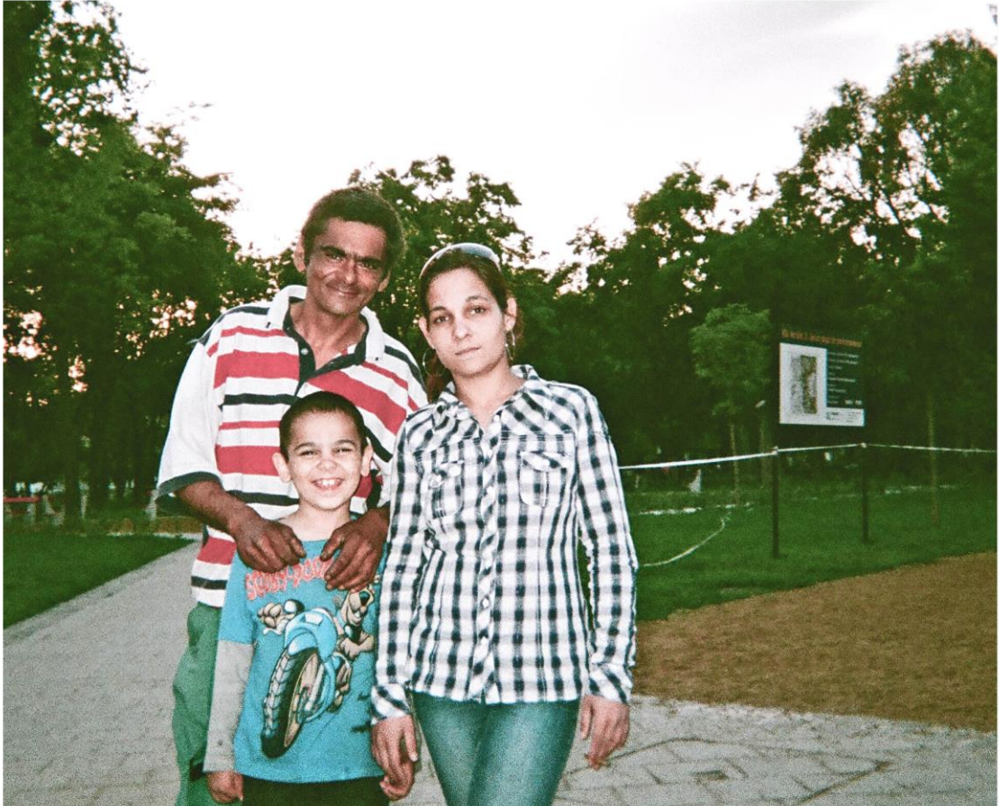
KUVA 9. Vapaa-ajan viettoa puistossa

hän ei nosta eikä halua nostaa, joten rahat ovat vähissä. Hän kertoo, että mustalaisena Unkarissa on vaikeaa, koska ihmiset yleistävät heidän kaikkien olevan pahoja ja rikollisia, mutta se ei ole niin. Tosin hänen mielestään 8. kaupunginosan romaneista noin 90 % on rikollisia, mutta 10 % yrittää tehdä töitä ja rakentaa parempaa elämää.