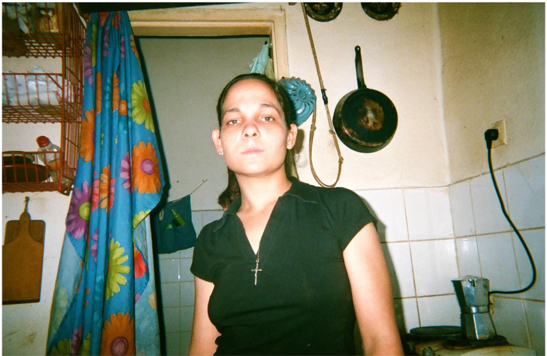
KUVA 8. Romaninainen kotinsa keittiössä puhuttelevin silmin

En halunnut lähteä tänään ollenkaan perhepäivään koska tuntuu liian vaikealta olla lasten kanssa yhteisen kielen puuttuessa, enkä oikein tiedä mitä minulta odotettiin. Onneksi kuitenkin lähdin. Lapset ottivat minut hymyssä suin vastaan, kävivät vuorotellen luonani sanomassa jotain asioita (joista jopa osan ymmärsin) tai kävivät lyömässä läpyt. Yksi ihana pikku poika huomasi minut ja tuli heti pörräämään ympärille ja huusi minun nimeä. Oli hieno tunne pörröttää pojan hiuksia ja huomata miten he ovat tavaltaan jo kiintyneitä minuun tai ainakin iloisia minut nähdessään. (Ote päiväkirjasta.)