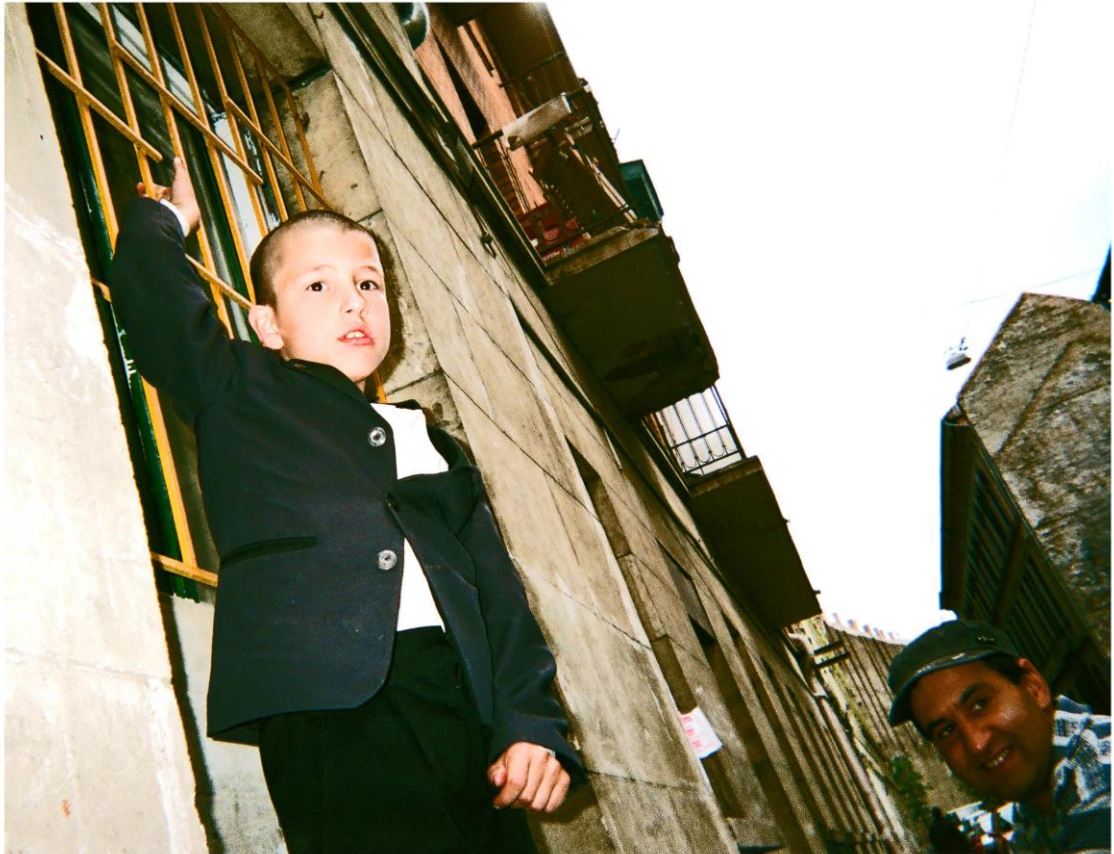
KUVA 4. Poika kirkon ylläpitämän kerhotilan edustalla

taa hieman nähdä kalterien välistä, talot olivat huonokuntoisia, rappaus rapistunut, putket roikkuivat ja ympäristö oli vanhaa ja ränsistynyttä. Tämä kuvastaa hyvin romanien köyhiä ja eristettyjä oloja. Usein suurista perheistä johtuen romaneilla on ahtaat olot, kuten tässäkin perheessä samassa pienessä asunnossa asui monta sukupolvea.