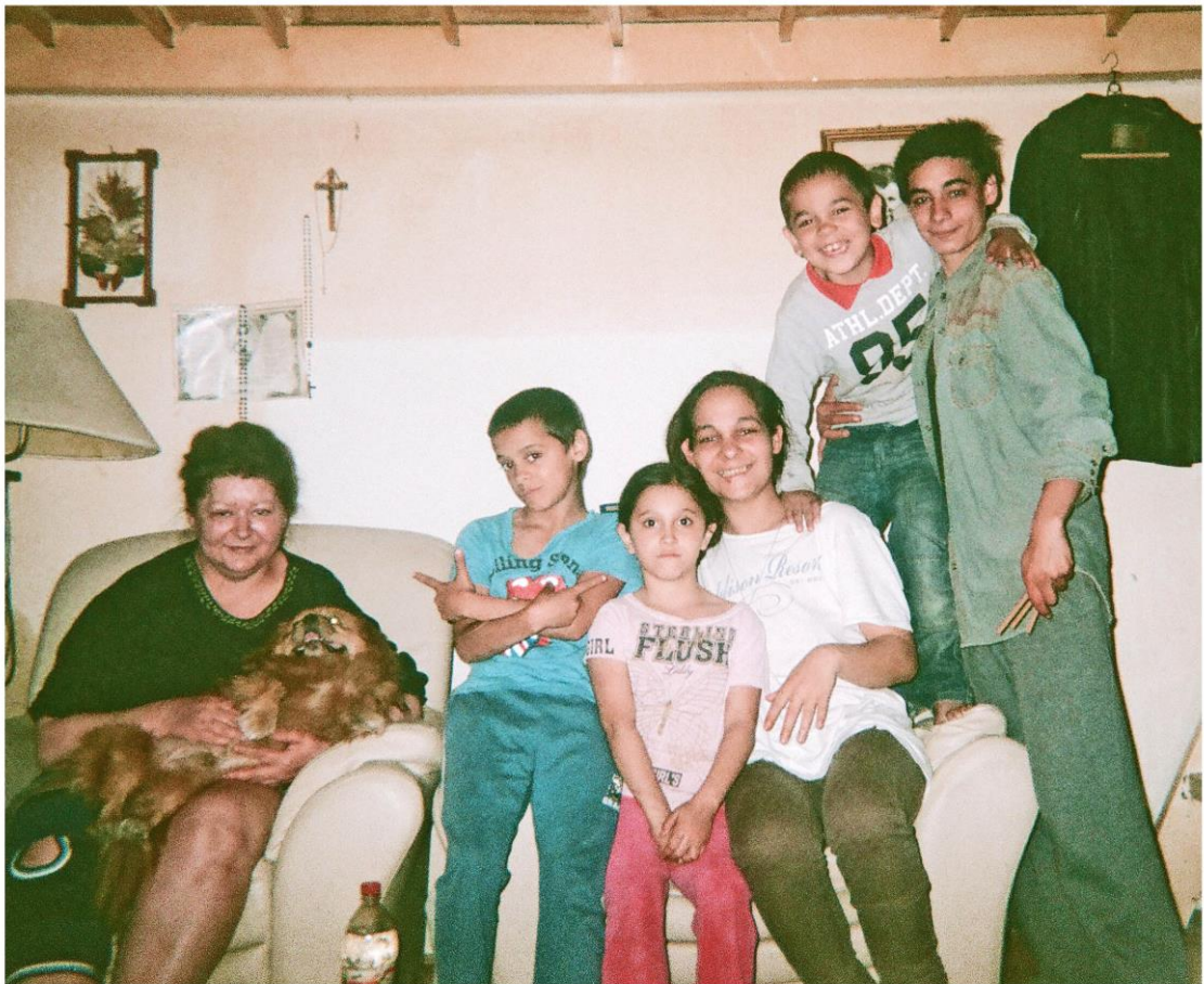
KUVA 6. Romaniperhe asui unkarilaisen naisen (kuvassa vasemmalla) luona

Kuvan lapset pelaavat shakkia, mitä ei ainakaan Suomessa edes kaikki aikuiset osaa pelata. Lapset nauttivat haasteista ja olivat aina valmiita pelaamaan mitä vain, kunhan saivat olla mukana. Kuvan lapsista kaksi on jo aiemmin mainitsemastani vähävaraisesta romaniperheestä ja leimaavaa jokaisen pojan kohdalla oli lyhyeksi leikatut hiukset. Kuulin, että syy tähän oli perhettä häirinneet täit ja lyhyitä hiuksia oli myös helpompaa pitää siistinä.