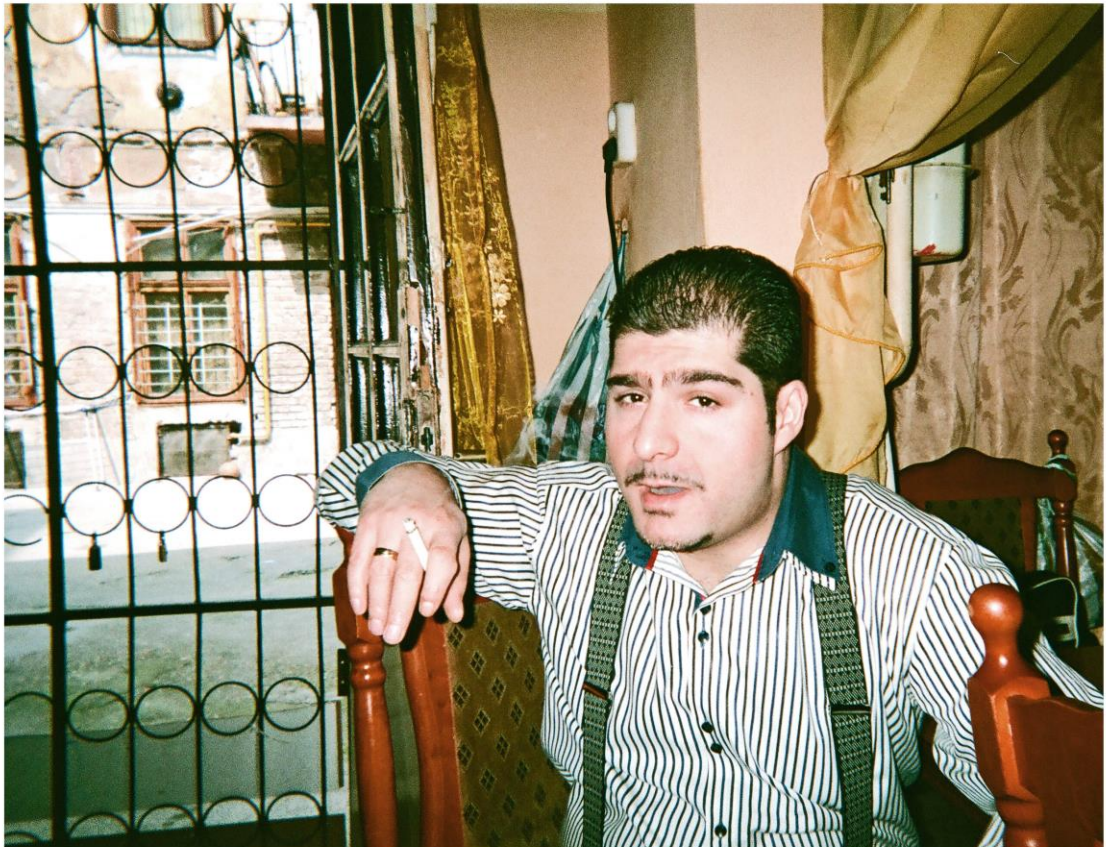
KUVA 3. Mies kotonaan romanien asuttamassa korttelissa Budapestissa

Tutkimuksessa useasta eri lähteestä todetusta huono-osaisuudesta huolimatta kuva miehestäni kertoo siitä, että köyhissäkin oloissa voi iloita arjen pienistä asioista. Mies oletettavasti saa elämään iloa viulun ja musiikin kautta. Minulle tämä kuva kertoo myös siitä elämästä, jota muut eivät näe ulkopuolelta eli positiivisuuden ja normaalin elämän, jota jokainen haluaa ja on oikeutettu elämään.