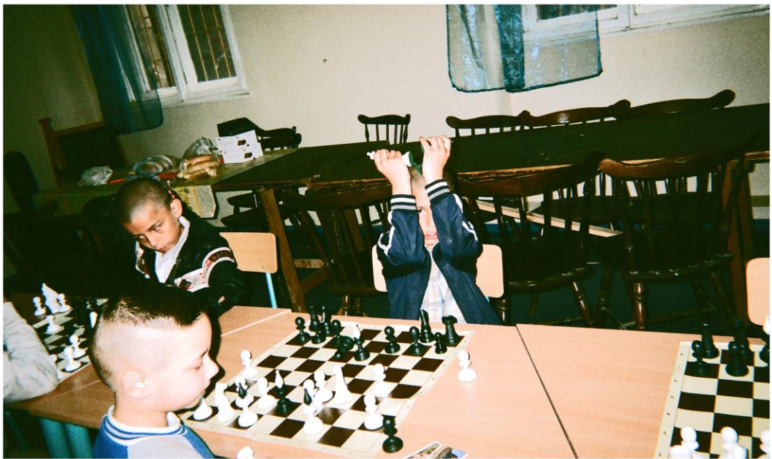
KUVA 5. Pojat pelaamassa shakkia kirkon kerhotilalla

Bussilla matkustaessamme Margitin sillalla (josta näkee Gellertin kukkulan ja parlamenttitalon) lapset olivat aivan innoissaan ”ooh, Budapest”. Aivan kuin he olisivat ensimmäistä kertaa olleet Budapestissa, vaikka he asuvat täällä. Kuten sanottua lapset pääsevät äärettömän harvoin pois 8. alueelta. Innostus ja iloisuus oli käsin kosketeltavaa. (Ote päiväkirjasta.)