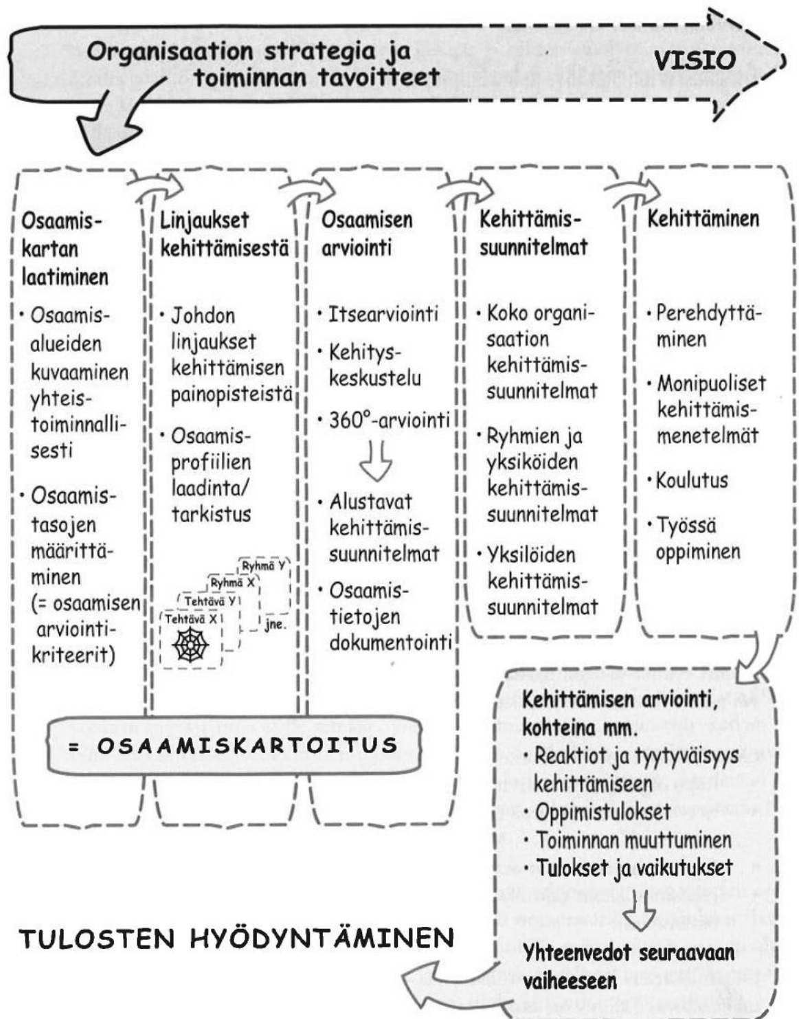
Kuva 1. Osaamiskartoituksen kaava.

Hätönen (2011, 17) kuvaa osaamiskartoituksen prosessin etenevän kuvan 1. kaavion mukaisesti.