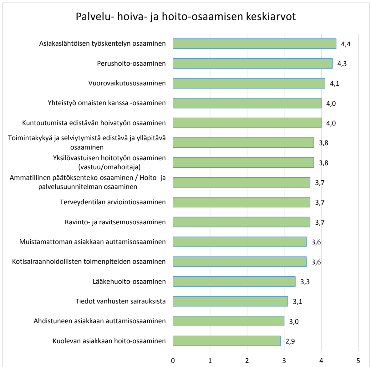
Taulukko 11. Palvelu- hoiva- ja hoito-osaamisen keskiarvot.

Palvelu- hoiva ja hoito-osaamisen korkein keskiarvo on asiakaslähtöisen työskentelyn osaamisessa. Keskiarvon 4 tai sen yli ovat saaneet myös perushoito-osaaminen, vuorovaikutusosaaminen, yhteistyö omaisten kanssa-osaaminen sekä kuntoutumista edistävän hoivatyön osaaminen. Alimman keskiarvon on saanut kuolevan asiakkaan hoito-osaaminen.