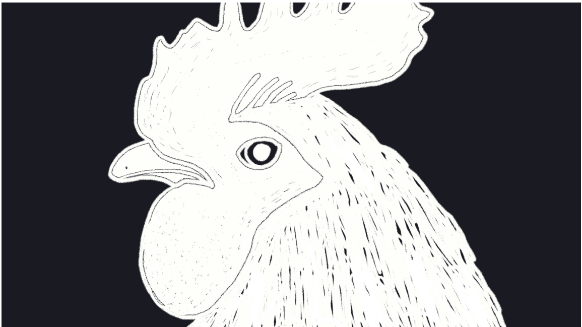
KUVA 1. ANIMAATIONI KUKKO

Monissa kulttuureissa ja uskomuksissa kukkoa pidetään pyhänä eläimenä. Kukko on erityisesti esiintynyt pyhänä eläimenä aurinkoa palvovissa muinaisissa uskonnoissa. Kukko on toiminut näissä uskonnoissa eräänlaisena valon symbolina. Näin voinee ajatella edellä mainitun olevan myös länsimaisissa kulttuureissa; kukon kiekuminen herättää aamulla uuteen päivään. Kristinuskossa