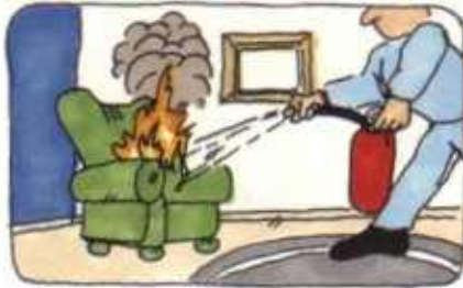
Vedellä tai jauheella