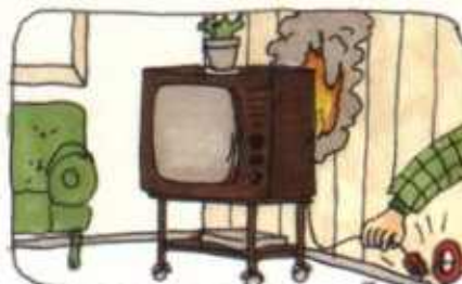
Ensin kosketin irti