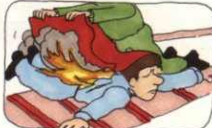
Kasvoista jalkoihin päin