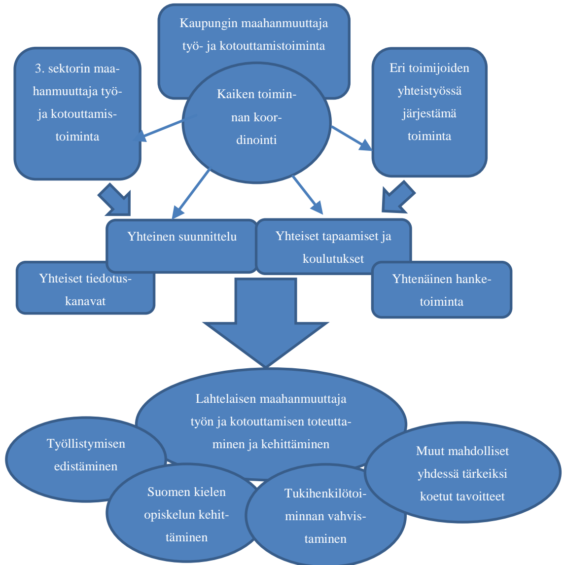
Kuvio 2. Ehdotus yhteistyömallista

Järvenpään esimerkki kannustaa yhteiseen maahanmuuttajatyön ja kotouttamisen suunnitteluun. Yhteistyöhön voisi kuulua myös yhteinen pohdinta sen suhteen, että minkälaisia maahanmuuttajatyöhön liittyviä hankkeita alueelle suunnitellaan. Ilman koordinoitua ja yhteistyötä voi käydä niin, että eri järjestöt suunnittelevat samaan aikaan toiminnoiltaan päällekkäistä hanketta ja rahoitus jää turhaan saamatta. Vastaava esimerkki mainittiin Järvenpään benchmarkingin yhteydessä (Loima 2015). Kuvio 2 kuvaa ehdotustani yhteistyömallista.