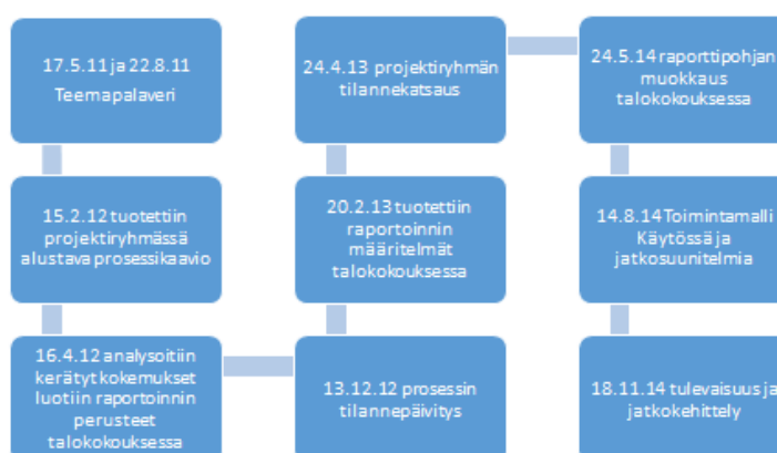
Kuvio 4. Kehittämishankkeen sisällön kuvaus

Projektia varten perustin jo vuonna 2011 erillisen projektityöryhmän, jonka muodostivat minä kehittämishankkeen toteuttajana, varakodin kasvatustyötä tekevän henkilöstön edustaja ja arviointiyksikön vastaava ohjaaja. Tämä kokoonpano on muuttunut vuosien varrella, mutta lähtökohtaisesti työnantajan ja työntekijöiden voimasuhteet ovat pysyneet samoina. Projektiryhmässä olen toiminut koollekutsujana ja asiaesittelijänä ja muiden projektiryhmäläisten rooli on ollut asiantuntijana toimiminen. Vastaava ohjaaja on keskittynyt mahdollisiin taloudellisiin kysymyksiin ja henkilöstön edustaja on tuonut henkilökunnan ajatukset näkyviksi. Projekti on ollut välillä tauolla laitoksen taloudellisten vaikeuksien takia. Projektiryhmä kokoontui 17.5.2011–18.11.2014 välisenä aikana yhdeksän kertaa (Kuvio 4.) ja tällä välillä myös erityistyöntekijät toivat ryhmälle tietoon sen mitä heidän työssä eri vaiheessa käsittelee, jotta päällekkäisyyksiltä vältyttiin. Toimin projektiryhmän vetäjänä ja kirjasin ryhmän mietinnöt.