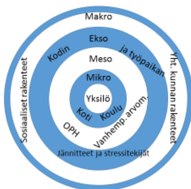
Kuvio 2. Ekologisen sosiaalistumisteorian sisältö (Bronfenbrenner 1979, 21–26)

Bronfenbrennerin mukaan ympäristö on jaettavissa neljään eri osaan, jotka ovat mikro-, meso-, ekso-, ja makrosysteemit. (Kuvio 2.) Mikrosysteemiin kuuluvat esimerkiksi koti ja koulu. Mesosysteemiin kuuluvat muun muassa koulun oppilashuoltoryhmä ja vanhempien arvomallit. Eksosysteemin ei niinkään kuulu yksittäiset ihmiset vaan esimerkiksi kodin sekä työpaikan väliset jännitteet ja stressitekijät. Makrosysteemi on tästäkin laajempi ja rakentuu sosiaalisten rakenteiden sekä toimintojen ympärille. Makrosysteemi antaa kuvaa myös yhteiskunnan rakenteista. (Bronfenbrenner 1979, 6-8; Miller 2002, 438)