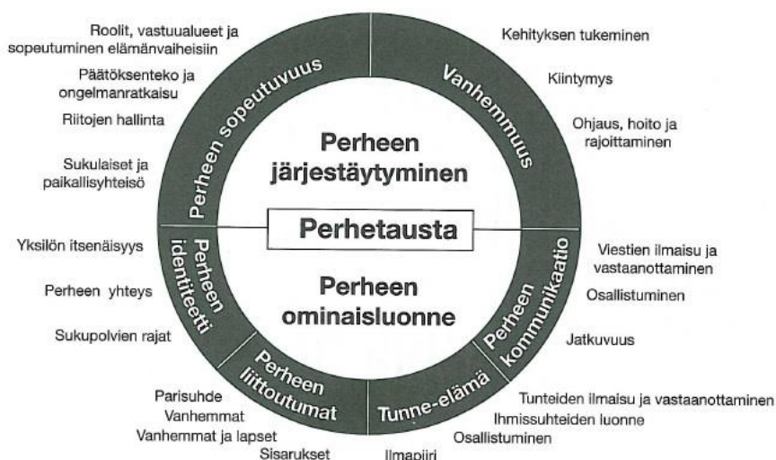
Kuvio 3. Perhearviointimalli (Bentovim & Miller 2001, 46)

Lapsen sosiaalisen viitekehityksen määrittelemisessä on oleellista perehtyä perheen sosiaaliseen integraatioon. Perheen vuorovaikutussuhteet ja suhteet sukuun sekä yhteisöön ovat merkityksellisessä osassa, kun lapsen ekologista kehitystä arvioidaan tai siihen pyritään vaikuttamaan. On tärkeää kartoittaa ajankohtaiset ongelmat ja vaikeudet sekä perheen huolet. Jos perheellä ei ole voimavaroja sisäisesti, on hyvä kartoittaa, onko perheen mahdollista hyödyntää yhteisön voimavaroja. (Bentovim & Miller 2001 11–12)