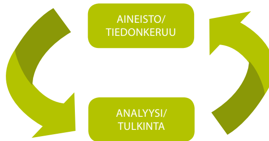
Kuvio 2. Aineiston keruun ja analysoinnin välinen sykli (Kananen 2014).

Havainnointiaineiston luokittelun ja alustavan tulkinnan jälkeen todettiin, että lisää aineistoa kasvattajan haastattelun muodossa olisi tarpeellista kerätä, jotta voitaisiin saada vastaus myös opinnäytetyön alakysymykseen. Tässä opinnäytetyössä toteutui laadulliselle tutkimukselle tyypillinen aineiston keruun ja analysoinnin välinen sykli. Haastattelu oli luonteeltaan havainnointiaineistoa täydentävä, joten haastatteluaineiston käsittelyä luokittelun muodossa ei koettu tarpeelliseksi, vaan vastaus pystyttiin löytämään suoraan haastattelun muistiinpanoista. Haastattelun toteutumisen jälkeen koossa oli aineisto, josta oli mahdollista löytää tarvittavat vastaukset tutkimuskysymyksiin.