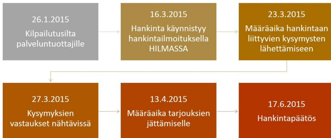
Kuva 3. Tarjouskilpailuprosessin vaiheet

Lisätietokysymyksiä liittyen tarjouskilpailuun oli mahdollista jättää Tarjouspalvelu.fi -toimittajaportalista 23.3.2015 klo 12.00 mennessä. Kaikki kysymykset tuli hoitaa kyseisen kanavan kautta määräaikaan mennessä, tämän jälkeen kysymyksiä ei ollut mahdollista esittää. Vastaukset esitettiin kysymyksiin julkaistiin toimittajaportalissa 27.3.2015 mennessä. Tarjoukset tuli toimittaa viimeistään 13.4.2015 klo 12:00 sähköisesti Tarjouspalvelu.fi -toimittajaportaaliin. Ikäihmisten lautakunta teki päätöksen hyväksytyistä puitesopimuskumppaneista 17.6.2015 pidetyssä kokouksessa.