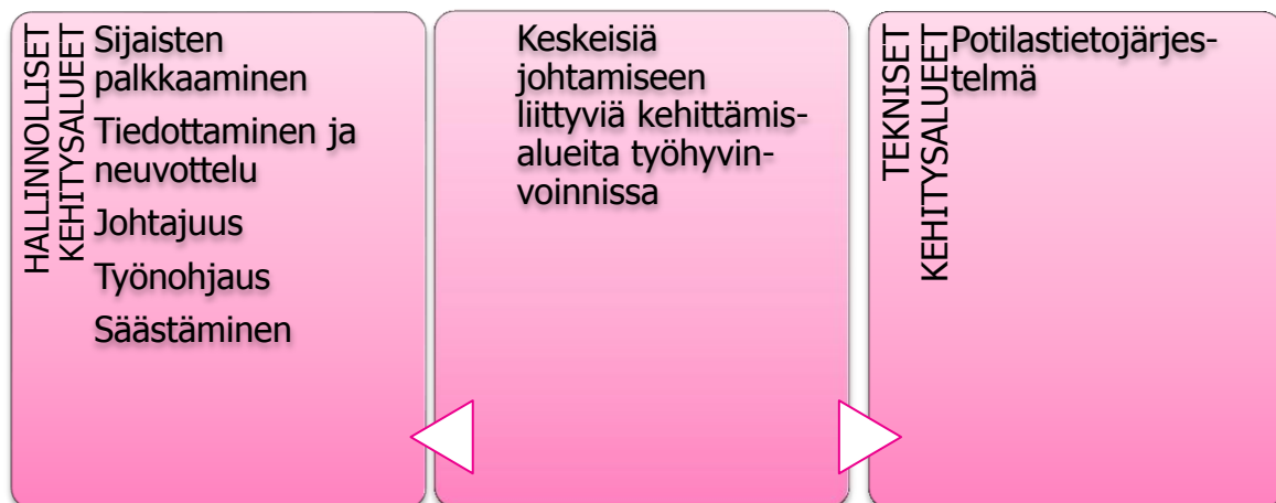
KUVIO 4. Keskeisiä johtamiseen liittyviä kehittämisalueita työhyvinvoinnissa