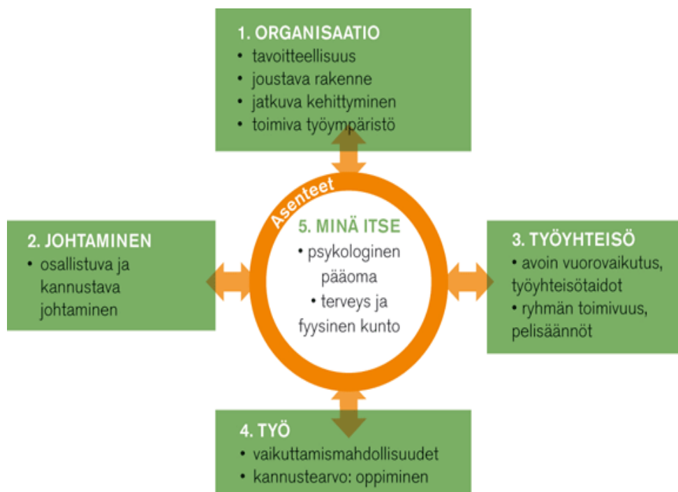
KUVIO 1. Työhyvinvoinnin tekijät (Docendum 2014)

Ihmisen psykologinen pääoma, persoonallisuus, osaaminen sekä terveys ja fyysinen kunto vaikuttavat työhyvinvoinnin kokemiseen. Psykologisen pääoman avulla voi kohdata vaikeita tilanteita sekä ehkäistä niihin liittyviä ahdistuksen ja turvattomuuden tunteita. Psykologinen pääoma kehittyy vielä aikuisena. Aikuisuuteen vaikuttavat joidenkin tutkimusten mukaan perimä ja kasvatus sekä persoona itse. Työntekijöiden hallinnan tunne lisääntyy, kun esimies kiinnittää huomiota työyhteisön toimivuuteen ja avoimuuteen sekä työn epätietoisuuden vähentämiseen. Työntekijöiden toiveiden, kykyjen ja tavoitteiden huomioonottaminen töitä suunniteltaessa on tärkeää, sillä onnistumisen kokemukset kasvattavat elämänhallintaa. (Kaikkonen ym. 2007, 8; Manka 2011, 73.)