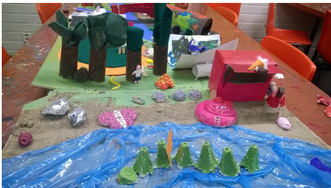
Kuva 3: Lohikäärme ja muut kylän asukit.

Vanhemmat yrittivät ohjata piirtäviä poikiaan takaisin askartelujen pariin muistuttamalla heitä siitä, että oli viimeinen mahdollisuus kylän työstämiseen. Poikia sai houkuttaa askartelun pariin tovin, ennen kuin he innostuivat taas kylän rakentamisesta. Kaikille heille keksittiin kuitenkin tekemistä, kuten hahmojen viimeistely ja niiden asettelu kylään. Keksi eräs lapsi tehdä kylän järveen vielä lohikäärmeenkin viimeisellä kerralla. Idea oli kerrassaan nerokas ja lohikäärmeestä tuli todella upea. Koko kylästä tuli aivan mielettömän hieno ja siitä voimme kiittää luovia ja innokkaita kerhomme osallistujia.