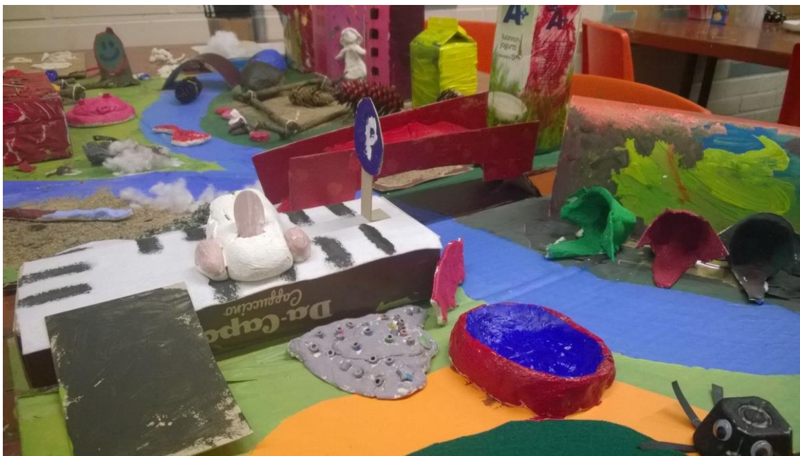
Kuva 4: Kylän parkkipaikka ja sen ympäristö kuvattuna.