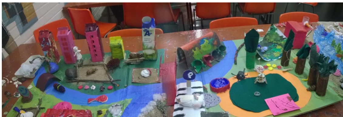
Kuva 5: Valmis kylä.

vät tämän kyselylomakkeen sijasta loppukartoituskyselyyn, joka oli hieman kyselylomaketta laajempi.