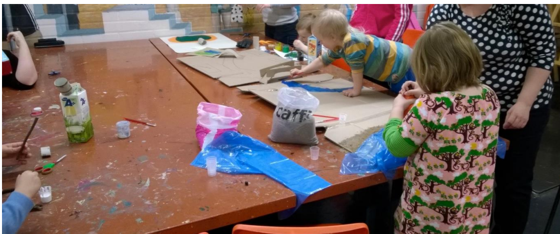
Kuva 1: Kylän pohjan teko täydessä vauhdissa.

Huomasimme, että uudet perheet olivat keskenään kavereita jo ennestään. Eivät kaikki neljä uutta perhettä, vaan pareittain. Äidit olivat ilmeisesti halunneet niin lapsilleen kuin itselleenkin tuttuja ihmisiä mukaan kerhoon. Tuttuus oli toisaalta hyvä, toisaalta haastava ominaisuus. Kaksi kaverusta villitsivät toisiaan ja olivat hyvin vilkkaita, keskittyen huomattavasti enemmän yhdessä leikkimiseen ja pelleilyyn, kuin itse askarteluun. Toinen toisilleen tuttu parivaljakko oli rauhallisempi ja he keskittyivät omien askartelujensa etenemiseen, välillä jutellen joko omalle tai kaverin äidille tai kaverilleen.