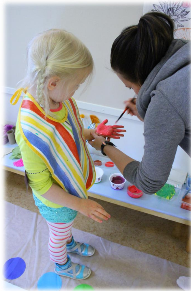
Kuva 8: Lapsen idea toteen, ohjaajan avustuksella