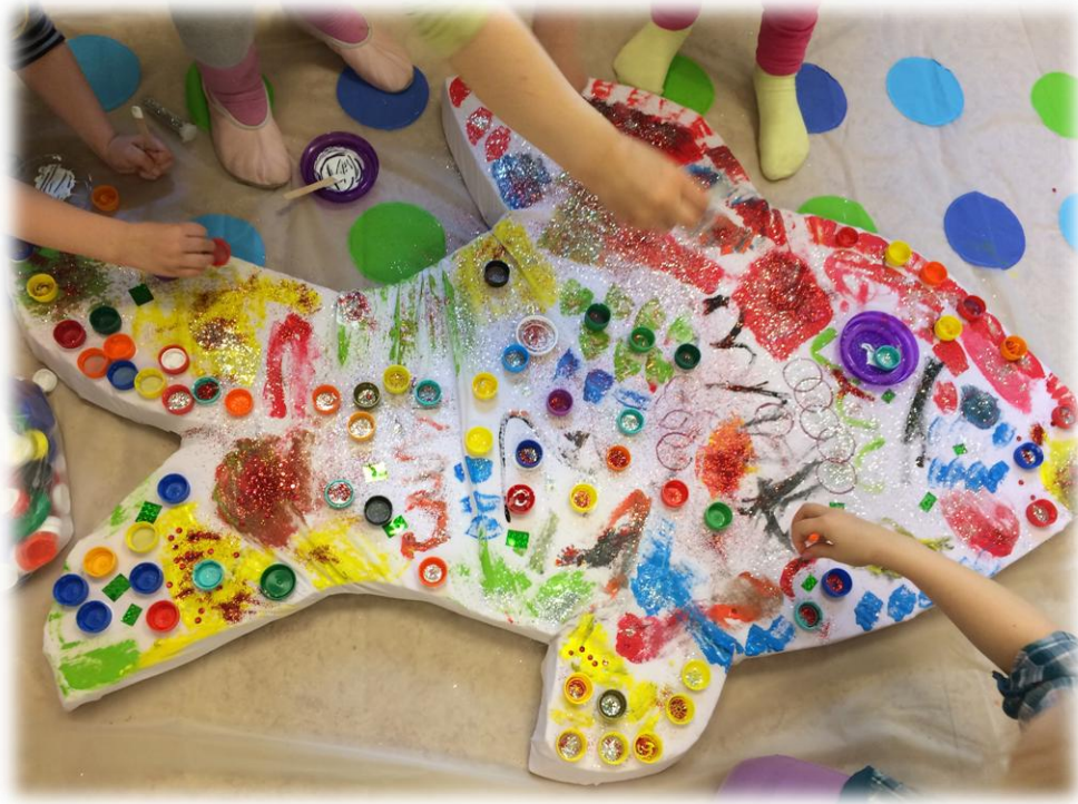
Kuva 6: Kesäretki taideinstallaation työstöä