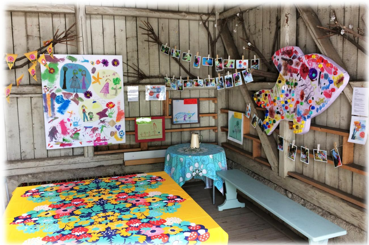
Kuva 11: Taidenäyttely

Pispalan päiväkodin ympäristössä on hyvin monipuolisesti otettu huomioon värien käyttö. Rakennus, jossa taidenäyttely järjestettiin, oli somistettu lapsilähtöiseksi kokonaisuudeksi kevätjuhlaan. Isot taideinstallaatiot koristivat kevätjuhlatilaa ja loivat värikkään tunnelman ympäristöön. Töiden viereen oli koottu lasten ajatuksia työskentelystä ja heidän sanoituksiaan töiden sisällöstä.