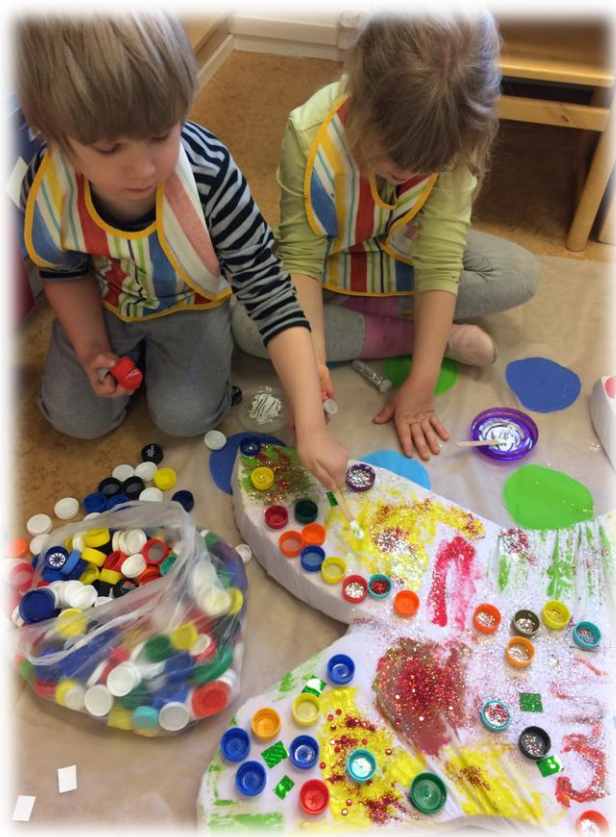
Kuva 10: Hauki-taikakalan työstöä

Tässä vaiheessa lapsille annettiin käyttöön vahaliidut ja tussit. Lapset aloittivat työskentelyn lattialla isoa tapettipaperia kuvittaen. Työskentely alkoi hiljaisuudessa, mutta hetken kuluttua alkoi puheensorina ja lapset sanoittivat kuviaan. Lattialla työskennellessä mahdollistuu koko kehon hyödyntäminen. Isolle tapettipaperille lapsen on miellyttävä piirtää, ettei tarvitse varoa paperin ylittämistä.