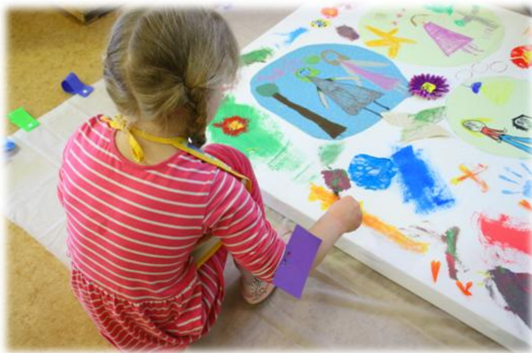
Kuva 2: Hyvä ystävä taideistallaation työstöä