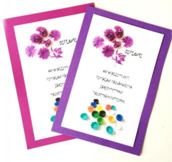
Kuva 13: Diplomi

Opinnäytetyön mukana tulevat liitteet auttavat hahmottamaan käytännön toteutusta ja toimivat työvälineenä kasvattajalle. Opinnäytetyössä havainnollistetaan konkreettisesti työskentelymateriaalit ja työskentelyn toteutusvaiheet. Taideilmaisu virittää ja mahdollistaa lapsen tunneilmaisun sekä tukee lapsen identiteetin kehittymistä.