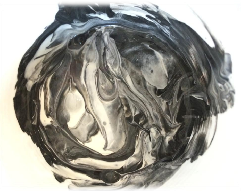
Kuva 4: Peitevärit