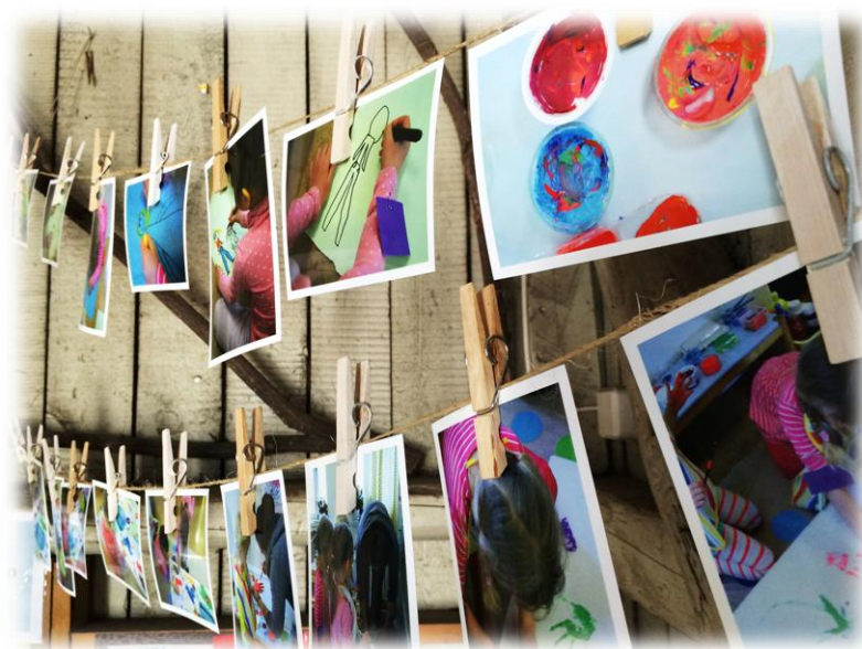
Kuva 7: Dokumentointi

Kuvataideilmaisullisen toimintamallin ideassa näkyy viitteitä Reggio Emilia pedagogiikasta. Dokumentoinnin tärkeys tulee esiin käytännön toteutuksessa taidenäyttelyn keinoin (kuva 7). Lisäksi kuvataideilmaisullisessa toimintamallissa korostuu lapsen omaehtoinen tekeminen, dialogi ja ympäristön virikkeellisyys.