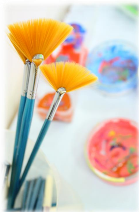
Kuva 1: Materiaalit

Tässä opinnäytetyössä tuotoksena on valokuvin tehostettu toimintamalli. Toimintamallin avulla lasten kanssa työskentelevä kasvattaja saa avukseen valmiin mallin hektiseen varhaiskasvatusympäristöön. Tämä toimintamalli avaa yhden tavan toimia hiljaisten ja ujojen lasten parissa, huomioiden heidän tarpeitaan ja ilmaisuaan. Kuvallinen menetelmä tukee heidän kehittymistään tunne- ja itseilmaisun alueilla.