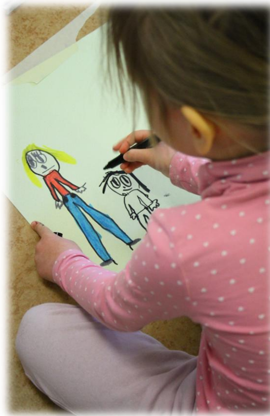
Kuva 5: Hyvä ystävä kuvan työstöä

”Lapsen kuvia ei tule sanoittaa, vaan hän itse toimii työnsä tulkitsijana.” – Päivi Maria-Hautala