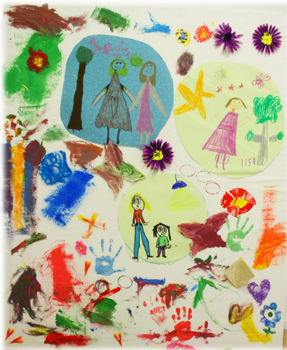
Kuva 9: Hyvä ystävä taideinstallaatio