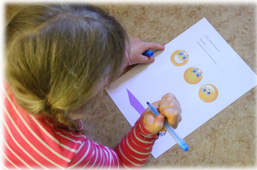
Kuva 12: Palautelomakkeen täyttämistä

Lapsilta kerätty palaute taidetyöskentelystä tapahtui lomakkeella, jossa ilmentyi eri tunnetilat iloinen, neutraali ja surullinen kasvokuvien avulla. (liite 1) Ennen lomakkeiden täyttämistä lapsille kerrottiin lomakkeen tarkoitus ja selitettiin kasvokuvia vastaavat tunnetilat. Lapset rastittivat omaa tunnettaan vastaavat kasvot. Surullinen kasvokuva tarkoitti, että kuvataidetyöskentely oli epämiellyttävää tai tylsää. Neutraalin kasvokuvan tarkoitti, että työskentely oli ollut hauskaa että tylsää tai että ei osannut valita. Iloinen kasvokuva ilmaisi kuvataidetyöskentelyn olevan mieluisaa ja mukavaa.