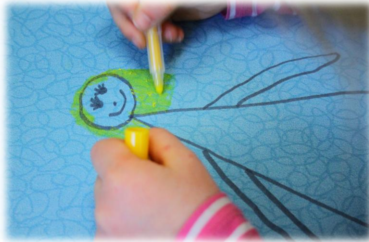
Kuva 3: Hyvä ystävä