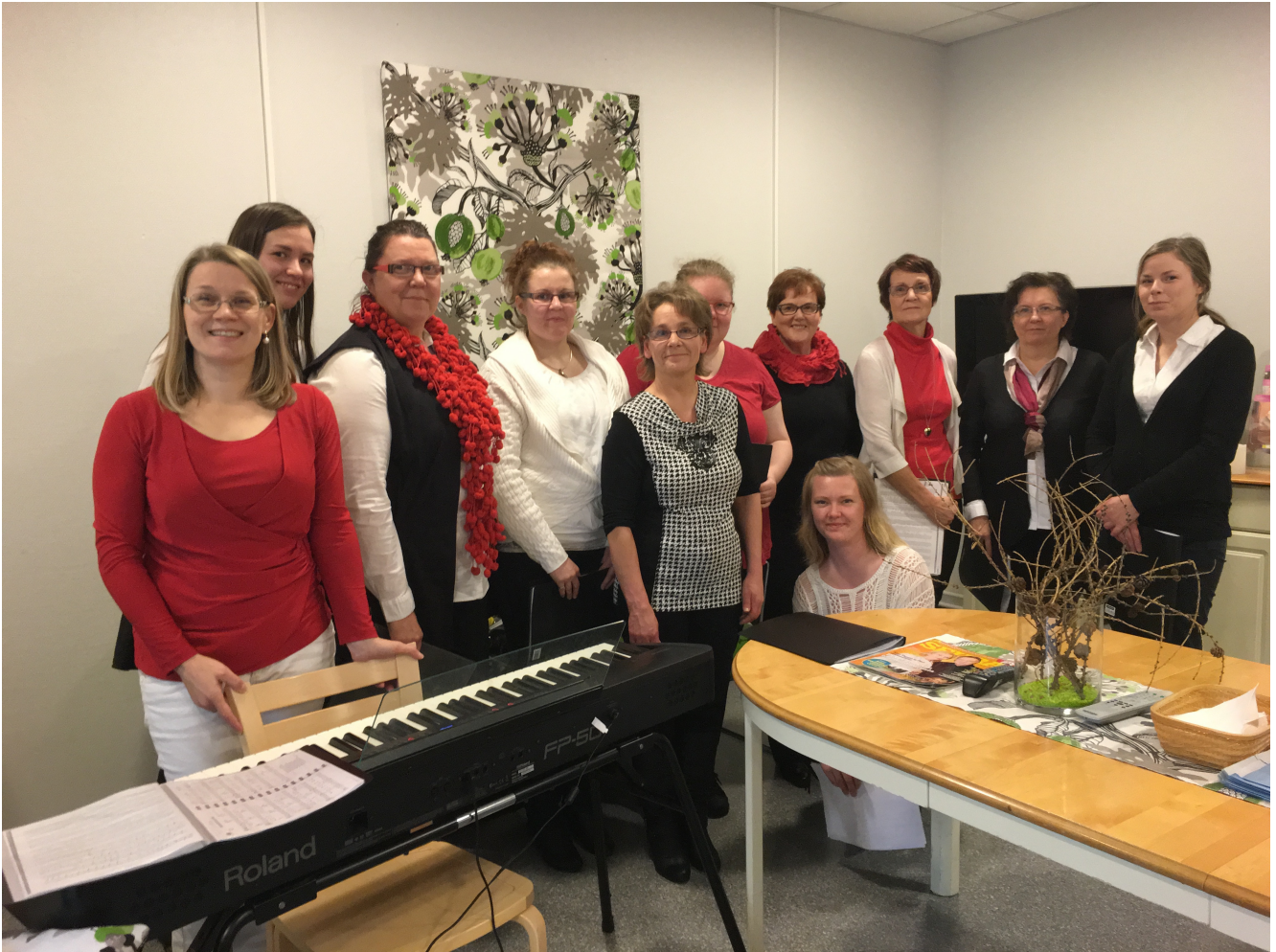
KUVA 1. Kipinän ensiesiintyminen terveyskeskuksessa

Kevätkausi starttasi tammikuussa ja aloitin uuden ohjelmiston suunnittelun. Eteeni tuli Juha Tapion kirjoittama kappale Väsyneet maan . Siitä laulusta heräsi minulle idea musiikki-illasta, joka olisi hoi-tava ja voimaa antava tilaisuus. Uskoin monen ihmisen kaipaavan tällaista iltaa ja itselläni kun on ollut myös kokemusta kamppailusta väsymyksen kanssa. Illassa esiintyisi gospellauluryhmämme Kipinä ja paikka olisi seurakuntakoti Maria.