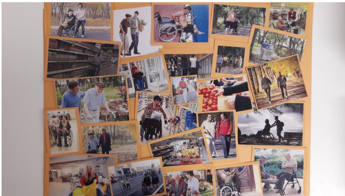
Kuva 4. Auttamistilanteet