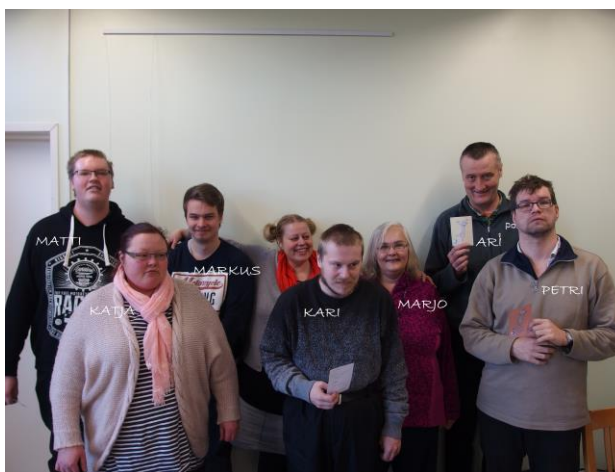
Kuva 5. Toiminnallinen tuokio, osallistujat

MAHTI – tunnekortit on kehitelty Kehitysvammaisten tukiliiton MAHTI – projektin materiaalina. Korteissa on 50 eri tunnetilaa ilmaistu ilmeikkään susihahmon muodossa. (kvtil.fi 2017)