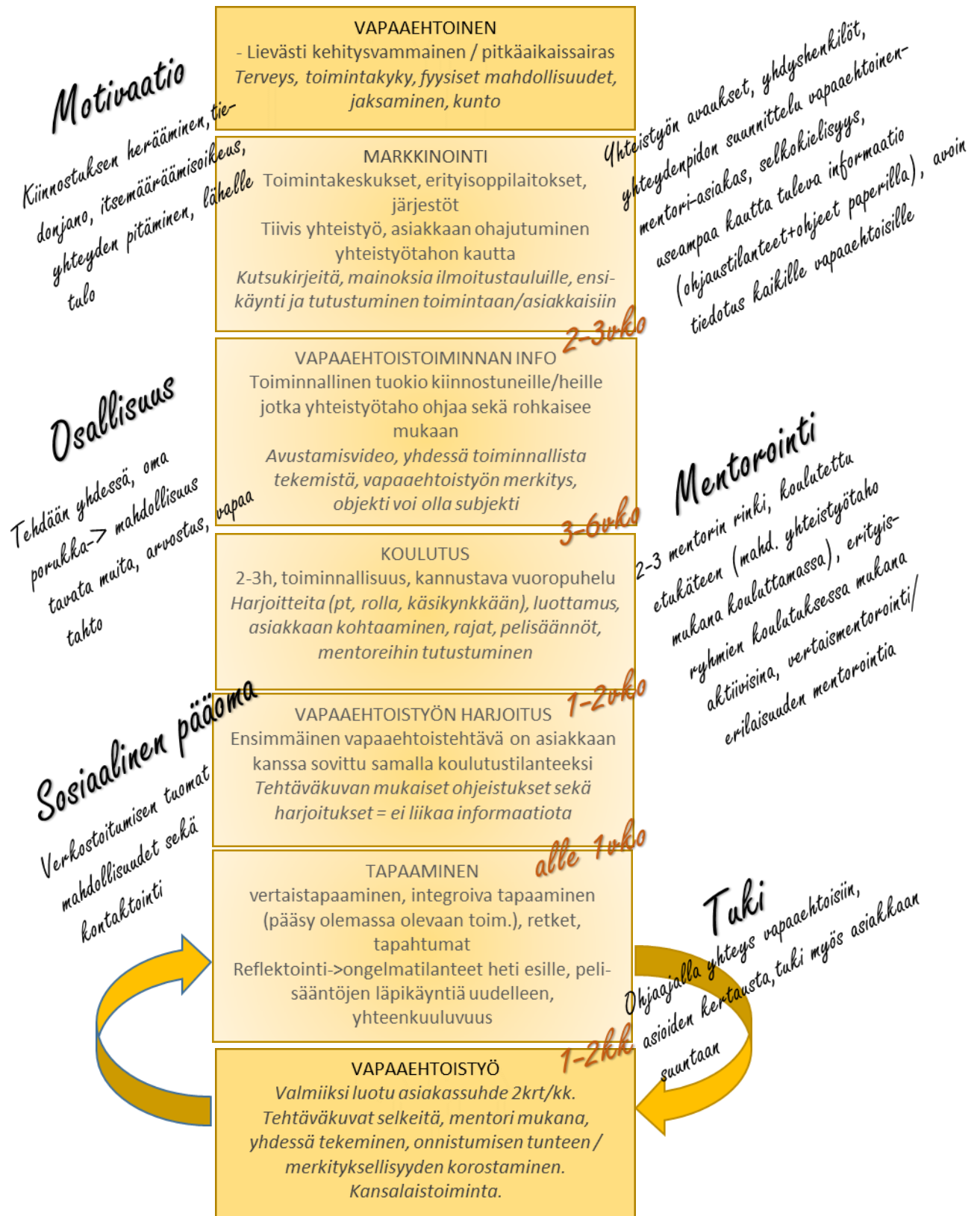
Kuvio 2. Tuetun vapaaehtoistyön malli lievästi kehitysvammaisille sekä muille sovellettavissa oleville ryhmille