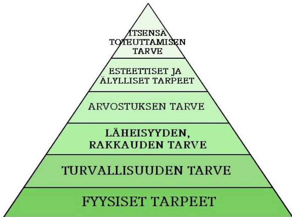
Kuvio 3 Maslow'n tarvehierarkia

( https://studyhings.wordpress.com/2012/09/13/maslowin-tarvehierarkia/ )