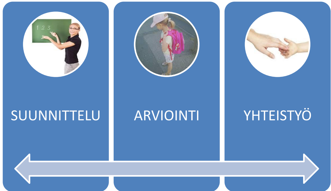
Kuvio 6 Keskeisimmät vuorohoidon esiopetuksen onnistumisen elementit

vuudella on havaittu olevan erityisesti lasten vanhempien mieltä helpottava vaikutus, kun arki-aamun esiopetukseen osallistumista ei ole pidetty ehdottomana. Mielestäni tässä on kuitenkin samalla olemassa pieni riski siitä, että jotkut vanhemmat saattavat ottaa lapsen esiopetusvuoden liiankin kevyesti, eivätkä huomioi esiopetuksen merkitystä ja velvoittavuutta lainkaan. Tästä syystä on hyvä miettiä todella tarkasti, miten niin sanotusta joustavasta esiopetukseen osallistumisesta vanhempien kanssa keskustellaan ja miten keskustelusta kirjataan.