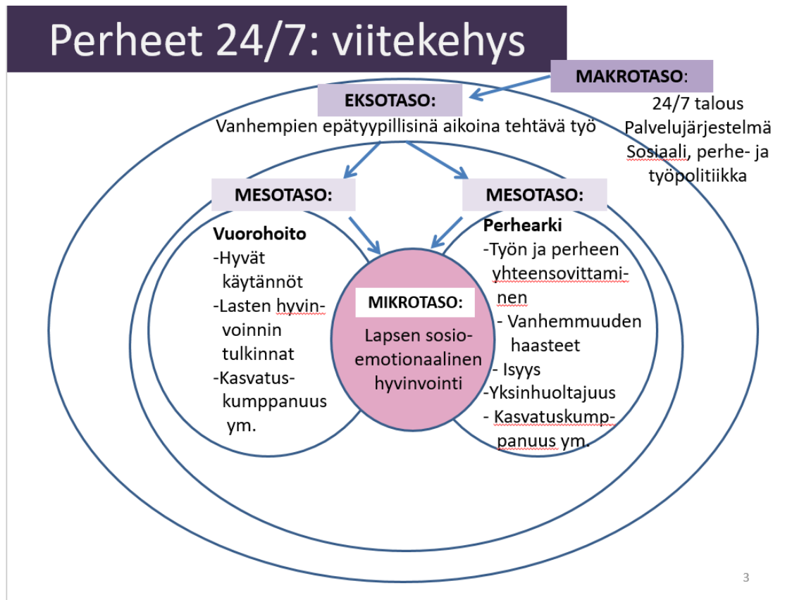
Kuvio 2 Vuorohoidossa olevan lapsen hyvinvointiin vaikuttavat tekijät eri tasoilla https://www.jamk.fi/fi/Tutkimus-ja-kehitys/projektit/Perheet-24/Etusivu/

Seuraava kuvio ilmentää sitä, kuinka vuorohoito vaikuttaa eri tasojen kautta lapsen sosio-emotionaaliseen hyvinvointiin.