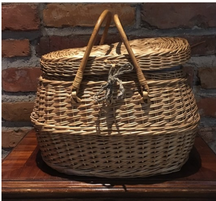
Kuva 1. Käsityövakka.

Yleiset ohjeet ovat perusosa pakettia, jossa esitellään Käsityövakan sisältö ja annetaan vinkkejä siihen, kuinka sitä voidaan käyttää. Yleiset ohjeet ja käsityöohjeet on jaettu myös sähköisessä muodossa Ylöjärven kaupungin sisäisessä Virta-palvelussa varhaiskasvattajien käyttöön. Näin tehtäviin ja sisältöön on mahdollista tutustua etukäteen sekä hankkia tarvittavia käsityömateriaaleja. Yleisiin ohjeisiin on myös luetteloitu Käsityövakkaan sisältyvä materiaali, jonka mukaan voidaan tarkistaa oman lainauskerran jälkeen, että kaikki tarvittava on paikoillaan eikä mitään puutu. (Kuva 1.)