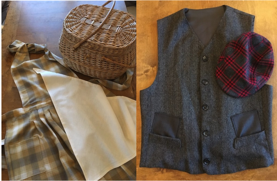
Kuva 2. Rekvisiittivaatteet.

Vaatteiden avulla pystyy kertomaan tarinaa ja niihin löytyy Käsiyövakasta oma pieni infoteksti.