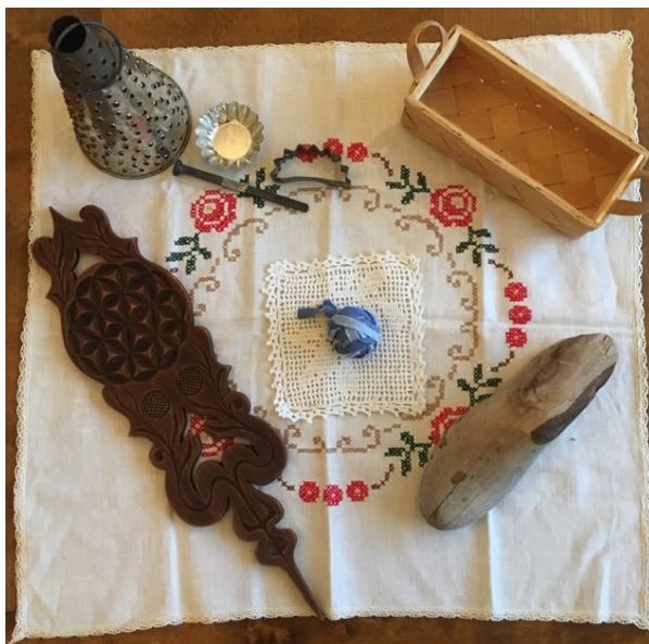
Kuva 3. Esineistöä.

Tämän lisäksi punottuun koriin on laitettu mukaan erilaisia esineitä liittyen käsityöläisammatteihin tai perinnekäsitöihin. Näitä esineitä ovat mm. kenkälesti, suurempi kirjottu liina, pläkkipeltilyhty, kehruulapa ja pieni päretuokkonen (Kuva 3). Näitä esineisiin sisältyy infotekstit ja niitä voidaan käyttää perehdytysmateriaalina toiminnallisessa osuudessa. Lapsilla on mahdollisuus koskea kaikkiin esineisiin, jolloin eri aistit saadaan käyttöön.