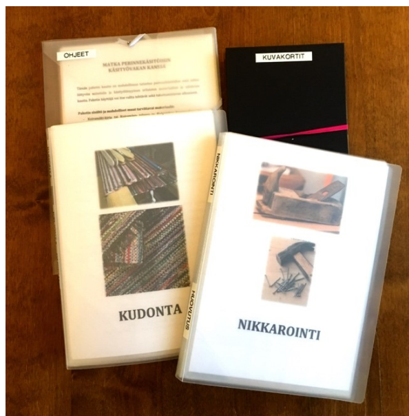
Kuva 4. Käsityöohjeet, kuvakortit ja yleisohjeet

Käsityövakan sisältöön kuuluvat kuvakortit infoteksteineen. Ne käsittelevät käsityöläisyyttä ja naisten töitä sekä esineitä, jotka liittyvät Käsityövakassa oleviin perinnekäsityöaihealueisiin kuten huovutus, kudonta, ompelu-kirjonta, nikkarointi ja metallityöt. Kuvakorttien avulla voidaan tutustua aihealueisiin, aloittaa keskusteluja, kuvailla esineitä, ryhmitellä aistien mukaan tai materiaalien sekä naisten ja miesten töihin, eri käsityöläisten työkaluiksi jne. Niitä voidaan myös ryhmitellä erilaisten aistinvaraisten mielikuvien mukaan tai eri käsityöläisille kuuluviksi, naisten ja miesten työkaluiksi. Vain mielikuvitus on rajana, miten kortteja voi käyttää. (Kuva 4.)