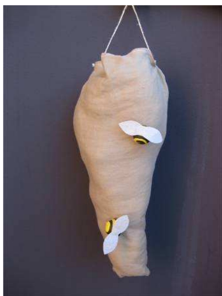
Kuva 2. Ampiaispesä

sijoitetulle ampiaispesärastille ja kiinnitin lasten ja isien huomion isoon ampiaispesään. Pesä oli kiinnitetty puolapuihin, joiden edessä oli tekopuu. Koska Cd soitin oli aivan ampiaispesän vieressä, äänet tuntuivat todella tulevan pesästä. Sanoin ”On hunaja niin makeaa, kaikkein parasta välipalaa ja yhdessä me maistellaan, kun mehiläisiltä hunajaa saadaan.” Lapset saivat tulla yksitellen kokeilemaan, miltä mehiläispesän sisältö tuntuu. Pesä oli tarkoituksella ripustettu niin korkealle, että lapset eivät ylettyneet siihen ilman isien nostoapua. Melkein kaikki lapset uskalsivat työntää kätensä pesään ja löysivät paperipäällysteisen makeisen. Myös niille, jotka eivät kokeilleet ampiaispesän sisältöä, annoin samanlaisen makeisen.