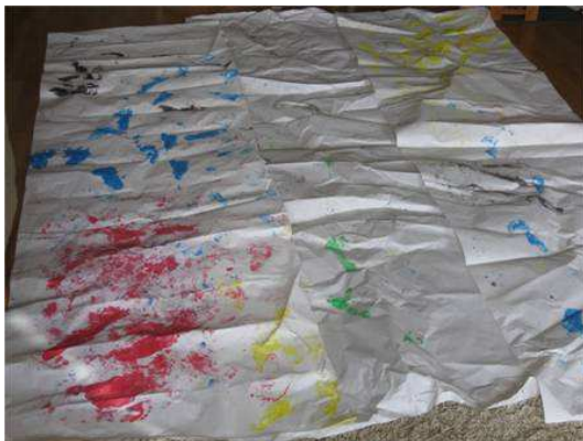
Kuva 3 Jalkamaalauksen satoa

Seikkailun päätökseksi pyysin vielä kaikkia istumaan sohville ja kuuntelemaan. Luin tekstin ” Oma isä onkin aina isäkarhu kaikkein paras. Isän kanssa ollaan kaksin, on isä niin iso ja rakas” (Ritchie 2007). Pyysin isiä antamaan pikkukarhuille ison halauksen ja kiittämään mukavasta seikkailusta. Kaikki isät halusivat lapsiaan.