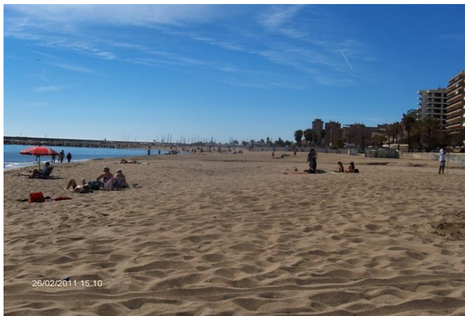
Kuva 1. Aurinkorannikko

vain se rakkaus on tässä maailmassa täydellisen puhdasta ja pyyteetöntä. Rakkaus on itsensä uhraavaa rakkautta, toisen rinnalle asettumista, läsnäoloa ja kuuntelemista, välittämistä, ilon ja surun jakamista toisen ihmisen kanssa.