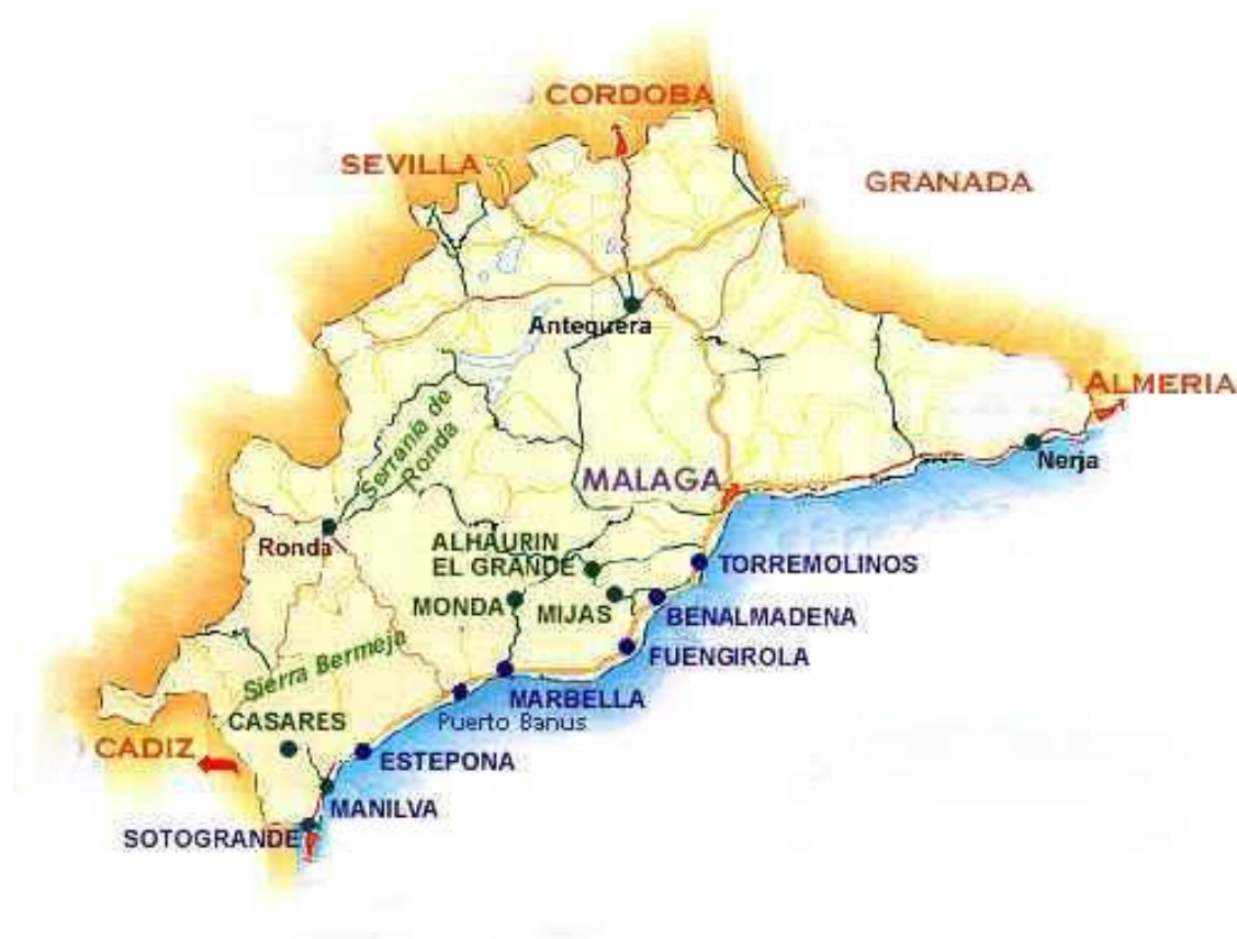
Kuva 2 Espanjan Aurinkoranniko (www.finnchalet.net)

Väyrynen (2007, 30–35) kirjoittaa, että ” 2000-luvun maastamuuttaja on tyypillisesti joko ulkomaille avioituja tai tavoitteistaan tietoinen määräaikaismuuttaja, jolle ulkomailla asuminen on vain yksi elämään kuuluva vaihe. Yhä enemmän on myös kausisiirtolaisia, jotka asuvat vain osan vuotta.” Opiskelu on lisääntynyt ulkomaan harjoittelujen myötä. Uusien elämäkokemusten hankitaan hyvinvoinnin lisääntyessä. Ihmissuhteet ovat myös eräs muuton syy. Yhteisöjä voidaan tarkastella erilaisista lähtökohdista. Aurinkorannikon alueella asumisella ja suomalaisella taustalla suuri osa eläkeläisistä puhaltaa yhteen hiileen ja toimivat yhdessä. Monimuotoisuus näkyi myös tutkimuksessa. Suomalainen yhteisö käyttää paikallista radiokanavaa. Joka torstai kävi pappi puhumassa sanan viikonvaihteeksi ja samalla hän ilmoitti kaikki viikonlopun menovinkit. Suomalaiset käyvät myös tutuissa suomalaisravintoloissa ja – kahviloissa. 2010 syksyllä tuntui, että seurakuntakodin ympärillä oli suomenkielisiä kahviloita ja baareja joka kadun kulmassa. Niissä leivottiin karjalanpiirakoita ja tuoretta suomalaista pulaa. Kausisiirtolaisuus luo epävarmuutta yhteisötoimintaan. Keväällä eläkeläis-