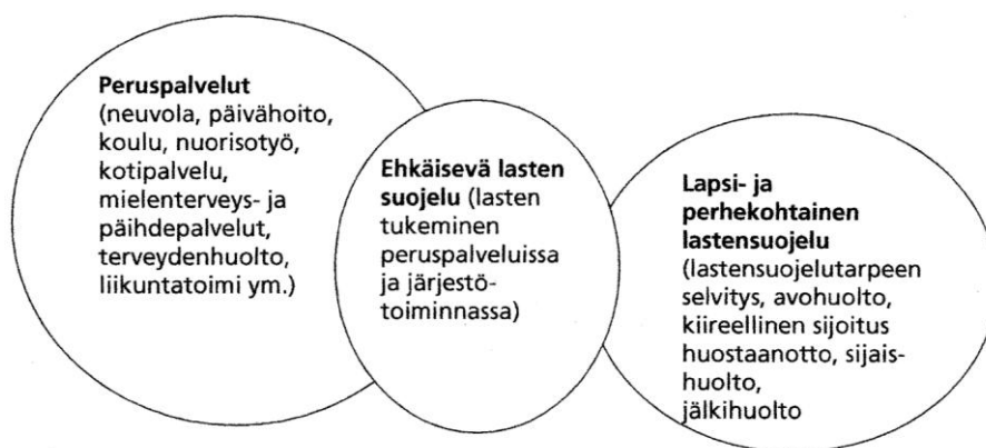
Kuva 1. Lasten suojelun kokonaisuus (Taskinen 2007, 13)

(riittävät ja jatkuvat aikuiskontaktit, lapsen huomioon ottavat toimintatavat, turvallinen, terveellinen ja virikkeitä antava kasvuympäristö)