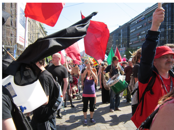
Kuvat 2-4. Mielenosoituksia Helsingin keskustassa 23.5.2014