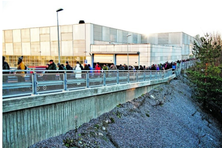
Kuva 1. Leipäjono Myllypurossa syksyllä 2012 (Päivinen, Kirkko & Kaupunki 2012)

ihmisten määrä on merkittävästi lisääntynyt, ja heidän tuen tarpeensa on pitkittynyt. Ei ole yllättävää, että samanaikaisesti näiden muutosten kanssa on syntynyt myös suuri joukko ruoka-apua tarvitsevia ihmisiä.