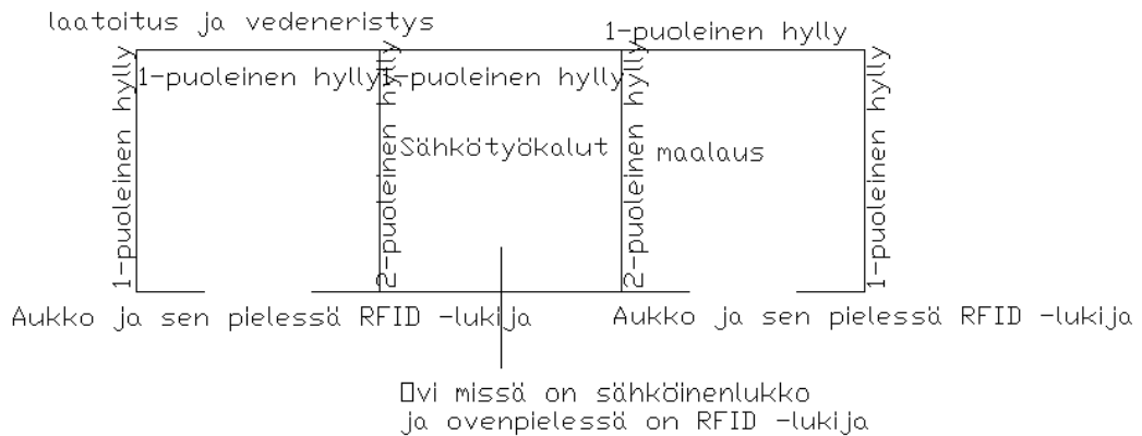
Kuva 3. Periaatekuva, miten järjestetään uusilla hyllyillä ja RFID -laitteilla.