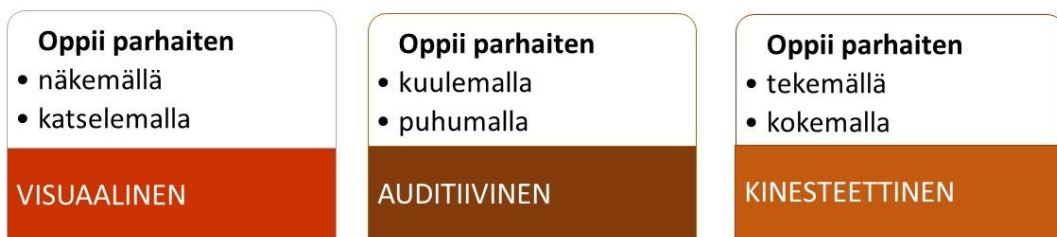
Kuva 3 Aisteihin perustuva oppimiskanavamäärittely. (Ammattiopisto Luovi 2014, 4).

Kinesteettinen oppija käsittelee maailmaa kehonliikkeiden avulla eikä jaksakaan olla paikallaan. Hän oppii tekemällä ja kokemalla, sekä kaipaa toimintaa ja liikettä koko keholle. Kinesteettinen oppija ei lue mielellään, mutta muistaa mitä on tehnyt. Hän ei pidä katsekontaktista ja suuntaa katseensa liikkuvaan kohteeseen. Lisäksi hän tarvitsee aikaa ja hän harrastaa myös liikuntaa tai muuta toiminnallista. (Ammattiopisto Luovi 2014, 8).