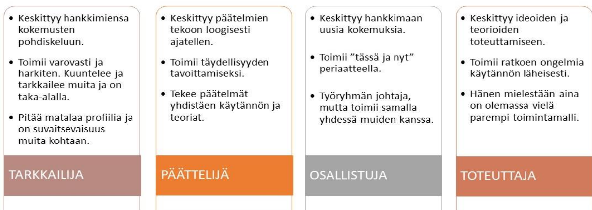
Kuva 6 Kolbin neljä pääryhmää oppimistyyleistä.

Toteuttaja keskittyy ideoiden ja teorioiden toteuttamiseen. Toteuttaja haluaa kokeilla uusia ideoita ja teorioita, että hän tietää toimivatko ne käytännössä. Hän ryhtyy herkästi tuumasta toimeen ja on kärsimätön jos asioita märehditään. Hän on käytännöllinen ongelmien ratkoja ja hänen mielestä aina on olemassa jokin uusi ja parempi tapa asioiden ratkaisemiseksi. (Rantanen 2010, 23).