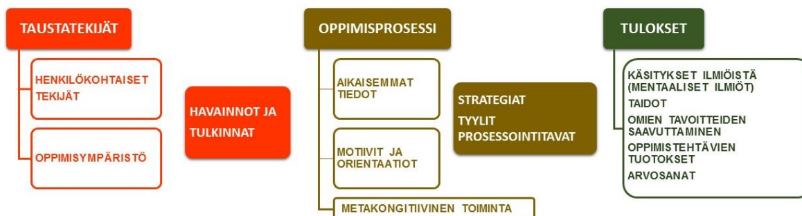
Kuva 1. Oppimisen kokonaismallin osatekijät. (Tynjälä 2000, 17).

Aina 1950- ja 1960- lukujen vaihteeseen asti oppimisen tutkimuksessa vallitsi behavioristinen suuntaus, joka ei hyväksynyt mitään ihmisen sisäisten mentaalisten prosessien tutkimista vaan tarkasteli oppimista puhtaasti ulkoisen käyttäytymisen perusteella. Näin edellä esitetyn oppimisen kokonaismallin prosessiosa jäi kokonaan tutkimuksen ulkopuolelle.