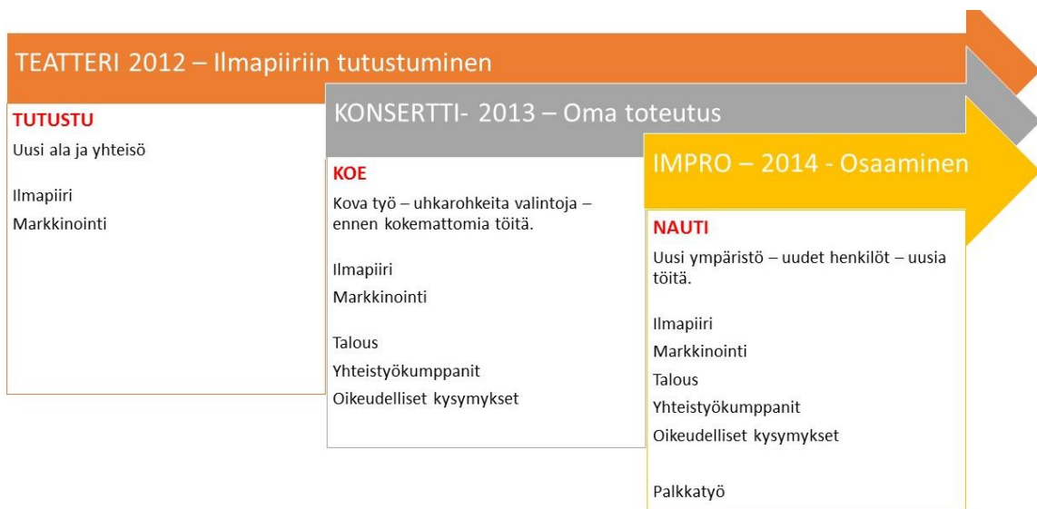
Kuva 7 Kolmivaiheinen eteneminen ja tiedon kumuloituminen.

Kolmivaiheisen etenemisen tärkeys on ollut selkeä. Teatterin ja konsertin työtehtävät ja näistä saatu ammatillinen varmuus ovat olleet tarpeellisia nykyisessä tuottajan työssäni. Nykyinen tuottajan työni on kaiken kokemani jälkeen mielekästä ja mukavaa.