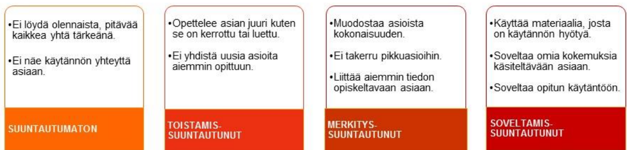
Kuva 4 Tiedon käsittelytavat (Tynjälä 2004, 121-122).

Soveltamissuuntautuneille oppijoille on se materiaali tärkeää, josta on heille käytännön hyötyä. He miettivät myös miten omat kokemukset sopivat opiskeltavaan asiaan. Tästä syystä he pystyvät käyttämään tietoa myöhemmin ja opittu asia palautuu mieleen paremmin. He innostuvat asioista niin paljon, että opinnot viivästyvät. Soveltamissuuntautuneet suhtautuvat kriittisesti tietoon ja saattavat kokea hyvin abstraktien asioiden oppimisen vaikeaksi. (Tynjälä 2004, 121).