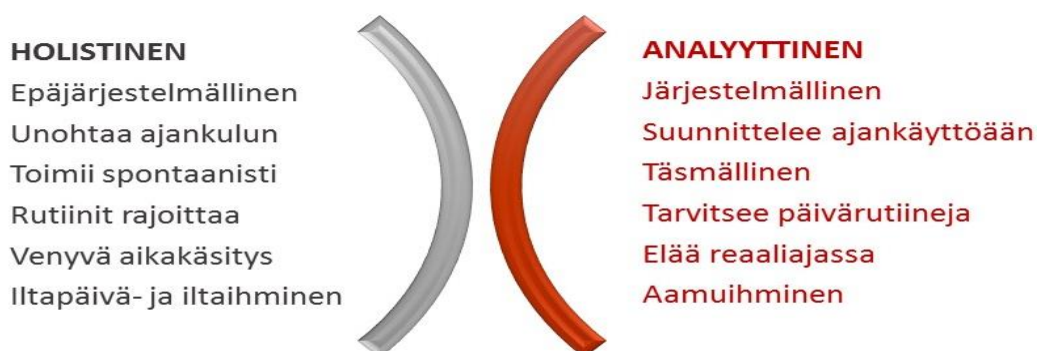
Kuva 2 Analyyttisen ja holistisen ihmisen eroavaisuuksia. (Hurtig 2014, 9).

Holistinen oppija haluaa ensin tietää kokonaisuuden ja sen jälkeen etenee kohti yksityiskohtia. Lisäksi hän haluaa tietää, mikä asia liittyy mihinkin ja mitä hyötyä mistäkin on. Holistinen oppija liittää opeteltavat asiat omiin kokemuksiin ja tekee päätökset tunnepitoisesti. Hän voi tehdä useita asioita yhtä aikaa ja hän suosii sosiaalista kanssakäymistä. (Hurtig 2014, 8).