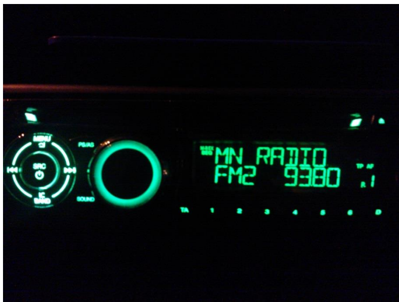
Kuva 1. Maata Näkyvissä -festareiden aikaan Nuotta-taajuus kuuluu myös autoradiossa Turun seudulla.

Tapahtuman radiointi vaatii monenlaisia valmisteluja. Radiointiin ja sen valmisteluun vaikuttavat esimerkiksi se, millainen tapahtuma radioidaan, millaisella kanavalla se radioidaan, kenelle tapahtuma ja radiointi on suunnattu ja ketkä hoitavat radioinnin. Nuotta-taajuuden Maata Näkyvissä -festareiden radiointi on suunnattu erityisesti kristityille, jotka eivät jostain syystä pääse lähtemään tapahtumaan. Kohdeyleisönä ovat nuoret, mutta yhtäläillä kaikki tapahtumasta kiinnostuneet ikään katsomatta – esimerkiksi ne, jotka eivät työ- tai perhetilanteen takia pääse paikalle.