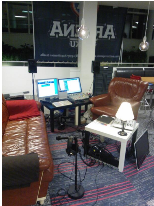
Kuva 3. Nuotta-taajuuden festariradion olohuone vuonna 2013.

Kun tavarat oli haettu eri paikoista ja pakattu, ajoimme Turkuun, jossa rakensimme pisteen valmiiksi. Vaikka mukana oli vähemmän tekniikkaa kuin aikaisempina vuosina, vierähti pystyttämässä pitkä aika. Piste saatiin kuitenkin sisustettua valmiiksi ja tekniseltäkin puolelta pääosin valmiiksi torstain aikana. Festariradion tiimiläiset osaavat käyttää tekniikkaa, mutta kävimme kaikki vielä läpi sillä kertaa käytössä olevan tekniikan ja mikrofonit, jotta kaikki on varmasti selvää ja tuoreessa muistissa.