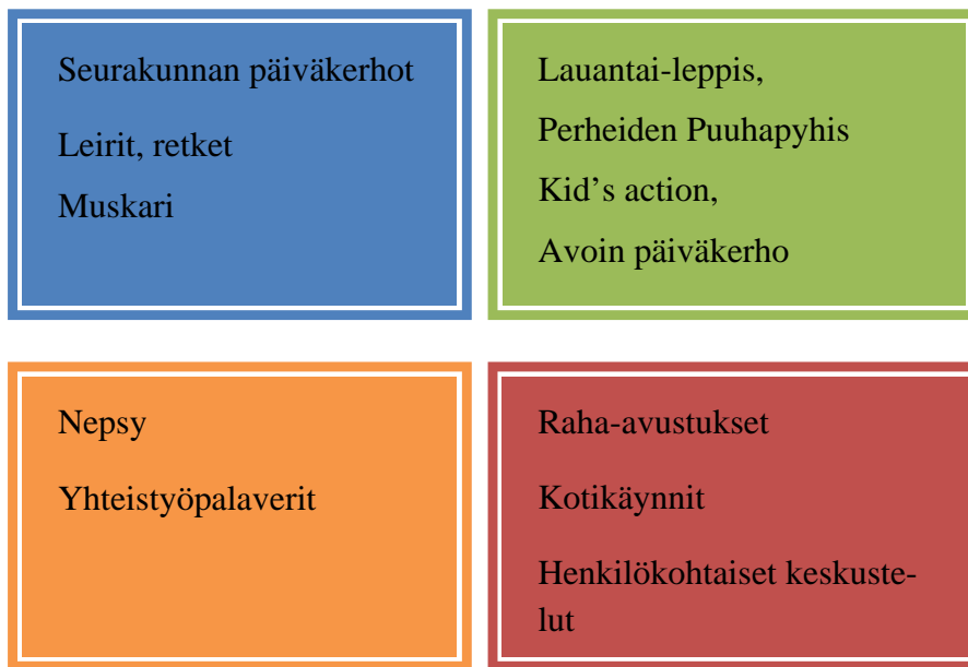
KUVIO 3. Perhetyön neljä ikkunaa Huittisissa

Tällä hetkellä diakonisen perhetyön toteutuminen Huittisten seurakunnassa vaikuttaa hyvältä. Tarkasteltaessa tilannetta perhetyön neljän ikkunan kautta, voidaan todeta, että alun korjaavan työn (ongelmien työstäminen ja kriisiapu) painottuneisuus on siirtymässä enemmän vahvistavan perhetyön kenttiin.