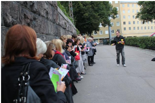
Kuvio 3. Sosiaali-alan ammattilaiset pohtivat omia elämänarvojaan ”pelaten arvopasianssia”

Loimme tarinalliselle seikkailulle kaksi aihealuetta: aikakaudet ja arvot. Varsinaisessa kaupunkiseikkailussa, sosiaalialan ammattilaiset liikkuvat Kalliossa yhden iltapäivän. Osallistujille jaettiin raitiovaunussa matkakortti, jossa luki joko arvo tai kausi . Tämän jälkeen jalkauduimme Karhupuistossa. Osallistujat jaettiin kahteen ryhmään, joista itse johdatin ryhmää joka tutustui Kallioon arvojen kautta.