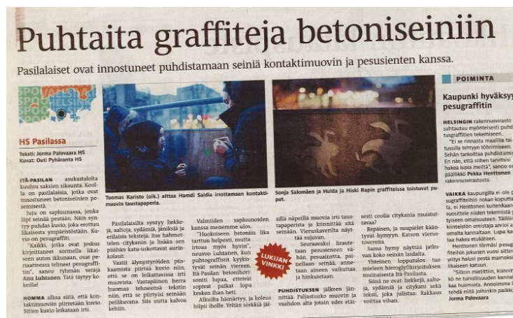
Kuvio 5. Lehtiartikkeli, Helsingin Sanomat 28.3.2014, A 14

Itä- Pasila iskuun –hanke pääsi osaksi vuoden 2012 designkaupunkivuotta. Olin hankkeessa alkuvaiheessa hyvinkin aktiivinen toimija. Nuorten kanssa pidettiin myös esimerkiksi pesugraffittityöpaja. PainepeSURIN ja hankaussienten avulla harmaisiin betoniseiniin pestiin kuvioita.