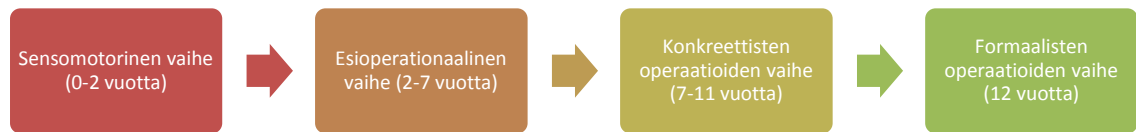
Kuvio 2. Lapsen ajattelun kehityksen neljä vaihetta Piaget'n mukaan (Nurmi ym. 2006).

Sensomotorisessa vaiheessa (0–2 vuotta) lapsi hankkii tietoja havainnoimalla, liikkumalla aktiivisesti sekä käsittelemällä esineitä ympäristössään. Lapsi harjoittelee uusia taitoja toistamalla toimintoja leikeissään. (Lyytinen & Lyytinen 2006, 19.) Kehitysvaiheessa lapsi tutustuu syy-seuraussuhteeseen käytännön toiminnan kuten leikin kautta (Beilin 2002, 120).