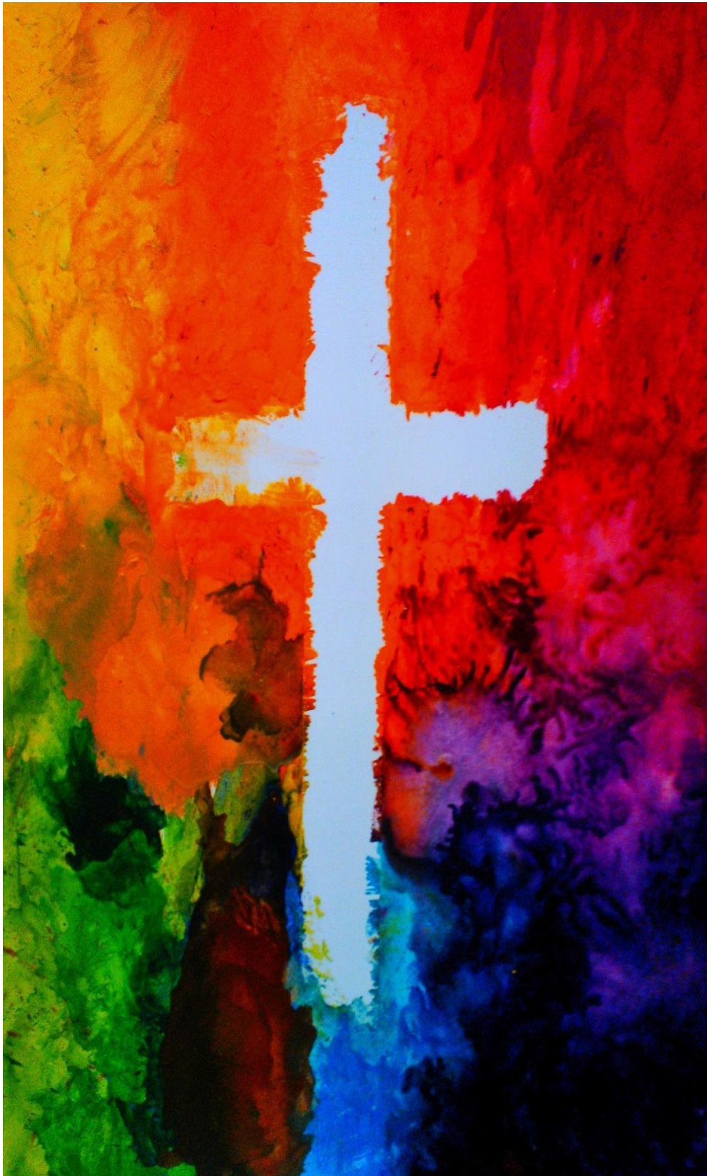
LIITE 1 Harras Arki