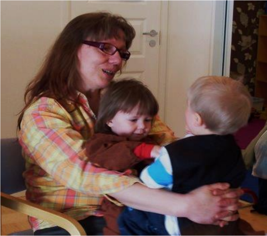
Rajaton rakkaus – rajat ovat rakkautta

näytämme avoimesti tunteemme ja keskustelemme niistä lasten kanssa. Riitatilanteissa opettelemme pyytämään anteeksi ja sovimme riidat.