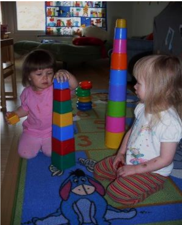
Luokittelua ja järjestämistä