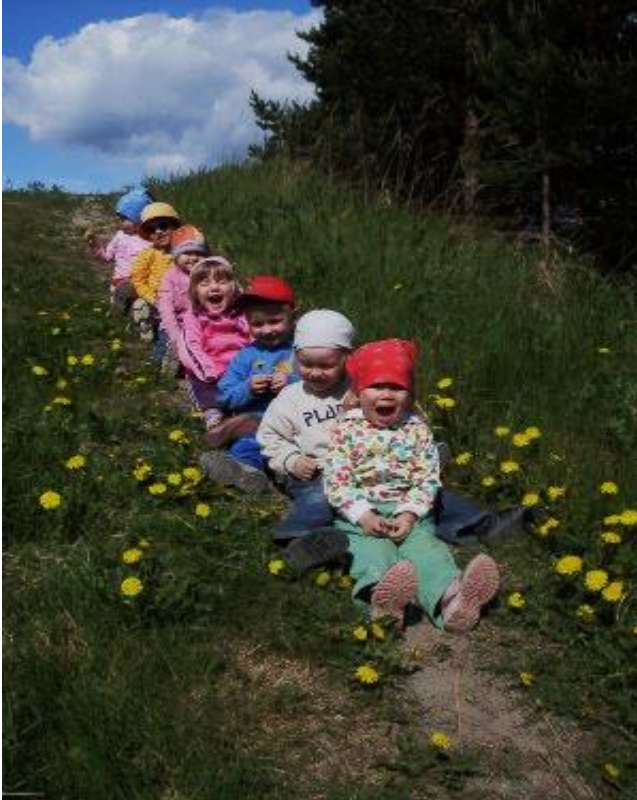
Lapset ovat ilomme!