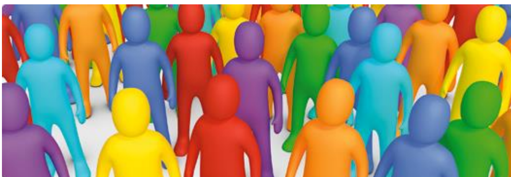
Kuva 2. Kuva on tunnuksena vaaleista vaalit.fi sivustolla.

Europarlamenttivaalit järjestetään kaikissa Euroopan unionin jäsenmaissa viiden vuoden välein samaan aikaan. Äänioikeutettuja Suomen vaaleissa ovat viimeistään vaalipäivänä 18 vuotta täyttävät Suomen kansalaiset sekä viimeistään 80 päivää ennen vaaleja Suomen äänioikeusrekisteriin ilmoittautuneet toisen maan EU-kansalaiset. (Ulkoasiainministeriö c 2014.). Ensimmäistä kertaa Suomi oli eurovaaleissa mukana vuonna 1996, jolloin ne järjestettiin samana päivänä kuin kuntavaalit. Vuonna 1999 Euroopan parlamentin vaalit järjestettiin yhtä aikaa kaikissa silloisessa 15 jäsenmaassa. (Euroopan Unioni 2014.)