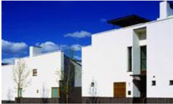
Kuva 1. Suomen suurlähetystörakennus Finska Borgen

Suomen suurlähetystö palvelee suomalaista ja ruotsalaista yhteiskuntaa, yksilöitä ja yrityksiä politiikan, talouden, kulttuurin, sosiaalialan ja konsulitoimintojen kysymyksissä. Konsuliyksikkö palvelee Suomen kansalaisia sekä pysyvästi Suomen ulkopuolella asuvia ulkomaalaisia Suomen viranomaisasioissa. Näitä ovat mm. passiasiat, notaaritehtävät, perheoikeus, kansalaisuus ja asevelvollisuus. (Ulkoasiainministeriö b 2014.) Lisäksi konsulaatti on apuna, jos vaikkapa joutuu matkalla ollessaan hankaluuksiin, esim. tulee ryöstetyksi tai kadottaa passinsa.