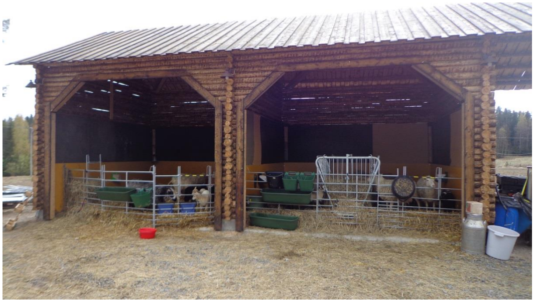
Kuva 3. Green Care -toimintaa aloittavan tilan lammassuojat sopivat kauniisti maalaistalon pihapiiriin.

Isokummun lammastilalla Eskolassa, Keski-Pohjanmaalla, päätuotantosuuntana on lammastalous, mutta Green Care -palvelut tulevat olemaan tilan sivuelinkeinona. Tilalla on 250 uuhua ja hevosia. Tila on aloittamassa päivätoiminnan tarjoamisen kehitysvammaisille, pitkäaikaistyöttömille ja mielenterveyskuntoutujille. Heidän tarkoituksena on osallistua talon ja tilan eri askareisiin monipuolisesti, omien kykyjensä mukaan. Tärkeä osa päivää on myös vuorovaikutus toisten ihmisten kanssa. Tilan emäntä ohjaa toimintaa, mutta ryhmällä on myös oma ohjaaja mukana. Jo aiemminkin tilan toiminta on ollut hyvin avointa, tilalle on esimerkiksi järjestetty tilavierailuja ja se on toiminut yhteistyössä maatalousoppilaitoksen kanssa. Ajatus tilan liiketoiminnan laajentamiseen lähti emännän omasta kokemuksesta sairastuttuaan. Hän koki saavansa parhaan avun omien eläinten kanssa puuhastellessa, ei sairaalaympäristössä. (Haapamatti 2014, 54-56).