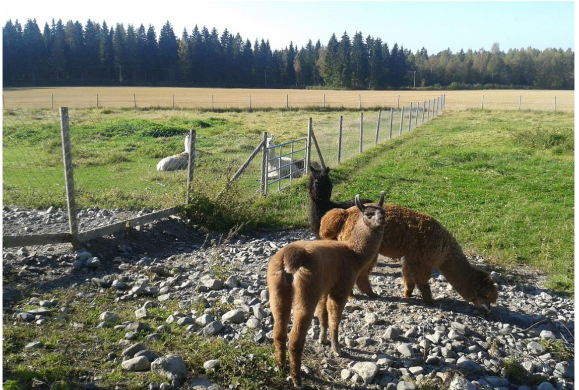
Kuva 4. Alpakat ja laamat ulkoilevat tarhassa, jonne on tallista vapaa pääsy. Takana näkyy juuri puitu sänkipelto ja taustalla metsää. Kaikki kuvassa näkyvä on hyödynnettävissä Green Care -palveluissa.

Green Care -toimintaa harjoittava tila hyödynsi suorakylvössä olevat lähipellot eläinten kanssa toimimisessa. Syksyisin sänkipelloilla pääse ratsastamaan tai taluttamaan eläimiä. Talvella pellolle lingotaan ura, jossa eläinten kanssa on helppo liikkua. Haastattelussa kävi ilmi, että heidän suunnitelmissaan on edelleen tarkoitus kehittää ja monipuolistaa palvelujaan Green Care -toiminnan ympärillä. Tilalta on suunniteltu lähteväksi läheiseen metsään maisemapolku, joka olisi mahdollinen kulkea myös pyörätuolilla. Polku kulkisi kirkasvetisen joen vartta, kauniissa suomalaisessa, perinteisessä metsämaisemassa. Maisemapolusta on olemassa jo maisemasuunnittelijan kanssa valmisteltu suunnitelma. Myös tilan kokonaisvaltai-