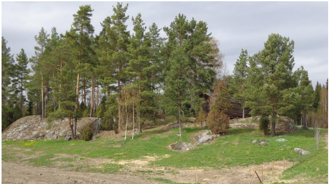
Kuva 2. Maatilan pihapiiristä avautuu monenlaisia maisemia, joita hyödyntää Green Care -toiminnassa.

Maaseutu ympäristönä ja maatilat toiminnallisina yksikköinä tarjoavat monipuoliset puitteet hoiva ja hyvinvointipalvelujen tuottamiselle. Maatiloilta tai niiden yhteydestä löytyvät usein monipuolisesti vihreässä hoivassa käytetyt elementit, kuten eläimet, luonto, puutarha, metsä ja vesi.