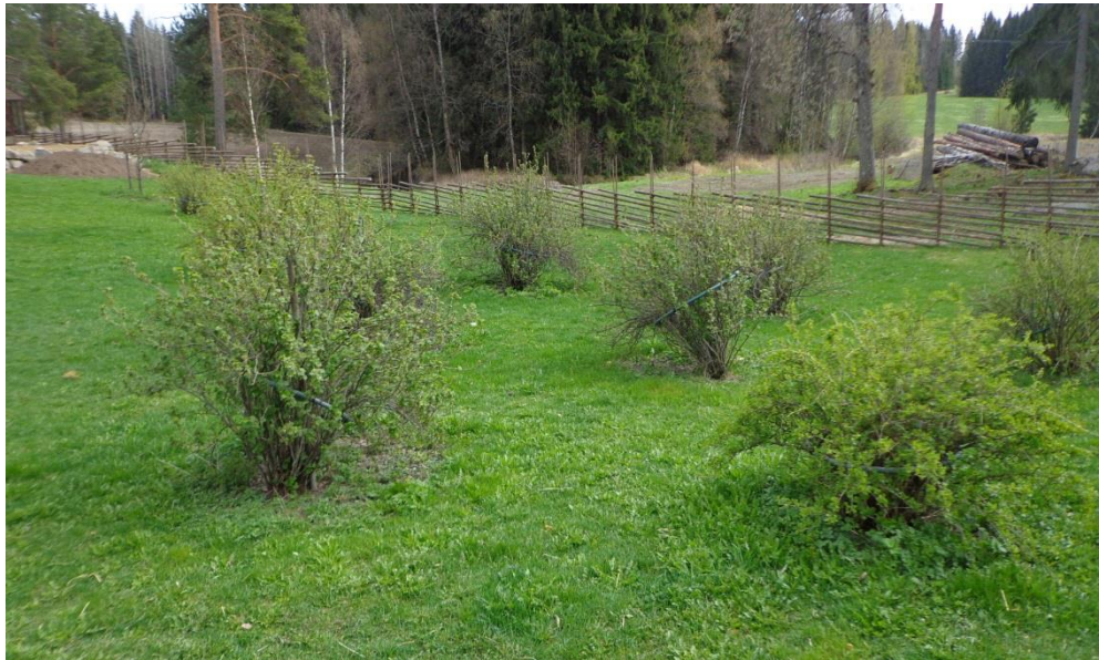
Kuva 5. Green Care -toimintaa aloittavan maatilan pihapiirissä on marjapensaita. Takana oleva risuaita sopii hyvin maisemaa, mutta sen lisäksi määrittää myös turvallisen pihapiirin rajat.

Perinteisesti maataloilla, talouskeskuksessa on sijainnut jonkinlainen puutarhaympäristö, marjapensaita ja hedelmäpuita. Myös koristekasvit kuuluvat perinteiseen maatilaympäristöön. Jos maatilalla ei ole tällä hetkellä käytössä olevaa puutarhaa, on siellä varmasti kuitenkin puitteet sellainen perustaa. Puutarhoja on myös mahdollisuus kunnostaa hyvinvointipalvelujen käyttöön tai samalla hyvinvointipalveluja tuottaen. Haastatelluilla maataloilla kumpikaan ei varsinaisesti hyödyntänyt puutarhaa omissa hyvinvointipalveluissa, mutta toimintaa aloittavan lammastilan koko pihapiiri tulisi olemaan työtoiminnan käytössä, joten puutarhan hoitoon liittyvää puuhaa varmasti löytyy. Myös hoivayrittäjän haastattelussa tuli selvästi esiin se, että viherkasvit ovat jo sisätiloissa ympäri vuoden asukkaille tärkeitä ja he myös hoitavat niitä. Kesällä hoivakodin parvekkeelle perustetaan pieni puutarha kukkineen ja yrteineen.