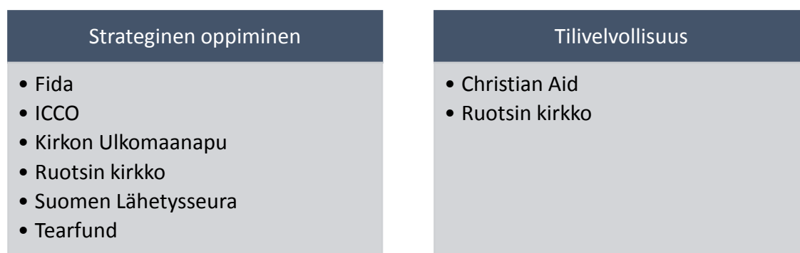
KUVIO 2. Tutkittujen toimijoiden vaikuttamistyön seurannan periaatteet.

Christian Aid haluaa työnsä pysyvän läpinäkyvänä ja julkaisee siksi työstään vuosiraportteja, joissa kerrotaan Christian Aidin vuoden työn saavutuksista, heidän kohtaamistaan haasteista ja tulevaisuuden työnäkymistä sekä työn tavoitteista (Christian Aid i.a.b).