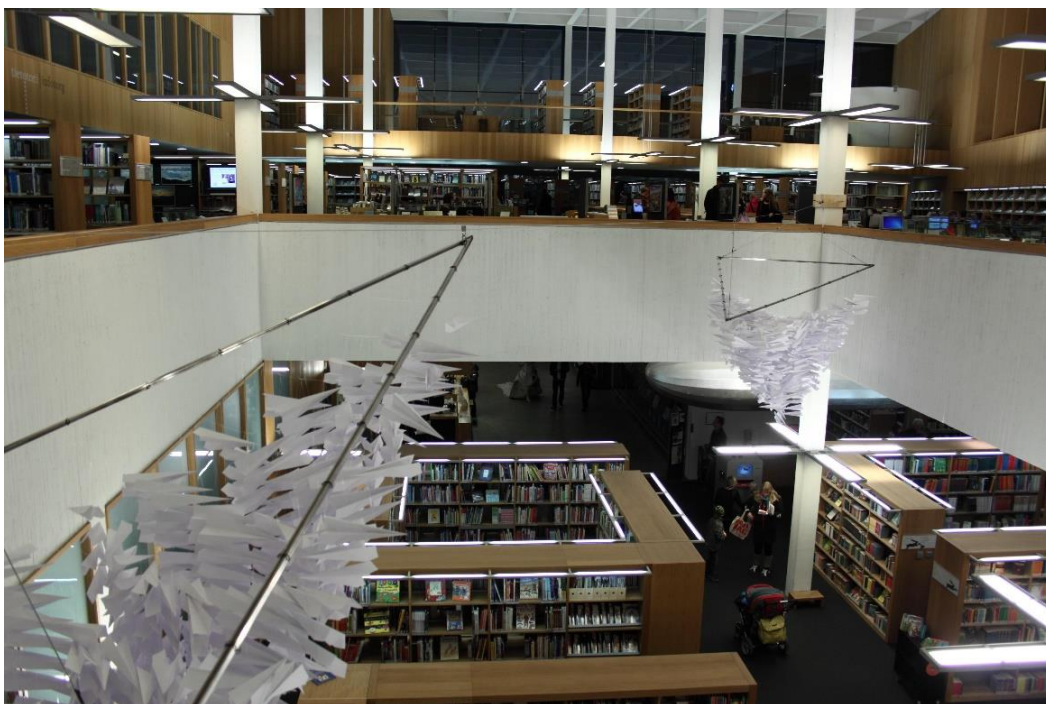
Kuva 10: Anne Kantola, Mira Kjemo ja Milla Norman: Kuilu. 2013.

paperilennokit ovatkin monimutkaisempia muotoja kuin usein minimalistisissa teoksissa.