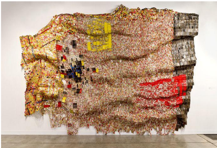
Kuva 4. City Plot (2010). El Anatsui. 25

normaalisti heitetään pois jätteenä. Jättemateriaali itsessään on kuitenkin usein arvokasta, sillä nykyaikana on paljon kierrätyksen ja uusiokäytön mahdollisuuksia, mistä voi olla hyötyä niin ekologisesti kuin taloudellisestikin 22 . Teos kuitenkin näyttää sen materiaalin, joka muutoin olisi mahdollisesti jäänyt luontoon, jos sitä ei olisi koottu teokseksi, eli se pikemminkin näyttää ongelmana alueiden saastumisen. Harneyn mukaan se viittaa myös liikakulutukseen 23 . Teoksen voi ajatella viittaavan myös alkoholin kulutukseen, kun teos välillisesti näyttää, että juotuja alkoholiannoksia on paljon. Teoksen voi ajatella olevan jotain muuta kuin installaatiotaidetta 24 , mutta kun teos tuodaan galleria- tai museokontekstiin, se installoituu välittömästi. Installoituminen johtune materiaalista ja sen kontekstista. Teos on hyvä esimerkki sellaisesta teoksesta, jonka voi katsoa olevan installaatiotaidetta, vaikka sen voi asettaa moneen eri tilaan. Se kommentoi Kiasman tilaa eri tavoin kuin veistos, joka on itsessään tarkastelun aihe. Tämä teos kuitenkin levittäytyy tilaan ja kommentoi myös aikaa näyttämällä tietyssä ajassa kertyneen jätteen määrän.