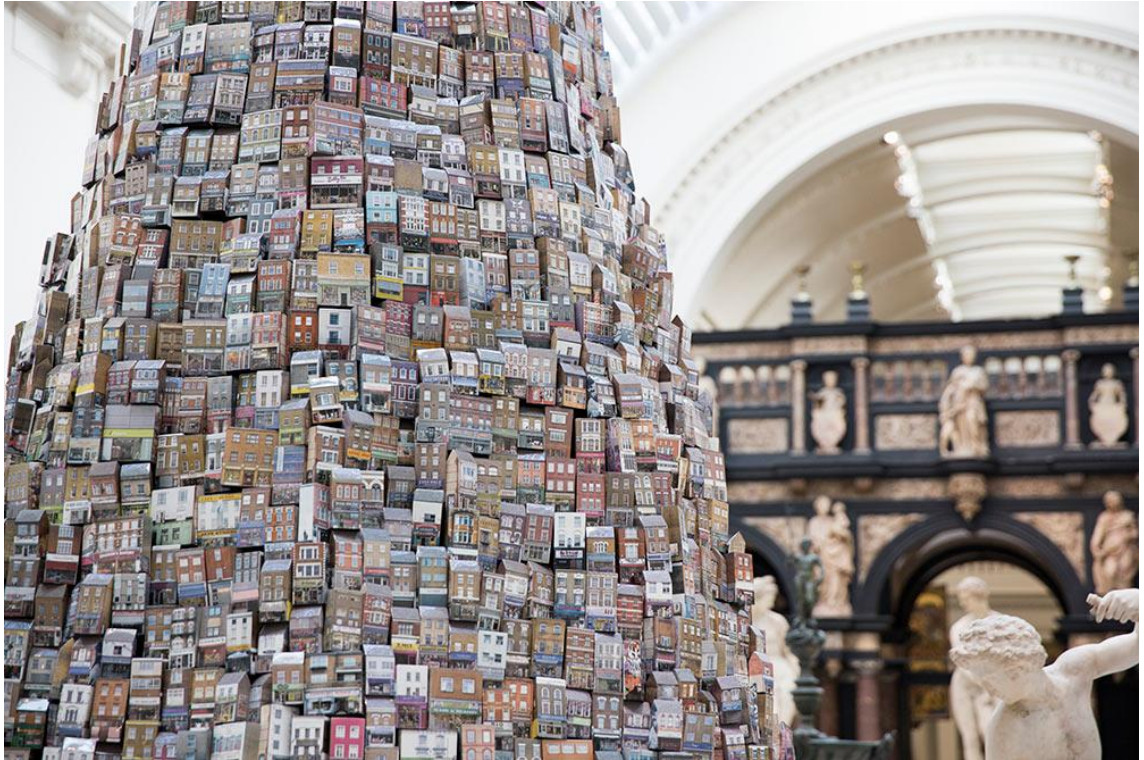
Kuva 1. Barnaby Barnford: The Tower of Babel. 14

teoksessa. 13 Teos siis eräällä tavalla myös kategorisoi ja arvottaa rakennuksia niiden käyttötarkoitusten perusteella.