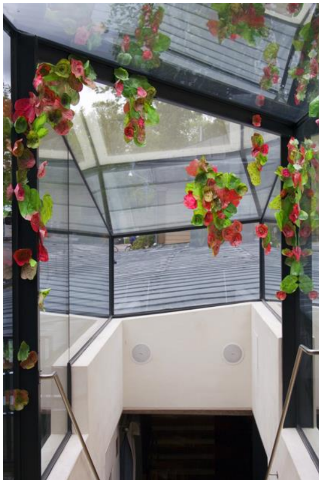
Kuva 8. Anne Kantola ja Mira Kjemo: Katoamaton. 2015. Kuva: Anne Kantola

Ravintola Pinellan vuoden 2015 kesänäyttelyä varten toteutettu Katoamaton on myös toistollinen teos. Siinä tarkastelun aiheena on kukkasommitelma, joka on tavallaan yksi tarkastelun kohde, joka koostuu monesta osasta. Teoksen muoto on lähellä materiaalin sisäistä toistoa, mutta koska kukat ovat käsitettävissä myös itsenäisiksi objekteiksi, ajattelen teoksen olevan varioivasti toistollinen. Toisto monistuu teoksessa, sillä siitä on kaksi versiota, jotka ovat samaan aikaan sekä itsenäisiä että toisiinsa liitoksissa, samaan kokonaisuuteen kuuluvia. Lisän tuo tähän vielä se, että materiaali, eli kertakäyttösadetakit, ovat myös toistollinen elementti. Tässä tapauksessa kertakäyttösadetakkien toisto on kuitenkin piilotettua, sillä katsoja ei näe, kuinka monta sadetakkia on käytetty. Katsoja voi kuitenkin loogisesti päätellä, että sadetakkeja on todennäköisesti käytetty teoksessa useampia.