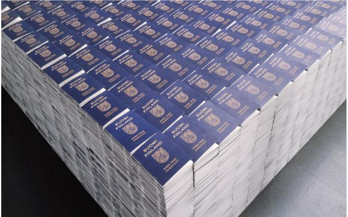
Kuva 3. Alferdo Jaar. Miljoona Suomen passia. Maailma jossa elämme. 20

Muotona teos on identtisesti varioiva, koska kaikki passit ovat toistensa kopioita. Nämä passit muodostavat yhtenäisen kuutiomaisen muodon, mutta silti katsoja tajuaa, että näennäisesti yhtenäinen kuutiomuoto koostuu monesta eri osasesta, minkä teoksen nimikin jo paljastaa.