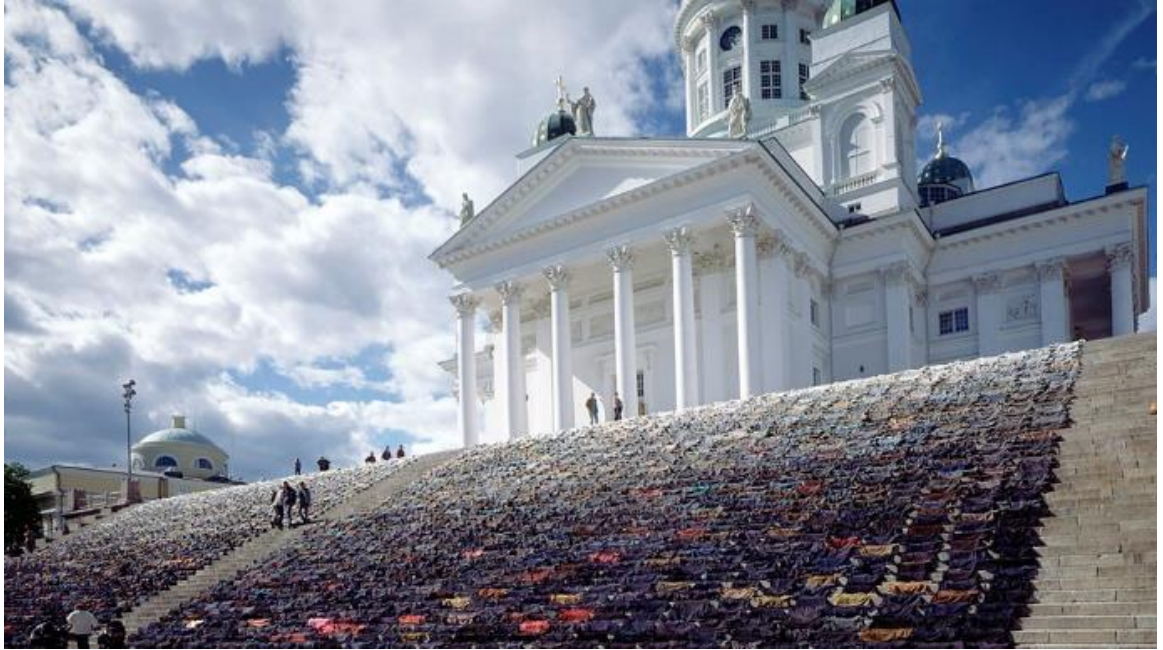
Kuva 2. Tuhansien takkien tie. 17

2000. Se koostuu noin kolmesta tuhansista miesten pikkutakista. Takit on sijoitettu portaille siten, että tummimmat takit ovat alhaalla ja takkien kankaat vaalenevat portaita ylöspäin noustessa. 16