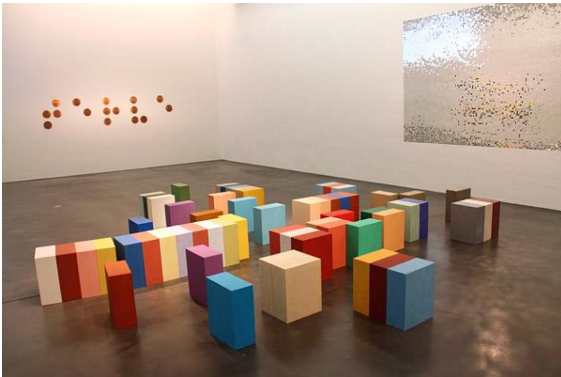
Kuva 9. Silja Rantanen: "Burano" (1998). Kiasma Hits-kokoelmanäyttely juhlistaa teini-ikäistä museota. 46