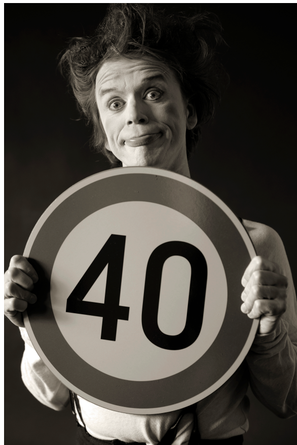
Kuvio 9. "Alter Ego" Kuva: (Nadi Hammouda)

ST: Teatteri ja klovneria on minulle kuin shamanismia. Ennen esiripun tai kuvitteellisen esiripun nousua jännitän kuollakseni. Kun esirippu nousee sisälläni menee "Fire" -kytkin päälle ja asioita alkaa tapahtumaan. Ajaudun useasti flow-tilaan ja seuraan sitä kuin koira isäntäänsä. Olen rohkea, pystyn kuuntelemaan ja näkemään tulevia asioita mihin ne voivat johtaa. Tiedostamattomuus auttaa vilpittömyyteen ja rakastan ennalta arvaamattomia tilanteita. Alter egoni on sankarini, joka pelastaa minut tylsyydeltä.