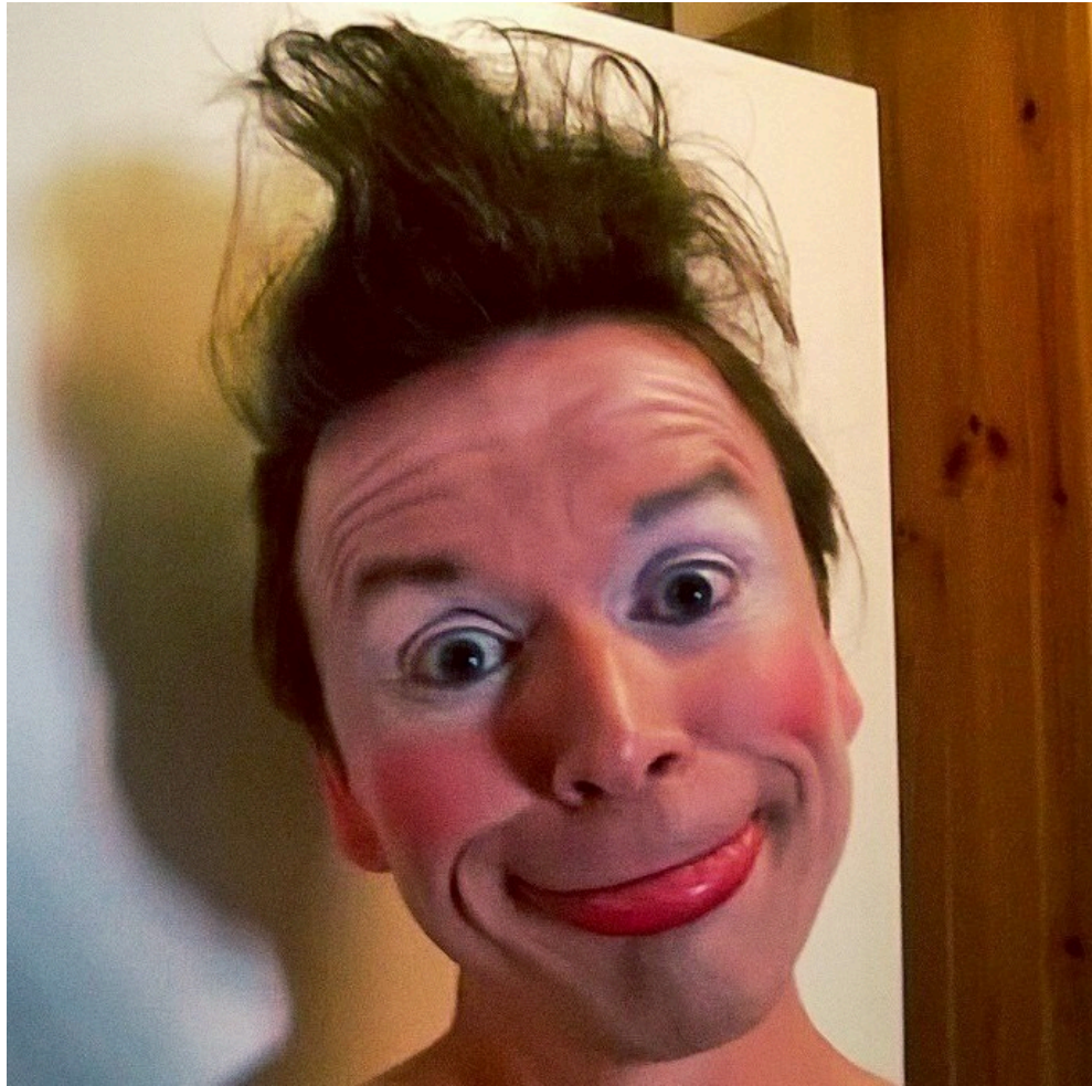
Kuvio 13. Demonstraatio idiotismista.

Seuraavassa harjoituksessa kävi hyvä tuuri, hän leikki hirviötä koska oli kokenut olevansa sellainen ja käänsi alahuulensa ympäri. Ohjaaja oli ihmeissään kuinka paljon kasvojeni ilme muuttui. Tuosta huuli asennosta tuli hyvin merkittävä osa klovni hahmoa. Se oli tulkinnan keino. Sielu. Sydän. Henki. Kaikki. Hänen sisäinen idiootti oli löytynyt. (Pryke, työpäiväkirja/muisto, 2014).