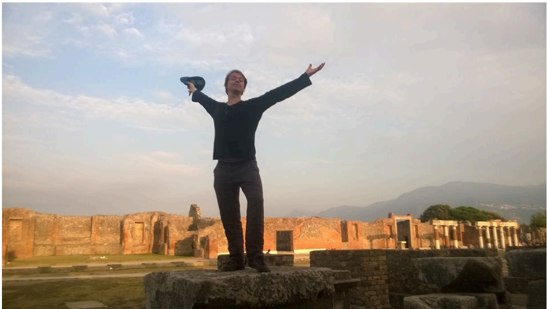
Kuvio 14. Pompejin historiallinen kaupunki Napolissa.