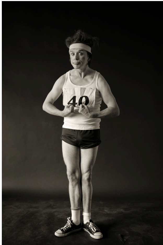
Kuvio 16. Maratoonari.

ST: Pyörittelen silmiäni lukiessani Napolin muistoja. Toki hyväksyn kirjoittamani mutta miten taiteen tekeminen on voinut olla niin vaikeaa. Korhosen väitöstyötä lukiessani siitä välittyi minulle tietyn tyyppistä epätoivoa, jopa angstia. Korhosen sielunmaailma on kuin veljeyttä johon on helppo samaistua. Teksti esittäytyy surullisena ja ajoittain sekavana luettavana. Ajattelin alusta loppuun, että hanki hyvä mies elämä itsellesi kunnes tajusin, että olen itse ollut hyvinkin samanlainen. Kenties avuttomuuden tunne kuuluu klovneriaan ja ihmisyyteen.