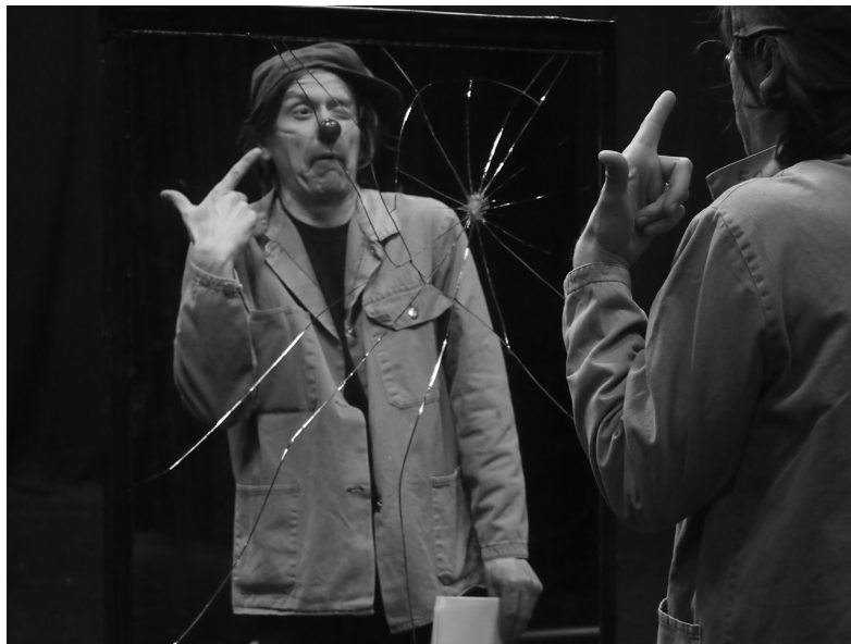
Kuvio 17. Kerro kerro kuvastin.

Lecoq puhuu kirjassaan yhdestä suuren oivaltamisen hetkestä omassa klovnerian opetuksessaan. Hän kertoo kuinka koulun alkuaikoina 1960-luvulla he olivat yrittäneet tutkia klovneriaa epäonnistumalla siinä kerta toisensa jälkeen täydellisesti. Oppilaat olivat ajautuneet esittämään klovneja mm. vääntämällä naamoja ja saamaan aikaan naurua laskemalla housunsa alas. Mielenkiinto oli syntynyt, kun oppilas oli tullut takaisin omalla penkille istumaan ja vaipunut epätoivoon omasta yrityksestään. Lopputuloksena oli ollut nauru. Oppilaat olivat paljastaneet todellisen luonteensa, heikkoutensa. Lecoq oli oivaltanut oppilaiden epätoivon hetkissä, että tragedia, joka ihmisen sisällä asuu muuntautuukin komediaksi (Lecoq, 2007. 152). Meissä asuva tragedia on mielestäni komedian alkulähde, meidän tulisi vain osata käyttää sitä oikein. Meidän tulee hyväksyä itsemme juuri sellaisina kuin olemme, tehdä pilaa omista heikkouksistamme.