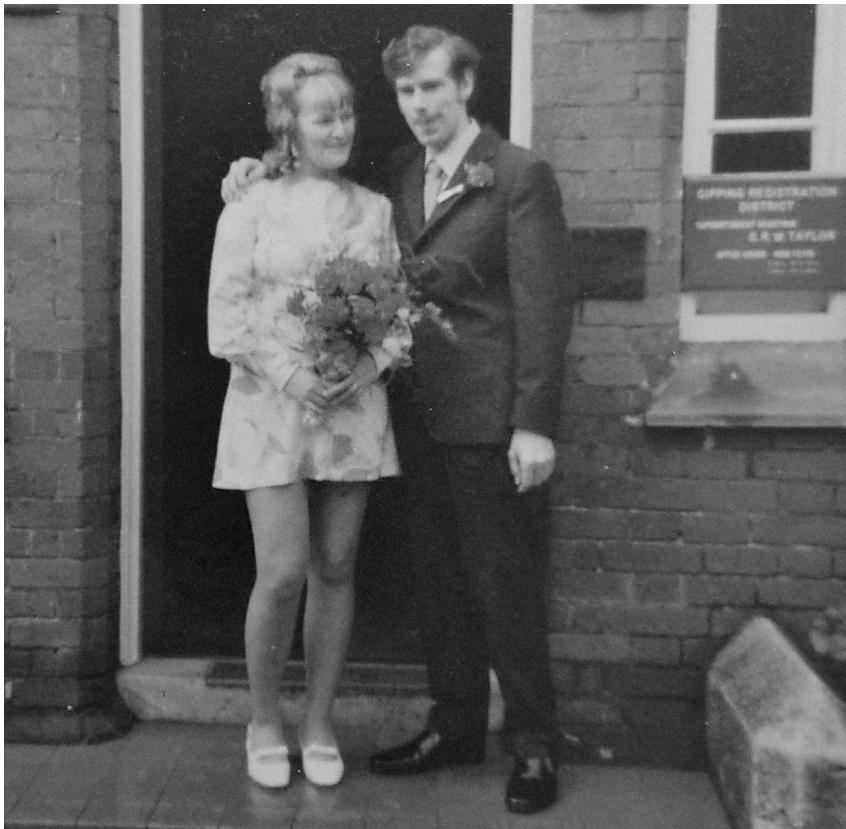
Kuvio 4. Äiti & Isä naimisiin