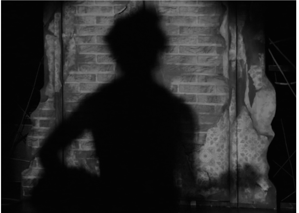
Kuvio 21. The end is the beginning.