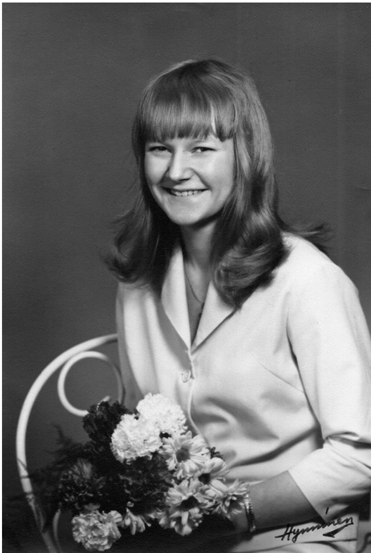
Kuvio 3. Äiti.

Äitini on syntynyt Kajaanissa. Äiti oli nuorena löytänyt veljensä ansiosta rock and rollin ja Beatlesin. Hän halusi kiihkeästi tietää mitä laulut tarkoittivat suomeksi ja niin hän oppi kohtalaisen englannin kielen. Kielen opiskelu -60 luvulla oli paljon haastavampaa kuin nykyisin. Kaikki tieto oli etsittävä yhdestä kirjasta, joka löytyi paikallisesta kaupunginkirjastosta. Englannin kielen opiskelu oli kuin palapelin rakentamista. Äidin luja tahto auttoi kuitenkin häntä oppimaan. Äidin suurimpana haaveena oli päästä Englantiin ja löytää sieltä ikuinen rakkaus.