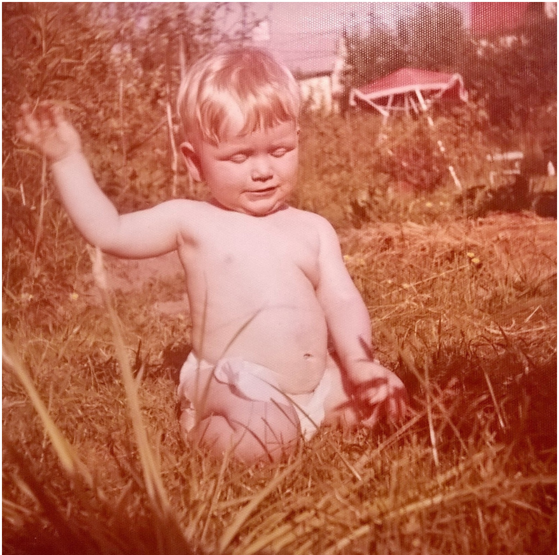
Kuvio 5. Klovni syntyy.

Aika Englannissa oli hieman yllättäen äidille tiukkaa ja koti-ikävä alkoi nopeasti raastamaan äidin sydäntä. Koti-ikävä saikin lopulta niin lujan otteen, että isä ja äiti muuttivat Kotkaan 1972, ja niin minutkin kylvettiin alkuun. Raskauden aikana äiti alkoi kärsimään pahoista paniikkihäiriöistä, ja raskausaika oli muutenkin vaikea. Äiti kertoi minulle, että kun synnyin, isä oli aamuvuorossa paperitehtaalla, jonne hän oli päässyt hyvällä tuurilla työhön. Äiti oli soittanut isän tehtaalle ja kertonut syntymästäni. Isä oli itkenyt onnesta. Minä olin syntynyt.