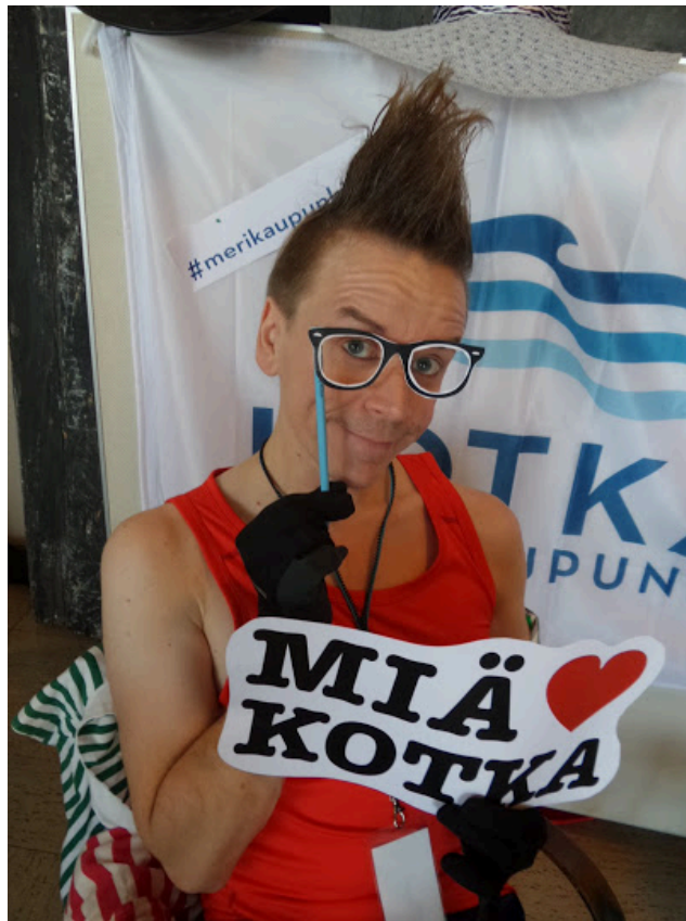
Kuvio 20. Paljaana.