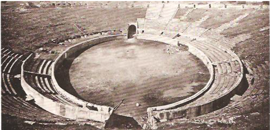
Kuvio 15. Pompejin amfiteatteri