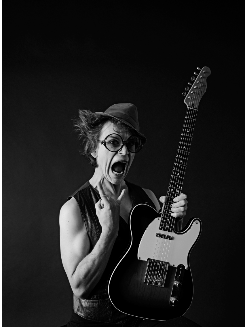
Kuvio 19. Haaveista suurin.