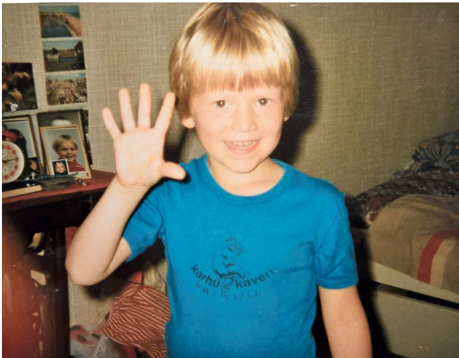
Kuvio 1. Minä.

Isäni taustasta johtuen olen Englannin kansalainen. Olen statukseltani toisen polven maahanmuuttaja. Olen aina ajatellut itseni olevan " Stranger in the strange land " (Iron Maiden 1992). En ole koskaan oikeastaan tiennyt, mihin kuuluun tai minkä maalainen olen, mikä on minun kulttuurillinen identiteettini. Elämä on ollut ajoittain raskasta, olo on ollut kuin laumasta karkotetulla villieläimellä, joka etsii omaa paikkaansa maailmassa.