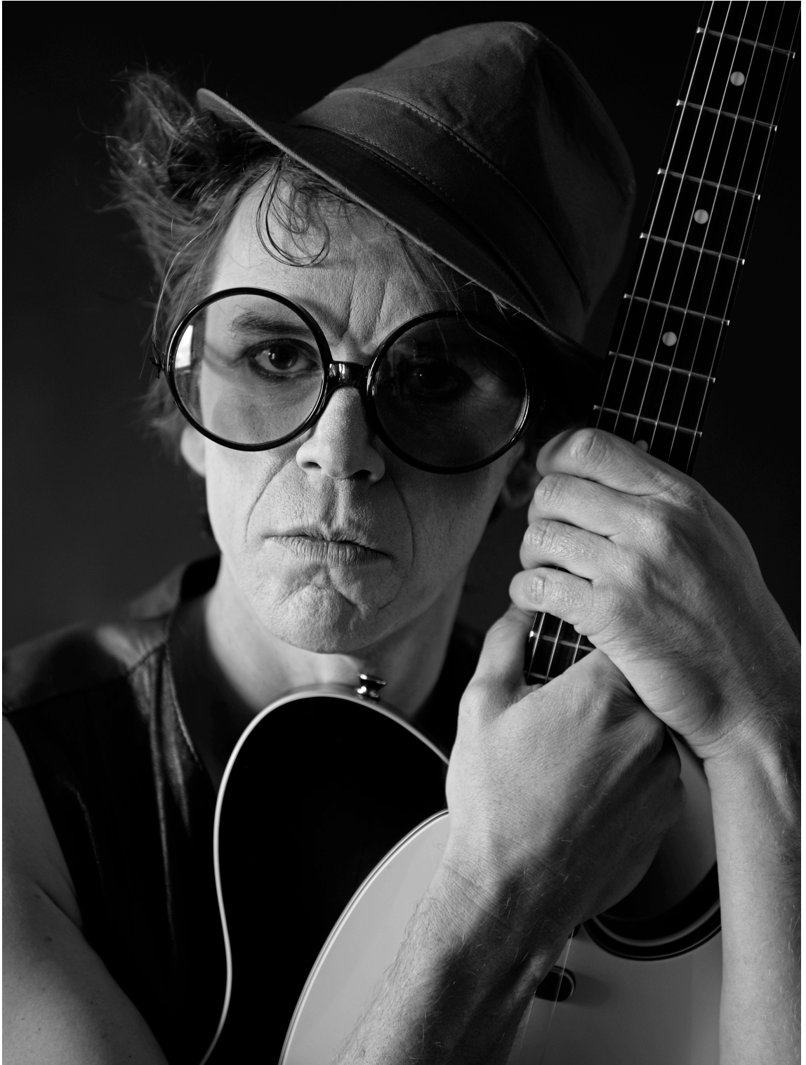
Kuvio 12. Sisällä.