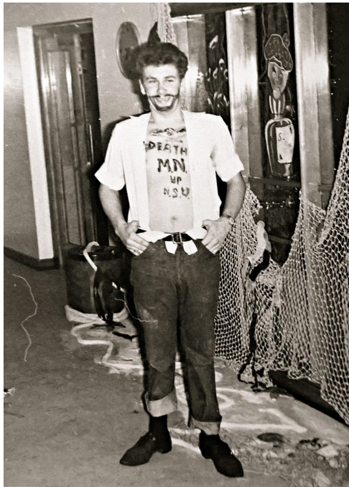
Kuvio 2. Isä Merimiesten juhlissa.

Haavekuvissani näen isäni kirjailija Tove Janssonin luomana Nuuskamuikkusena. Rauhallinen, viisas mutta jollakin tavalla eksynyt. Isä kiersi erilaisissa laivoissa melkein koko maailman ympäri. Hän teki töitä hissipojasta tarjoilijaan, kunnes päätyi työskentelemään vuonna 1969 rahtialukselle, jonka reittinä oli yllättäen Suomi ja kuinka ollakaan merikaupunki Kotka.