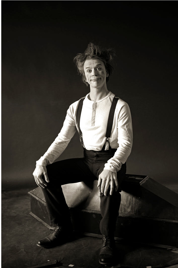
Kuvio 8. Ensimmäinen kuva Mr. Prick -hahmosta.

On vaikeaa määritellä tarkasti mistä soolotyön rakentaminen lähti liikkeelle. Pohjalla oli pitkäaikainen unelma omasta klovniesityksestä. Merkittävin asia unelmani toteuttamiselle oli Suomen kulttuurirahaston Kymenlaakson maaseutuosaston myöntämä 13 500 euron apuraha taiteelliseen työskentelyyn. Taiteen edistämiskeskus myönsi 1000 euron apurahan ja Kotkan kaupunki 500 euron apurahan sekä ilmaiset harjoitus- ja esitysvuorot paikalliseen 4.teatteriin.