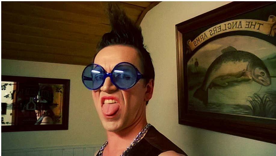
Kuvio 18. Mr Prick Live at wc.

Korhosen pohdinnassa törmään ensimmäistä kertaa sanaan näyttelijä. Minun henkilökohtainen sankarini, alter egoni, on siis näyttelijä, valtava ristiriita. Osa minusta haluaisi hyväksyä Korhosen väittämän, ja osa minusta pelkää oman alter egoni murtumista. Toki klovnerian tekeminen vaatii oman tekniikkansa, joka muuntaa sen sanan varsinaisessa merkityksessä näyttelijäntyöntekniikaksi. Näyttelijä -sanan käyttäminen aiheuttaa henkistä pahoinvointia ja sisäistä kriisiä. Red Nose Clubin kotisivuilta löydän onnekseni lohdutuksen kriisiin: Klovnia ei pidä ruveta määrittelemään (Red Nose Club). Matka tuntemattomaan jatkuu edelleen.