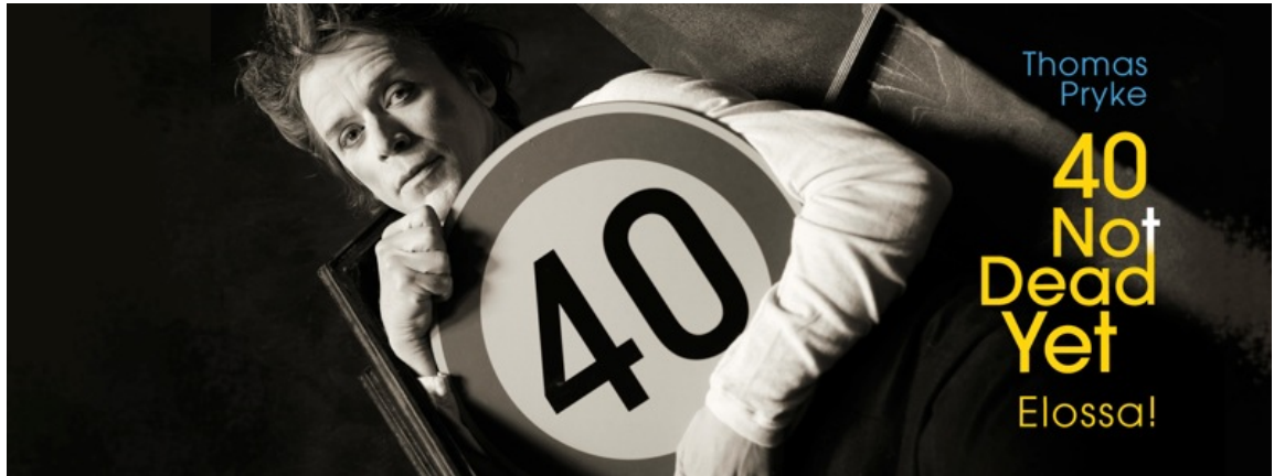
Kuvio 7. Sähköinen markkinointiesite.

Ensimmäinen klovnisooloni 40 Not Dead Yet – Elossa! (oodi ikäkriisille) on teos, joka käsittelee kaikkea sitä, mitä olen elämässäni kokenut ja haaveillut. Aiheena esityksessä on ikääntymisen ja kuoleman pelko. Kuinka todistaa itselleen ja katsojille, että kaikki on vielä mahdollista keski-iästä huolimatta. Kuinka välttyä kauhistuttavalta ajatukselta, jossa istun kiikkutuolissa muistelemassa elämäni, että jäipäs sekin haave toteuttamatta.