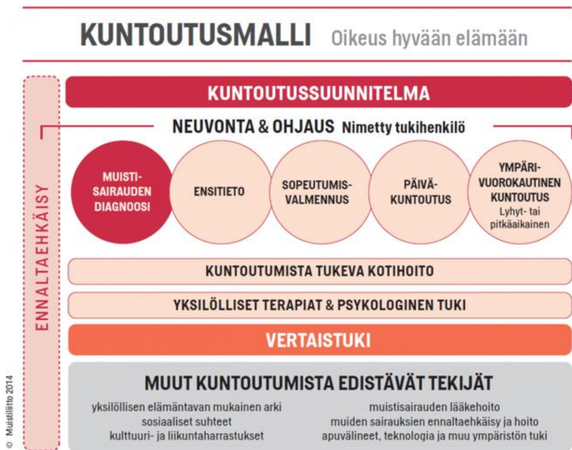
Kuva 2. Muistisairaahan kuntoutusmalli (Muistiliitto 2014)

Muistiyhdistysten toiminta muodostaa merkittävän osan muistisairaiden palveluista, varsinkin sairauden varhaisvaiheessa. Ja koska jokaisessa Suomen kunnassa tai kaupungissa ei ole omaa muistiyhdistystä, on rakennettu Muistiluotsi-verkosto, jolla pyritään viemään palveluita myös kuntiin, joilla ei ole omaa yhdistystä. Tällä pyritään turvaamaan muistisairaiden palvelut myös katvealueilla. Muistiliitto on laatinut kuntoutusoppaan muistisairautta sairastaville ja oppaasta löytyy hyvin havainnollistava kuva muistisairaahan kuntoutusprosessin etenemisestä (Kuva 2.) Kuviota voi käyttää myös havainnollistamaan muistiyhdistysten paikkaa palveluketjussa.