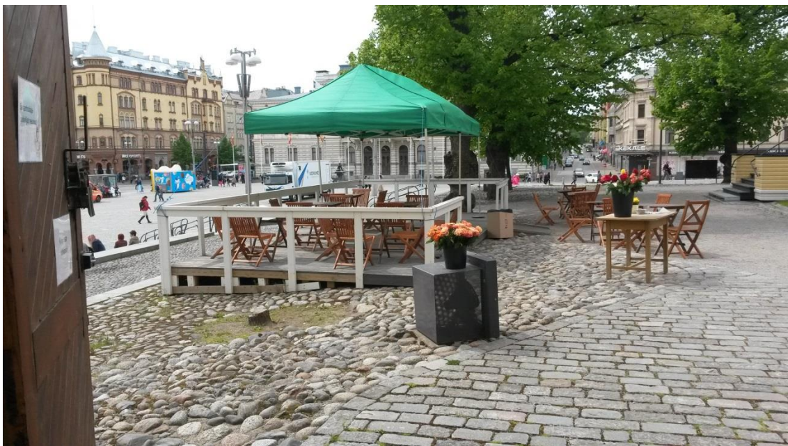
Vanhan Kirkon piha-alueetta