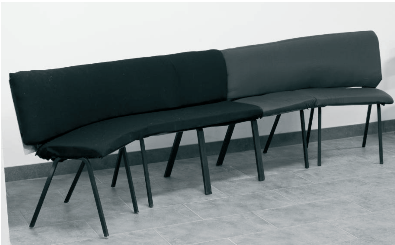
Kompissoffa av sex gamla skoltolar.