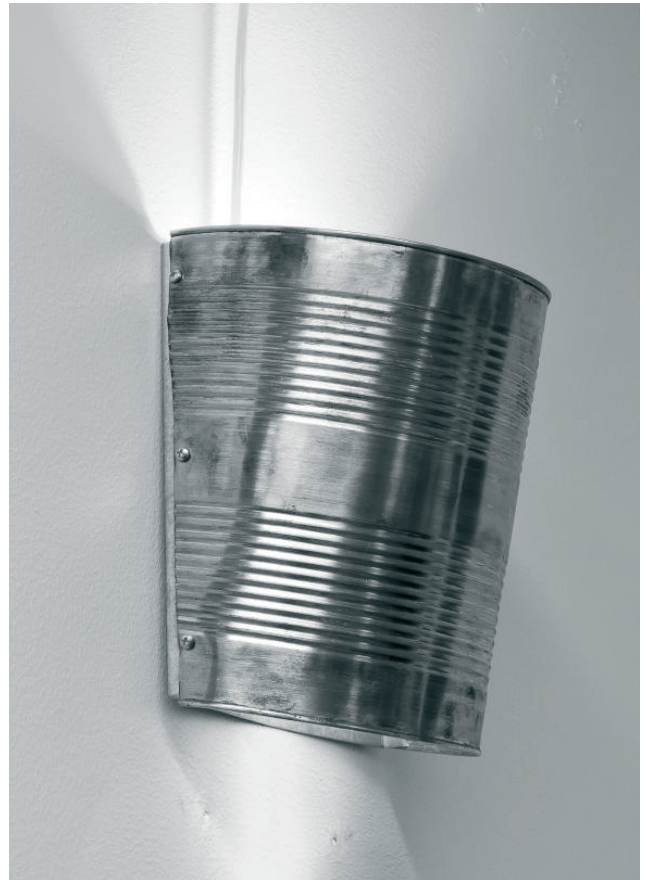
Lampa av gurkburk.