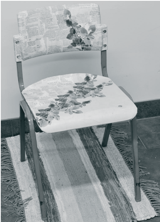
En studerandes stol beklädd med blommor och blad från utbildningsbroschyr på hemvävd matta.