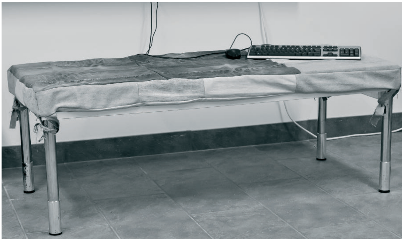
Jeanssoffa av gammalt skrivbord.