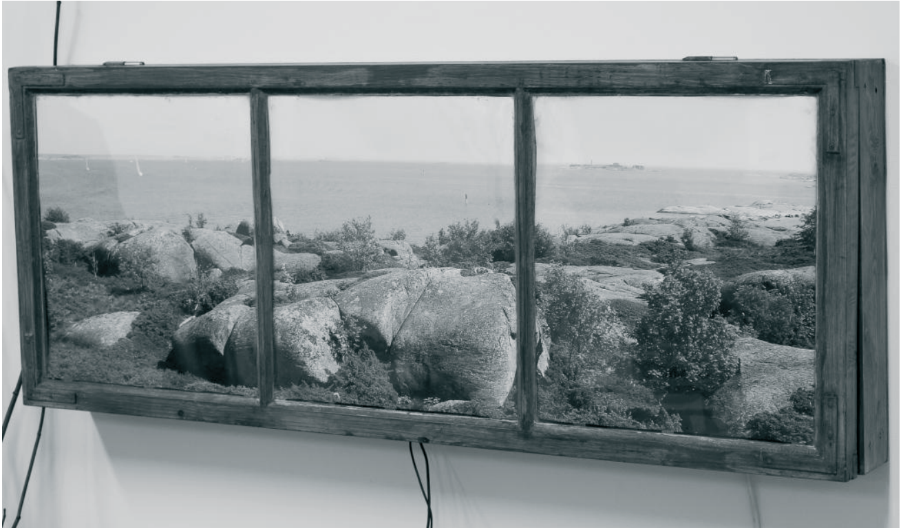
Fönsterdator med havsutsikt.