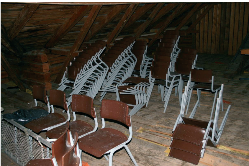
Överblivna stolar på vinden.