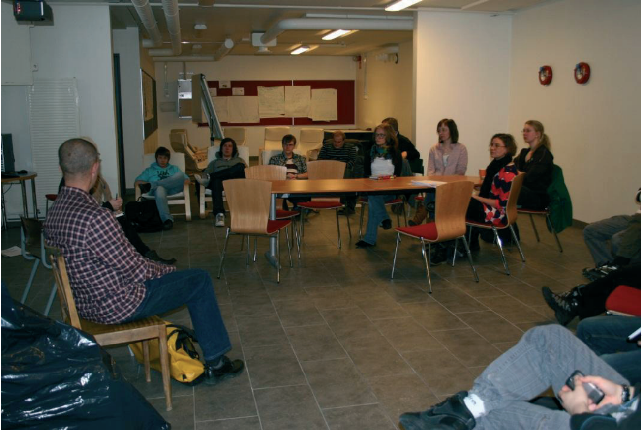
Studerande och handledare träffar samarbetsparterna i Bombskyddet före omvandlingen.

ledningsgrupp och marknadsfördes till alla studerande på enheten genom e-post och Info-TV och ett intressekartläggningmöte. De studerande som anmält sig till kursen styrde dock vilka utbildningsprogram som sist och slutligen deltog.