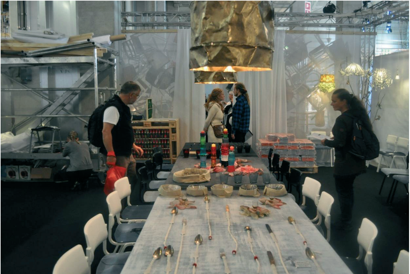
Trash Design i Dodo Oy:s monter på Habitaremässan 2011, se speciellt Novias stolar.

rande hjälpte till i Dodo Oy:s Trash Design monter. I den monter fanns även Trash Mission Novias produkter utställda. Produkterna utgjordes av 40 stolar, lampor, konstverk och dekorationer, som finns presenterade i collage nedan.