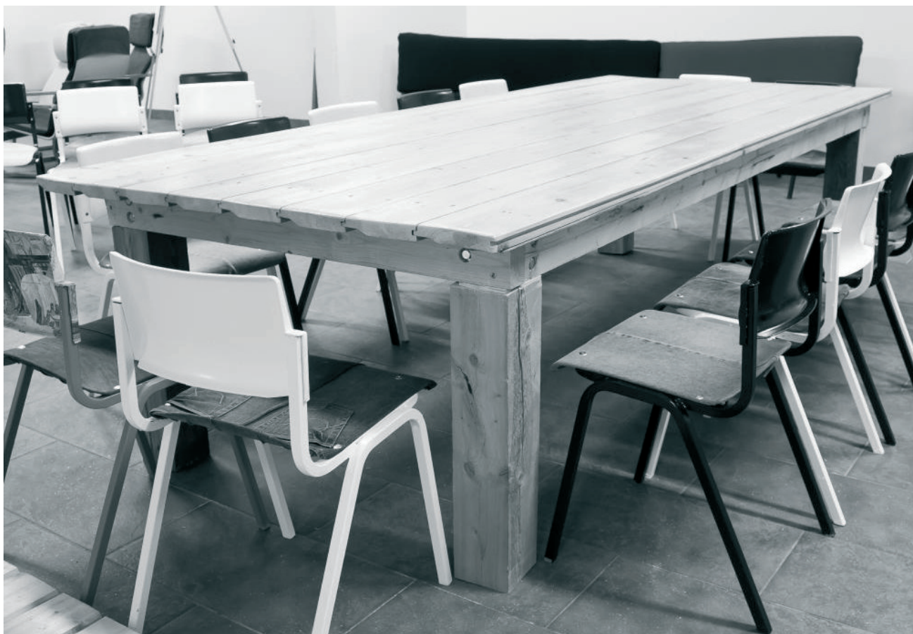
Bord av fuktskadat virke, stolar med avlagda jeans.